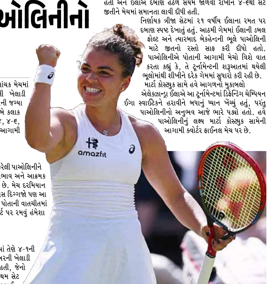
હતી અને ઈલાને દબાણ હેઠળ સંયમ જાળવી રાખીને ૪-૬થી સેટ જીતીને મેચમાં સમાનતા લાવી દીધી હતી.

(એજન્સી) લંડન । તા. 07 વિશ્વભક્ષન ૨૦૨૬ના ગ્રાસ કોર્ટ પર રમાઈ રહેલી અત્યંત રોમાંચક મેચમાં ઈટાલીની જેસ્મિન પાઓલિનીએ ફિલિપાઈન્સની ઉભરતી ખેલાડી એલેક્ઝાન્ડ્રા ઈલાને પરાજય આપીને ક્વોર્ટર ફાઈનલમાં પોતાની જગ્યા સુરક્ષિત કરી લીધી છે. ૨૦૨૪ની ફાઈનલિસ્ટ પાઓલિનીએ બે કલાક અને વીસ મિનિટ સુધી ચાલેલા આ સંઘર્ષપૂર્ણ મુકાબલામાં ૬-૪, ૪-૬, ૬-૩ ના સ્કોરથી જીત મેળવી હતી. આ જીત સાથે હવે તે આગામી રાઉન્ડમાં યુકેનની માર્ટી કોસ્ચુકનો સામનો કરશે.