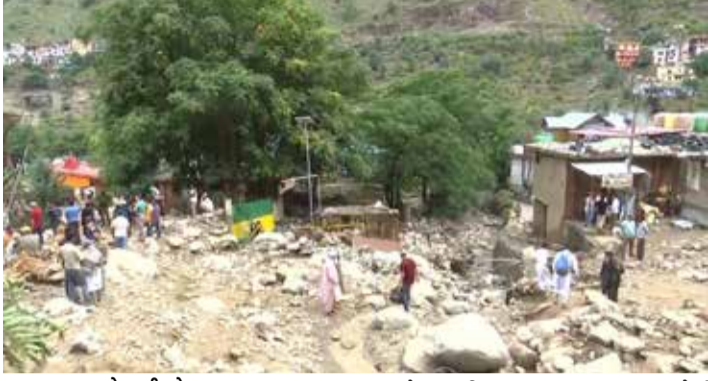
(એજન્સી) ડોડા | તા.07

જાનહાનિ ટળી, સ્થાનિકો દ્વારા સરકાર પાસે તાત્કાલિક સહાયની માંગ