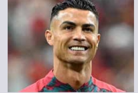
(એજન્સી) લિસ્બન । તા. 07

૨૭ મેચોમાં ૧૧ ગોલ સાથે ભવ્ય કારિયરનો અંત