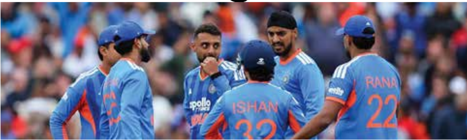
રમવાની શૈલી ઝિમ્બાબ્વે સામે ભારત માટે ગેમ-ચેન્જર સાબિત થઈ શકે છે.

(એજન્સી) હરારે । તા. 07 ઝિમ્બાબ્વે સામે રમાનારી આગામી ૩ ટી-૨૦ મેચોની સિરીઝ માટે ભારતીય ક્રિકેટ ટીમની જાહેરાત કરવામાં આવી છે. આ પ્રવાસ માટે પસંદગીકારોએ યુવા ખેલાડીઓ પર મોટો ધાવ લગાવ્યો છે અને ટીમની કમાન શ્રેયસ અચ્ચરને સોંપવામાં આવી છે, જ્યારે તિલક વર્મા વાઈસ કેપ્ટન તરીકે જવાબદારી સંભાળશે. સૌથી ચોકવાનરી વાત એ છે કે અનુભવી વિકેટકીપર-બેટ્સમેન સંજુ સેમસનને ટીમમાંથી પડતો મૂકવામાં આવ્યો છે, જેણે ક્રિકેટ ચાહકોને આશ્ચર્યમાં મૂકી દીધા છે.