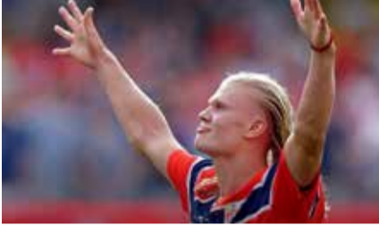
છતાં, બ્રાઝિલ હારથી બચી શક્યું નહીં. નોર્વેના કોચે આ જીતને ફૂટબોલની દુનિયામાં એક ઐતિહાસિક અપેસ્ટ ગણાવી હતી.

(એજન્સી) રિઓ ડી જાનેરો । તા. 07 ફિફા વર્લ્ડ કપ ૨૦૨૬માં નોર્વેના સ્ટાર સ્ટ્રાઈકર એરલિંગ હાલેન્ડે એક એવો ફૂટબોલ ઇતિહાસ રચ્યો છે, જેની યર્થા સમગ્ર વિશ્વમાં થઈ રહી છે. બ્રાઝિલ જેવી પાંચ વખતની ચેમ્પિયન ટીમને ૨-૧થી પરાજય આપીને નોર્વેએ ક્વોર્ટર ફાઈનલમાં પ્રવેશ કર્યો છે. આ મેચમાં હાલેન્ડે બે વિજયી ગોલ ફટકારીને માત્ર ટીમની જીત જ પાકી ન કરી, પરંતુ એક જ વર્લ્ડ કપમાં ચાર મેચ-વિનિંગ ગોલ કરનાર વિશ્વનો ચોથો ખેલાડી બનીને મેસી અને રોનાલ્ડો જેવા દિગ્ગજોને પણ પાછળ છોડી દીધા છે.