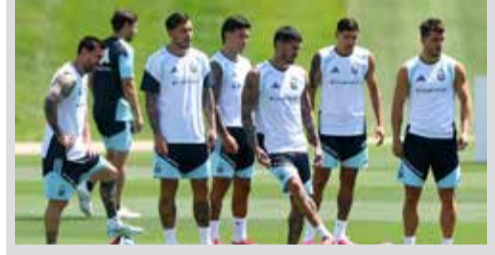
(એજન્સી) એટલાન્ટા । તા. 07

ફિફા વર્લ્ડ કપમાં હાલમાં ૨મી રહેલી વર્તમાન વિશ્વ વિજેતા અર્જેન્ટીનાની ટીમ હવે આગામી મુકાબલામાં ઇજિપ્ત સામે ટકરાવા જઈ રહી છે. આફ્રિકન ટીમ કેપ વર્ડ સામેની સંઘર્ષપૂર્ણ જીત બાદ, અર્જેન્ટીનાના ખેલાડીઓ હવે ઇજિપ્ત સામેની મેચને લઈને અત્યંત સાવધ છે. ટીમ જાણે છે કે નોકઆઉટ તબક્કામાં કોઈ પણ મેચ સરળ હોતી નથી.