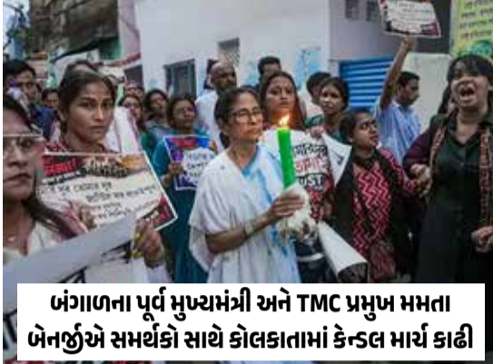
બંગાળના પૂર્વ મુખ્યમંત્રી અને TMC પ્રમુખ મમતા બેનર્જીએ સમર્થકો સાથે કોલકાતામાં કેન્સલ માર્ચ કાઢી

પોસ્ટમોર્ટમમાં પણ આ વાતનો ખુલાસો થયો છે કે આરોપીઓએ બળાત્કાર કર્યા બાદ તેને જીવતી જ તળાવમાં ફેંકી દીધી હતી. તેના ફેફસાં અને પેટમાં પાણી મળ્યું. ડૂબી જવા અને વધુ પડતા રક્તસ્રાવને કારણે તેનું મૃત્યુ થયું.