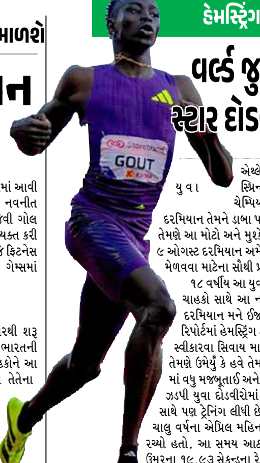
(એજન્સી) બ્રિસ્બેન 1 તા. 10

એથલેટિક્સ જગતના ઉગતા સિતારા અને ઓસ્ટ્રેલિયાના ડિગ્ગજ સ્પ્ર