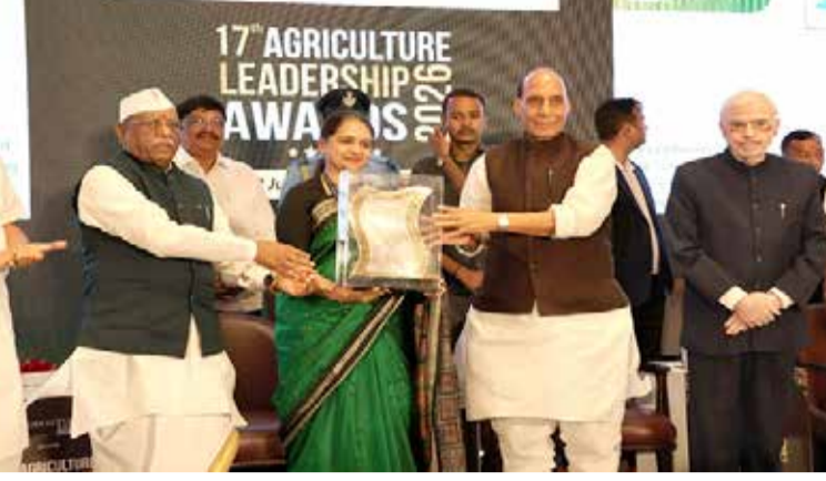
નાણાકીય સુરક્ષા અને AICના નોંધપાત્ર અને પુરાવો છે. પાક વીમાથી જોખમ રક્ષણ પૂરું પાડવામાં પરિવર્તનશીલ યોગદાનનો આગળ વધીને, AIC એ

સન્માનિત કરવામાં આવી છે. ભારત સરકારના માનનીય સંરક્ષણ મંત્રી શ્રી રાજનાથ સિંહે, AICના ચેરમેન - કમ - મેનેજિંગ ડિરેક્ટર (CMD) ડૉ. લાવણ્ય આર. મુંડાયરને આ પ્રતિષ્ઠિત એવોર્ડ અર્પણ કર્ષ્યો. આ માન્યતા પ્રધાનમંત્રી પાક વીમા યોજના (PMFBY) અને પુનર્ગઠિત હવામાન આધારિત પાક વીમા યોજના (RWBCIS) ના અસરકારક અમલીકરણ દ્વારા લાખો ખેડૂતોને