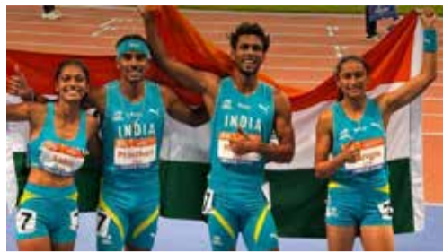
(એજન્સી) ઓરડોસ (ચીન) 1 તા. 10

ચીનના ઓરડોસ શહેરમાં આયોજિત પ્રથમ 'એશિયન અંડર-23 એથલેટિક્સ ચેમ્પિયનશિપ'માં ભારતીય ખેલાડીઓએ શાનદાર પ્રારંભ કર્યો છે. સ્પર્ધાના પ્રથમ દિવસે જ ભારતીય એથલેટ્સે કુલ પાંચ મેડલ જીતીને દેશનું ગૌરવ વધાર્યું છે. જેમાં એક ગોલ્ડ, એક સિલ્વર અને ત્રણ બ્રોન્ઝ મેડલનો સમાવેશ થાય છે.