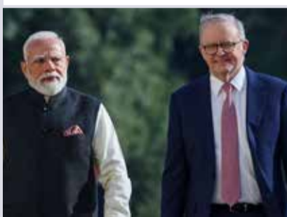
(એજન્સી) વેલિંગ્ટન 1 તા. 10

ભારત અને ઓસ્ટ્રેલિયા વચ્ચેના રમતગમતના સંબંધોમાં એક નવો અને ઐતિહાસિક અધ્યાય ઉભરાવા જઈ રહ્યો છે. ઓસ્ટ્રેલિયાની પ્રખ્યાત ટી-20 ટૂર્નામેન્ટ 'બિગ બેશ લીગ' (BBL) ની આગામી 2026-27 સીઝનનું ભવ્ય આયોજન હવે ભારતીય પરતી પરથી થવા જઈ રહ્યું છે. વડાપ્રધાન નરેન્દ્ર મોદી અને ઓસ્ટ્રેલિયાના વડાપ્રધાન એન્ટોની અલ્બાનિઝે સંયુક્ત રીતે આ મોટી જાહેરાત કરતા જણાવ્યું હતું કે, ડિસેમ્બર મહિનામાં ચેન્નઈના એમ.એ. વિદ્યમ્બરમ સ્ટેડિયમ (ચેપોક) ખાતે આ ટૂર્નામેન્ટનો પ્રથમ મુકાબલો રમાશે.