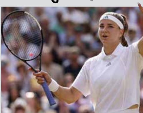
(એજન્સી) લંડન 1 તા. 10

વિમ્બલ્ડન ૨૦૨૬ ની ગ્રાન્ડ સ્લેમ સ્પર્ધામાં ચેક રિપબ્લિકની કેરોલિના મુચોવાએ શાનદાર દેખાવ કરીને ફાઈનલમાં પ્રવેશ કરી લીધો છે. સેમીફાઈનલમાં એક અત્યંત રોમાંચક અને સંઘર્ષપૂર્ણ મુકાબલામાં તેમણે ક્રોકો ગૌકને ૬-૨, ૧-૬, ૭-૬ (૧૨-૧૦) થી હરાવીને પોતાના પ્રથમ વિમ્બલ્ડન ફાઈનલનો રસ્તો સાફ કર્યો છે. સેમીફાઈનલ મેચમાં મુચોવા અને ગૌક વચ્ચે રસાકસીનો જંગ જોવા મળ્યો હતો. પ્રથમ સેટમાં મુચોવાએ આરામથી જીત મેળવી હતી, પરંતુ બીજા સેટમાં ગૌકે જોરદાર વાપસી કરી હતી. નિર્ણાયક ત્રીજા સેટમાં બંને ખેલાડીઓ વચ્ચે પોઈન્ટ-ટુ-પોઈન્ટ સંઘર્ષ જોવા મળ્યો હતો. ટાઈ-બ્રેકમાં મુચોવાએ મક્કમતા દાખવીને અંતે જીત પોતાના નામે કરી હતી. પોતાની કારકિર્દીના અંતિમ તબક્કે પહોંચેલી મુચોવા માટે વિમ્બલ્ડન હંમેશા પડકારરૂપ રહ્યું હતું, પરંતુ આ વર્ષે તેમણે ઇતિહાસ રચી દીધો છે. હવે ફાઈનલમાં મુચોવાનો મુકાબલો તેમની જ દેશની સાથી ખેલાડી લિન્ડા નોસ્કોવા સાથે થશે. નોસ્કોવાએ સેમીફાઈનલમાં યુક્રેનની માર્ટા કોસ્ચુકને ૬-૪, ૬-૪ થી હરાવીને ફાઈનલમાં સ્થાન મેળવ્યું છે. ૨૦૦૮ માં સેરેના અને વિનસ વિલિયમ્સ વચ્ચેની ફાઈનલ બાદ, હવે ફરી એકવાર એક જ દેશના બે ખેલાડીઓ વિમ્બલ્ડનના વિમ્બે સિંગલ્સ ફાઈનલમાં સામસામે ટક્કરશે.