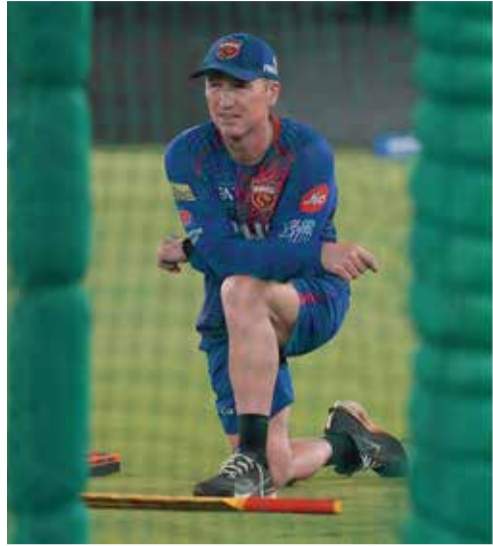
(એજન્સી) હૈદરાબાદ । તા. 06

આઈપીએલ ૨૦૨૬ની સીઝન હવે તેના નિર્ણાયક તબક્કા તરફ આગળ વધી રહી છે, ત્યારે બુધવારે પંજાબ ક્રિકેટ (PBKS) અને સનરાઈઝર્સ હૈદરાબાદ (SRH) વચ્ચે રોમાંચક મુકાબલો ખેલાશે. આ મેચ પહેલાં પંજાબ ક્રિકેટના આસિસ્ટન્ટ કોચ બ્રેડ હેડિંગે મોટું નિવેદન આપતા જણાવ્યું છે કે તેમની ટીમ મેદાન પર 'પરફેક્ટ ગેમ' રજૂ કરવા માટે ઉત્સુક છે. પંજાબની ટીમ અત્યારે પોઈન્ટ ટેબલમાં ૧૩ પોઈન્ટ સાથે ટોચ પર હોવા છતાં, છેલ્લી બે હાર બાદ ફરી લય મેળવવા મેદાનમાં ઉતરશે.