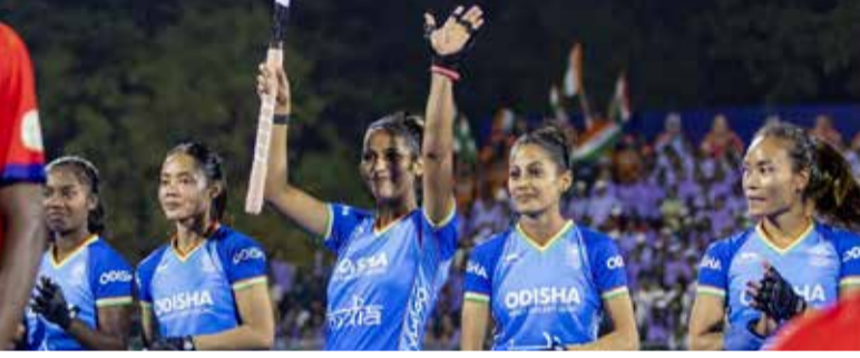
(એજન્સી)બેંગલુરુ તા. 14

ભારતીય મહિલા રાષ્ટ્રીય હોકી ટીમ જૂન મહિનામાં યોજાનારા પ્રતિષ્ઠિત એફઆઈએચ (FIH) હોકી નેશન્સ કપ પૂર્વે પોતાની સજ્જતા ચકાસવા માટે ઓસ્ટ્રેલિયાના પ્રવાસે જશે. ૨૧ મે થી ૩ જૂન દરમિયાન યોજાનારો આ પ્રવાસ ભારતીય ટીમ માટે અત્યંત મહત્વનો સાબિત થશે, કારણ કે ત્યારબાદ ટીમ સીધી ન્યુઝીલેન્ડના ઓકલેન્ડ ખાતે ૧૫ થી ૨૧ જૂન દરમિયાન રમાનારા નેશન્સ કપમાં ભાગ લેશે. ભારતીય ટીમ હાલમાં બેંગલુરુ સ્થિત સાઈ (SAI) સેન્ટરમાં સખત તાલીમ લઈ રહી છે.