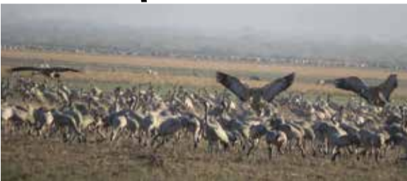
સંકળાયેલ સોલાર પ્રોજેક્ટ શરૂ થવાનો છે. આ ચર્ચાએ સ્થાનિકો અને પક્ષીપ્રેમીઓમાં ચિંતા ઊભી કરી છે. સોશિયલ મીડિયામાં વાયરલ થયેલા એક વિડિઓમાં કુંજ પક્ષીઓની પુકાર લોકોને ભાવુક બનાવી રહી છે. નખત્રાણા તાલુકા પંચાયત

કચ્છની પ્રસિદ્ધ છારી ઢંઢ રામસર સાઈટ નજીક આવેલું કિરો ડુંગર છેલ્લા કેટલાક દિવસોથી ચર્ચાના કેન્દ્રમાં આવ્યું છે. કુદરતી સૌંદર્ય અને વિવિધસભર પક્ષીજીવન માટે ઓળખાતું આ સ્થળ દર વર્ષે મોટી સંખ્યામાં આવતા કુંજ પક્ષીઓના આરામસ્થાન તરીકે પ્રસિદ્ધ છે. જેના કારણે આ વિસ્તાર પ્રકૃતિપ્રેમીઓ, પક્ષી નિરીક્ષકો અને ફોટોગ્રાફરો માટે વિશેષ આકર્ષણનું કેન્દ્ર બની રહ્યું છે. તાજેતરમાં સ્થાનિકોમાં એવી ચર્ચા ચાલી રહી છે કે ડુંગરના ભાગોડે NTPC સાથે