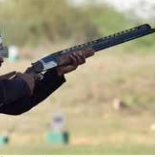
(એજન્સી) નવી દિલ્હી । તા. 14

જાપાનના આઈથી-નાગોયા ખાતે યોજાનારી આગામી એશિયન ગેમ્સ ૨૦૨૬ માટે જાહેર કરવામાં આવેલી ભારતીય શૂટિંગ ટીમમાં એક મોટો વિવાદ સર્જાયો છે. એશિયાના નંબર ૧ અને વિશ્વના છઠ્ઠા ક્રમાંકિત ટ્રેપ શૂટર જોરાવર સિંહ સંધુની ટીમમાંથી બાદબાકી કરવામાં આવી છે. આ નિર્ણયથી રમતજગતમાં આશ્ચર્ય ફેલાયું છે, કારણ કે જોરાવર સિંહે ગત વર્ષે વર્લ્ડ ટ્રેપ શૂટિંગમાં ભાગ લેવા છતાં તેમણે ૧૧૯૦નો સ્કોર નોંધાવ્યો હતો, જે ભારતીય ટુકડીમાં સૌથી વધુ હતો. સરખામણી કરીએ તો, ટીમમાં પસંદ થયેલા અન્ય શૂટરોનો સ્કોર જોરાવર કરતા ઓછો રહ્યો છે.