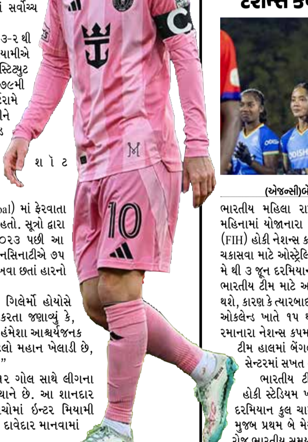
એમએલએસના ઇતિહાસમાં સર્વોચ્ચ છે.

મેચની શરૂઆતથી જ મેસી આક્રમક મૂડમાં જોવા મળ્યો હતો. તેણે ૨૪મી મિનિટે પ્રથમ ગોલ કરીને ટીમને લીડ અપાવી હતી. જોકે, સિનસિનાટીએ વળતો પ્રહાર કરતા ૪૧મી અને ૪૯મી મિનિટે ગોલ કરી મિયામીને બેકફૂટ પર ધકેલી દીધું હતું. મેસીએ ૫૫મી મિનિટે પોતાનો બીજો ગોલ કરીને સ્કોર ૨-૨ થી સરભર કર્યો હતો. મીડિયા અહેવાલ મુજબ, ૨૦૨૩માં ક્લબ રૂબેરૂ કર્યા પછી મેસીની આ ૨૧મી એવી મેચ છે જેમાં તેણે એકથી વધુ ગોલ કર્યા હોય, જે