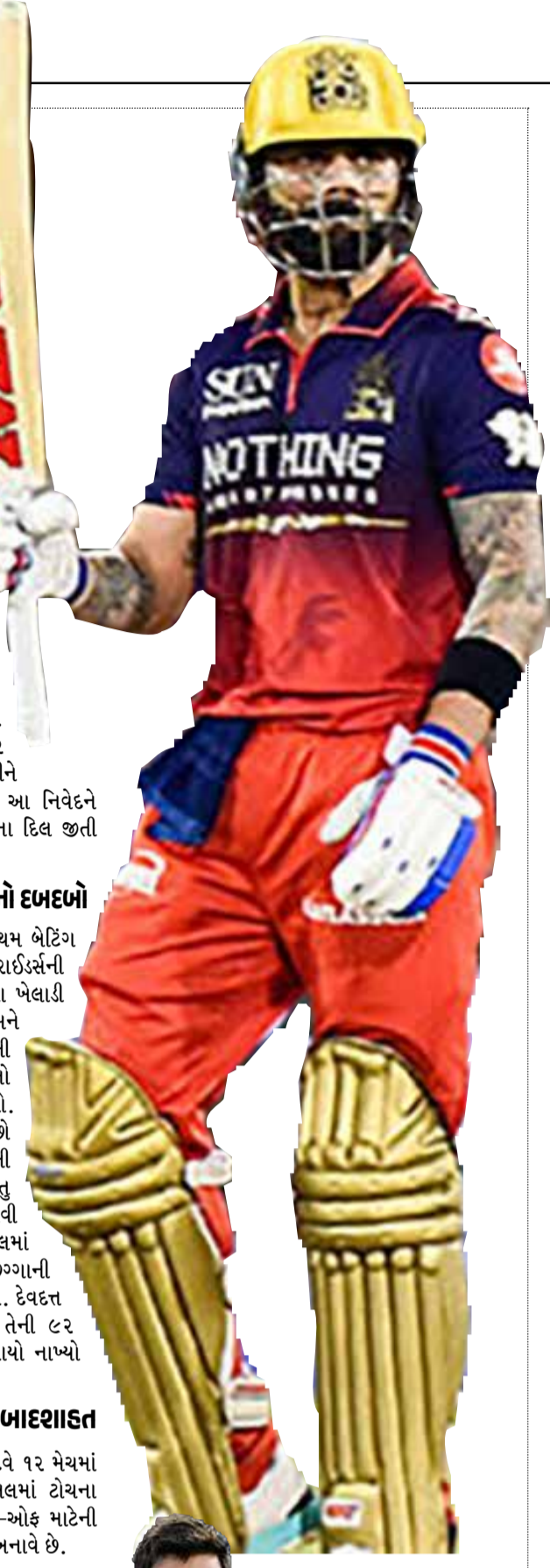
મેચનો રોમાંચ: આરસીબીનો દબદબો

મેચ જતાજતા બાદ જ્યારે વિરાટ કોહલી એવોર્ડ લેવા આવ્યો, ત્યારે તેના ચહેરા પર જીતના આનંદ સાથે એક અલગ જ ગંભીરતા જોવા મળી હતી. પોતાની ઈનિંગ અને ભવિષ્ય વિશે વાત કરતા કોહલી થોડો ઈમોશનલ જણાયો હતો. તેણે હૃદયસ્પર્શી રીતે કહ્યું હતું કે, "મને ક્રિકેટ સાથે સાચો પ્રેમ છે અને મેદાન પર સર્વશ્રેષ્ઠ ખેલાડીઓ સામે રમવું એ મારા માટે ગર્વની વાત છે. પરંતુ હું રમાયેલી હાઈ-વોલ્ટેજ મેચમાં 'કિંગ' વિરાટ કોહલીએ પોતાની બેટિંગના તેજથી ચિન્નાસ્વામી સ્ટેડિયમને ઝળહળાવી દીધું હતું. કોહલીએ આઈપીએલ કારિયરની ૯મી સદી ફટકારીને માત્ર પોતાની ટીમને જીત જ નથી અપાવી, પરંતુ વિશ્વ ક્રિકેટમાં પોતાનું વર્ચસ્વ ફરી એકવાર સાબિત કર્યું છે. કોહલીની ૧૦૫ રનની અણનમ ઈનિંગની મદદથી આરસીબીએ કોલકાતાને ૬ વિકેટે હરાવીને પોઈન્ટ ટેબલમાં પ્રથમ સ્થાન કબજે કરી લીધું છે.