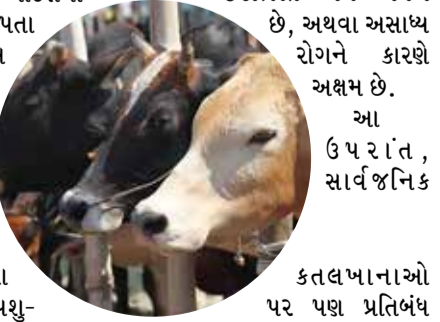
કતલખાનાઓ પર પણ પ્રતિબંધ મૂકવામાં આવ્યો છે.

ઉલ્લંઘન કરવા પર થયો જેલ, સુવેન્દુ સરકાર 75 વર્ષ જુનો કાયદો લાવી; સરકારી સર્ટિફિકેટ વિના ગાય, બળદ, ભેંસ મારી શકાયો નહીં (એજન્સી) પશ્ચિમ બંગાળ તા. 14 પશ્ચિમ બંગાળની BJP સરકારે રાજ્યમાં ગાયોની હત્યા પર પ્રતિબંધ મૂક્યો છે. CM સુવેન્દુએ 1950ના બંગાળ કાયદા અને 2018ના કલકત્તા હાઈકોર્ટના આદેશનો હવાલો આપતા એક નોટિસ જારી કરી છે. આ નોટિસમાં કહેવામાં આવ્યું છે કે 'ફિટનેસ સર્ટિફિકેટ' વિના કોઈપણ પશુ-ભેંસની હત્યા સંપૂર્ણપણે પ્રતિબંધિત છે. બંગાળ સરકારે કહ્યું કે ફિટનેસ સર્ટિફિકેટ ફક્ત કોઈ નગરપાલિકાના અધ્યક્ષ, કોઈ પંચાયત સમિતિના પ્રમુખ અને એક સરકારી પશુચિકિત્સક સાથે મળીને જારી કરવામાં આવશે. આ સર્ટિફિકેટ ત્યારે જ જારી થશે જ્યારે ઓથોરિટી સહમત થાય કે પ્રાણી 14 વર્ષથી વધુ ઉંમરનું છે, તે પ્રજનન માટે લાયક નથી અને ઘરડું છે. ઈજાગ્રસ્ત અને અર્પંગ છે, અથવા અસાચ્ય રોગને કારણે અક્ષમ છે. આ ઉપરાંત, સાર્વજનિક કતલખાનાઓ પર પણ પ્રતિબંધ મૂકવામાં આવ્યો છે. સરકારે કહ્યું છે કે પ્રાણીઓની હત્યા ફક્ત નગરપાલિકાના કતલખાનામાં, અથવા સ્થાનિક પ્રશાસન દ્વારા નિર્ધારિત કતલખાનામાં જ કરવામાં આવશે.