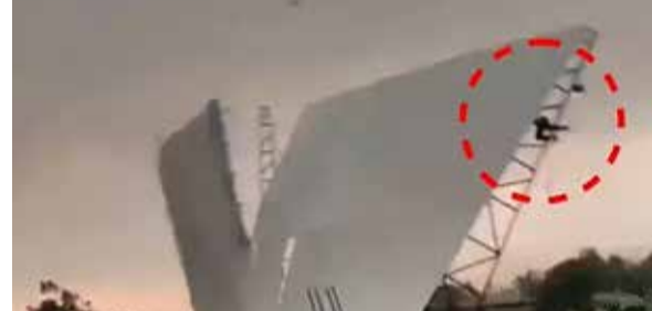
આ તસવીર બરેલીની છે. વાવાઝોડા દરમિયાન એક યુવાન ટિન શેડ સાથે હવામાં લગભગ 50 ફૂટ ઉડ્યો હતો.

(એજન્સી) લોપાલ/જયપુર/લખનઉ/પટના । તા. 14 દેશમાં બે પ્રકારનું હવામાન જોવા મળી રહ્યું છે. ઉત્તર પ્રદેશના પ્રયાગરાજ-અયોધ્યા સહિત 30 જિલ્લાઓમાં બુધવારે વાવાઝોડાને કારણે 94 લોકોના મોત થયા. સૌથી વધુ 17 મોત પ્રયાગરાજ અને 16 મોત ભદોલીમાં થયા છે. ઉત્તર પ્રદેશમાં 80 KMPHની ઝડપે વાવાઝોડું ફૂંકાયું, બરેલીમાં વાવાઝોડામાં એક યુવક ટિનશેડ સહિત હવામાં ઉડ્યો. રાજ્યના બાંદા શહેરમાં તાપમાન 45.4C રહ્યું. આજે 51 જિલ્લાઓમાં ભારે વાવાઝોડા-વરસાદનું એલર્ટ છે. બારાબંકી, સીતાપુર અને દેવરિયા સહિત ઘણા જિલ્લાઓના 2000થી વધુ ગામોમાં વીજળી જુલ થઈ છે. રાજસ્થાનમાં પણ ભારે ગરમી અને હીટવેવની અસર છે. બુધવારે સતત ચોથા દિવસે રાજ્યનું જેસલમેર દેશનું સૌથી ગરમ શહેર રહ્યું, અહીં 46.1C તાપમાન રહ્યું. હવામાન વિભાગ મુજબ આજે બીકાનેર, જોધપુર, જેસલમેર અને બાડમેરમાં ભારે ગરમીનું રેડ એલર્ટ છે. 13 જિલ્લાઓમાં હીટવેવનું એલર્ટ છે. જ્યારે, મધ્ય પ્રદેશના 25થી વધુ જિલ્લાઓમાં હીટવેવ ચાલી રહી છે, જે 18 મે સુધી ચાલુ રહી શકે છે. બુધવારે ખજુરાહોમાં તાપમાન 45.4C રહ્યું. આજે ઈન્દોર, જજ્જન, ધાર અને રતલામમાં હીટવેવનું ઓરેન્જ એલર્ટ છે. આ જિલ્લાઓમાં વોર્મ નાઈટનું પણ એલર્ટ છે.