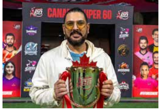
(એજન્સી) સાઉદી અરેબિયા । તા. 15

સાઉદી અરેબિયા આ વર્ષે ઓક્ટોબરમાં તેની પ્રથમ કેન્યાઈઝી ક્રિકેટ લીગ શરૂ કરવા જઈ રહ્યું છે. યુન્સ લીગ T20 નામની આ લીગ 6 ટીમ સાથે રમાશે.