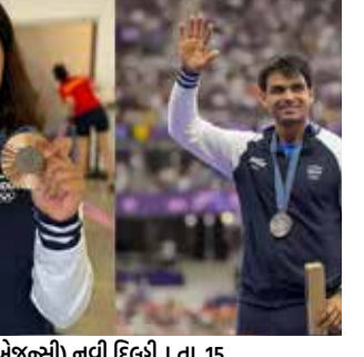
(એજન્સી) નવી દિલ્હી । તા. 15

ક્રોમનવેલ્ય ગેમ્સ અને એશિયન ગેમ્સને ધ્યાનમાં રાખીને મિશન ઓલિમ્પિક સેલ એ ભારતના સ્ટાર એથલીટ્સ માટે વિદેશી ટ્રેનિંગ કેમ્પને મંજૂરી આપી છે. બુધવારે યોજાયેલી MOCની 173મી બેઠકમાં બે વખતના ઓલિમ્પિક પદક વિજેતા નીરજ ચોપરાના 47 દિવસના સ્વિટ્ઝર્લેન્ડ ટ્રેનિંગ કેમ્પને મંજૂરી આપવામાં આવી હતી. TOPS ગ્રેડ સુપરમાં સામેલ નીરજ ચોપરા હાલમાં તુર્કીમાં પીટની ઈજામાંથી સાજા થઈ રહ્યા છે. તેઓ 25 મે થી 10 જુલાઈ દરમિયાન સ્વિટ્ઝર્લેન્ડના બિએન સ્થિત