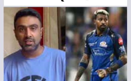
મુંબઈ । તા. 19

ઈન્ડિયન પ્રીમિયર લીગ ૨૦૨૬માં પૂર્વ ચેમ્પિયન ટીમ મુંબઈ ઈન્ડિયન્સ માટે મુશ્કેલીઓ ઓછી થવાનું નામ નથી લઈ રહી. વર્તમાન સીઝનમાં ટીમના કથળતા પ્રદર્શન અને ખેલાડીઓ વચ્ચેના તાલમેલના અભાવને કારણે ક્રિકેટ જગતમાં ભારે હોબાળો મચી ગયો છે. રોહિત શર્મા જેવા દિગ્ગજ ખેલાડી બાદ ટીમની કમાન સંભાળનાર ઓલરાઉન્ડર હાર્દિક પંડ્યા અત્યારે ચાહકો અને સમીક્ષકોના નિશાના પર છે. સતત મળી રહેલી હારના કારણે ફેન્સમાં નેતૃત્વ બદલવાની અફવાઓ પણ જોર પકડી રહી છે.