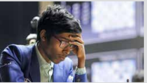
(એજન્સી) વેનિઝાલા । તા. 19

આંતરરાષ્ટ્રીય ચેસ મંચ પર ભારતનું નામ સતત રોશન કરી રહેલા યુવા ભારતીય ગ્રાન્ડમાસ્ટરે વધુ એક વખત પોતાની અદભુત બુદ્ધિપ્રતિભા અને અજોડ રમત કૌશલ્યનો પરિચય આપ્યો છે. પ્રતિષ્ઠિત વૈશ્વિક ટૂર્નામેન્ટના પાંચમા રાઉન્ડમાં રમાયેલી એક અત્યંત મહત્વપૂર્ણ અને રસાકસીભરી મેચમાં ભારતીય ખેલાડીએ અમેરિકાના મજબૂત હરીફ સામે શાનદાર પ્રદર્શન કરીને અજેય રહેવાનો પોતાનો રેકોર્ડ જાળવી રાખ્યો છે. આ પરિણામ સાથે જ ટૂર્નામેન્ટના પોઈન્ટ ટેબલમાં ટોચના સ્થાનો માટેની સ્પર્ધા વધુ રોમાંચક બની ગઈ છે.