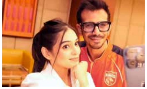
(એજન્સી) મુંબઈ । તા. 19

ભારતીય ક્રિકેટ જગતના સ્ટાર સ્પિનર અને સોશિયલ મીડિયા સેલિબ્રિટીઓના અંગત જીવનને લઈને અવારનવાર અનેક અફવાઓ બજારમાં ઉડતી રહે છે. છેલ્લા કેટલાક મહિનાઓથી ઈન્ટરનેટ પ્લેટફોર્મ પર ચાલી રહેલા એક કથિત ઘાટ-પ્રોકાઈલ વિવાદે ભારે ચર્ચા જગાવી હતી. જાણીતી ટેલિવિઝન જોકી અને ક્રિકેટર વચ્ચેના સંબંધોમાં તિરાડ પડી હોવાના અહેવાલો સતત વાયરલ થઈ રહ્યા હતા. આ તમામ અટકળો અને સોશિયલ મીડિયા પર એકબીજાને દૂર કરવાના મુદ્દે આખરે સંબંધિત સેલિબ્રિટીએ સત્તાવાર નિવેદન આપીને સ્થિતિ સ્પષ્ટ કરી દીધી છે.