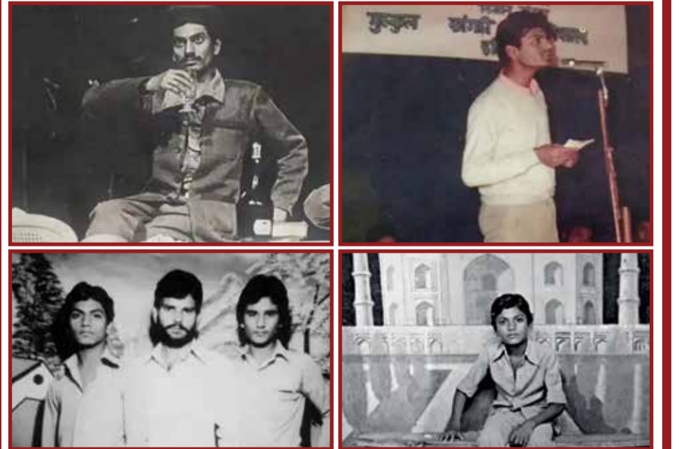
નવાઝુદીન સિદ્દીકીનો જન્મ ઉત્તર પ્રદેશના બુઢાણા (મુઝફ્ફરનગર)માં જમીનદારના ઘરે થયો હતો. પ્રી-મેચ્યર નવાઝ 8 ભાઈ-બહેનોમાં સૌથી મોટો હતો. ઘરના લોકો ખેતી કરતા હતા, પરંતુ નવાઝુદીનને ભણવામાં રસ હતો.