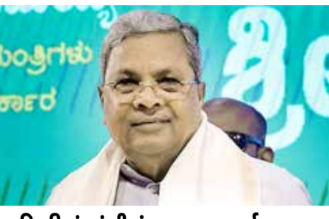
● દિલ્હીમાં લાંબી મંત્રણા બાદ કર્ણાટક કોંગ્રેસમાં મોટા ફેરફારોના અંધારા

(એજન્સી) નવી દિલ્હી । તા. 27 કર્ણાટકના રાજકારણમાં હાલમાં ગંભીર (જ્યલપાથલના સંકેતો મળી રહ્યા છે. મુખ્યમંત્રી સિદ્ધારમૈયા આવતીકાલે પોતાનું પદ છોડી શકે છે તેવી પ્રબળ અટકળો તેજ બની છે. પ્રાપ્ત માહિતી અનુસાર, સિદ્ધારમૈયાએ રાજ્યપાલ થાવરચંદ ગોહલોતને મળવા માટે સમય માંગ્યો છે, જેના કારણે તેમના રાજીનામાની શક્યતાઓ વધી ગઈ છે. કોંગ્રેસના ધારાસભ્ય આરવી દેશપાંડેએ પણ ઘવો કર્યો છે.