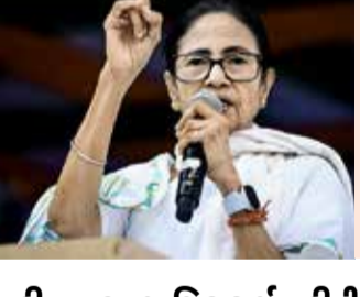
વકીલ દ્વારા ન્યાયિક કાર્યવાહીની માંગ અને જૂની હેરાનગતિનો આક્ષેપ આ હાઈ-પ્રોફાઇલ સાયબર ફરિયાદ સ્થાનિક મહિલા વકીલ રિકી ચેટર્જી સિંહ દ્વારા દાખલ કરવામાં આવી છે. તેમણે મીડિયા સમક્ષ આક્ષેપ વ્યક્ત કરતા જણાવ્યું હતું કે પૂર્વ મુખ્યમંત્રી જેવા જવાબદાર પદ પર રહેલી વ્યક્તિના આવા બેજવાબદાર નિવેદનોની કરોડો નાગરિકોની ધાર્મિક અને સાંસ્કૃતિક ભાવનાઓને ઊંડી ઠેસ પહોંચી છે.

(એજન્સી) કોલકાતા । તા. 27 પશ્ચિમ બંગાળના પૂર્વ મુખ્યમંત્રી અને તૃણમૂલ કોંગ્રેસના સુપ્રીમો મમતા બેનર્જીની રાજકીય અને કાનૂની મુશ્કેલીઓમાં મોટો વધારો થયો છે. મમતા બેનર્જી વિરુદ્ધ સિલીગુડીના સાયબર પોલીસ સ્ટેશનમાં સત્તાવાર રીતે એક ગંભીર ફરિયાદ નોંધાવવામાં આવી છે. પૂર્વ મુખ્યમંત્રી પર આરોપ છે કે તેમણે વર્ષ ૨૦૨૫ માં કોલકાતા ખાતે આયોજિત એક પવિત્ર ઈદ કાર્યક્રમ દરમિયાન જાહેર મંચ પરથી સનાતન અને હિંદુ ધર્મને લઈને અત્યંત વાંધાજનક તેમજ અપમાનજનક ટિપ્પણી કરી હતી. આ વિવાદ એ ચોક્કસ નિવેદનને લઈને વકર્યો છે, જેમાં સનાતન સંસ્કૃતિ માટે 'ગંદો ધર્મ' જેવા અત્યંત અશોભનીય શબ્દોનો પ્રયોગ કરવાનો ગંભીર આક્ષેપ મૂકવામાં આવ્યો છે. જોકે, આ સંવેદનશીલ વિવાદ પર મમતા બેનર્જી અથવા તેમના પક્ષ દ્વારા હજુ સુધી કોઈ સત્તાવાર સ્પષ્ટતા કે પ્રતિક્રિયા આપવામાં આવી નથી.