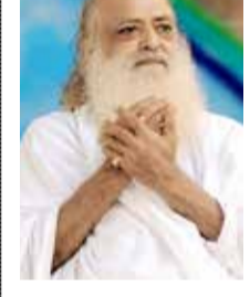
(એજન્સી) જોધપુર । તા. 27 રાજસ્થાન હાઈકોર્ટ (જોધપુર) એ બુધવારે (27 મે) સવારે આસારામની સજા પર ચુકાદો આપ્યો. હાઈકોર્ટે સગીર સાથેના યૌન શોષણના કેસમાં આજીવન કેદની સજાને યથાવત રાખી છે. જસ્ટિસ અરુણ મોગા અને જસ્ટિસ યોગેન્દ્ર કુમાર પુરોહિતની ડિવિઝન બેન્ચે આ ચુકાદો આપ્યો.

● રાજસ્થાન હાઈકોર્ટનો ચુકાદો, સગીરાના યૌન શોષણ કેસમાં આસારામના શિષ્યા શિલ્પી અને શરતચંદ્ર નિર્દોષ