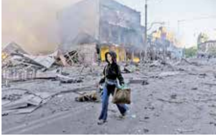
મચી ગઈ છે.

પૂર્વ યુરોપના યુદ્ધગ્રસ્ત ક્ષેત્રમાંથી આ સમયના સૌથી મોટા અને અત્યંત ચિંતાજનક સમાચાર સામે આવી રહ્યા છે. મોસ્કોના સત્તાધીશો દ્વારા યુક્રેનની રાજધાની કીવ પર એક અત્યંત પ્રચંડ અને વિનાશક સૈન્ય કાર્યવાહી કરવાની ખુલ્લી ધમકી આપવામાં આવી છે. રશિયન સેનાએ ગત રાત્રિ દરમિયાન જ સમગ્ર યુક્રેન પર એકસાથે ૧૦૦થી વધારે આધુનિક ડ્રોન અને બે શક્તિશાળી બેલેસ્ટિક મિસાઇલો છોડીને ચારેતરફ તબાહી મચાવી દીધી છે, જેની સત્તાવાર પુષ્ટિ યુક્રેનના એરફોર્સ દ્વારા મંગળવારે સવારે જાહેર કરાયેલા એક નિવેદનમાં કરવામાં આવી છે. આ ભયાનક સૈન્ય આક્રમણની વચ્ચે રશિયાએ કીવમાં સ્થિત તમામ વિદેશી ડિપ્લોમેટિક મિશનના સભ્યો અને રાજદ્વારીઓને વહેલામાં વહેલી તકે રાજધાની છોડી દેવા માટે કડક શબ્દોમાં તાકીદ કરી છે. આ આદેશને પગલે આંતરરાષ્ટ્રીય સ્તરે રાજદ્વારી આલમમાં ભારે દોડપલામ