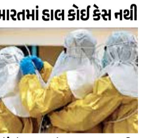
કોંગોમાં ઇબોલા વાયરસથી 80 મૃત્યુ, 246 શંકાસ્પદ કેસ કોંગોના પૂર્વિય ઈટુરી પ્રાંતમાં ઈબોલાથી અત્યાર સુધીમાં 80 લોકોના મોત થયા છે. 246 શંકાસ્પદ કેસ સામે આવ્યા છે. વિશ્વ આરોગ્ય સંસ્થા (WHO) એ તેને ગ્લોબલ હેલ્થ ઈમરજન્સી જાહેર કરી છે. જોકે, WHOનું કહેવું છે કે તે મહામારીની શ્રેણીમાં આવતું નથી.

(એજન્સી) નવી દિલ્હી । તા. 27 ભારત સરકારે બુધવારે જણાવ્યું કે દેશમાં ઈબોલા વાયરસનો એક પણ કેસ નથી. સરકારને આ સ્પષ્ટતા એટલા માટે કરવી પડી કારણ કે યુગાન્ડાથી ભારત આવેલી એક મહિલામાં ઈબોલા જેવા લક્ષણો જોવા મળ્યા હતા. મહિલા 23 મેના રોજ બેંગલુરુ એરપોર્ટ પહોંચી હતી. જે બાદ તેને સાવચેતીના ભાગરૂપે સરકારી હોસ્પિટલમાં આઈસોલેશનમાં રાખવામાં આવી હતી. મહિલાના શરીરમાં હળવો દુખાવો હતો, જોકે હવે તે સંપૂર્ણપણે સ્વસ્થ છે. તેનો એક સેમ્પલ તપાસ માટે 'નેશનલ ઈન્સ્ટિટ્યૂટ ઓફ વાયરોલોજી' (NIV) મોકલી દેવામાં આવ્યો છે.