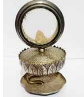
સારિપુત અને મહામોગ્ગલ્લાનના પવિત્ર અવશેષો

સંસ્કૃતમાં સારિપુત તરીકે જાણીતા સારિપુત, બુદ્ધિ અને સિદ્ધાંતોના વિશ્લેષણના પરમ ગુરુ તરીકે પ્રખ્યાત થયા. બૌદ્ધ ગ્રંથો તેમને “અસાધારણ બૌદ્ધિક સ્પષ્ટતા” અને “ચોકસાઈ તેમજ કડુશા સાથે ઉપદેશો સમજાવવાની અજોડ ક્ષમતા” ધરાવતા હોવાનું વર્ણવે છે. તેમણે મઠના શિસ્તની દેખરેખ રાખી, ધ્યાન પદ્ધતિઓનું