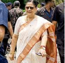
મુખ્યમંત્રીની બેઠકમાં હાજરી અને સ્વતંત્રતાનો દાવો આ સમગ્ર હાઈ-પ્રોફાઇલ વિવાદની પૃષ્ઠભૂમિ એ છે કે સાંસદ કાકોલી ઘોષ સોમવારે કલ્યાણી ખાતે રાજ્યના મુખ્યમંત્રી શુભેન્દુ અધિકારીની અધ્યક્ષતામાં આયોજિત એક અંતિમ મહત્વપૂર્ણ બેઠકમાં રૂબરૂ સામેલ થયા હતા. પક્ષના હિતધારકો અને વરિષ્ઠ નેતૃત્વ દ્વારા તેમને આ બેઠકમાં ન જવા માટે અગાઉથી જ અનોપચારિક રીતે સખત મનાઈ કરવામાં આવી હોવા છતાં તેમણે આ આદેશની અવગણના કરી હતી.

(એજન્સી) નવી દિલ્હી । તા. 27 પશ્ચિમ બંગાળના રાજકારણમાં અત્યાર સુધીનો સૌથી મોટો સંગઠનાત્મક ફેરફાર અને હોબાળો સામે આવ્યો છે, જેના કારણે સત્તાધારી પક્ષના ઔદારિક વડુઓમાં ભારે ચિંતા વ્યાપી ગઈ છે. તૃણમૂલ કોંગ્રેસના વરિષ્ઠ અને જાણીતા સાંસદ કાકોલી ઘોષ દસ્તીદારે પક્ષના તમામ મહત્વપૂર્ણ સંગઠનાત્મક હોદ્દા પરથી સત્તાવાર રીતે પોતાનું રાજીનામું ધરી દીધું છે. બારાસાત લોકસભા બેઠકનું પ્રતિનિધિત્વ કરતા મહિલા સાંસદ રાજ્ય એકમના અધ્યક્ષ સુબ્રતા બક્ષીને પત્ર લખીને આ ચોકાવનારો નિર્ણય જાહેર કર્યો છે. જોકે, તેમણે પક્ષ સાથેનો છેડો ફાડવાની અટકળોનો સ્પષ્ટ ઈનકાર કર્યો છે અને જણાવ્યું છે કે તેઓ ભવિષ્યમાં પણ એક વફાદાર અને સામાન્ય કાર્યકરની જેમ પક્ષની સેવા કરતા રહેશે. આ ઘટનાક્રમ બાદ રાજ્યના વહીવટી માળખામાં મોટી હલચલ જોવા મળી રહી છે.