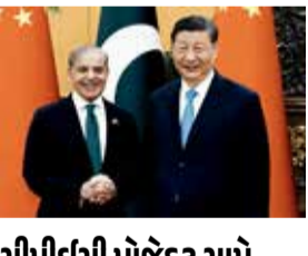
સીપીઈસી પ્રોજેક્ટ સામે ભારતનો સાર્વભૌમત્વ વિરોધ ચીન-પાકિસ્તાનના સંયુક્ત નિવેદનમાં માત્ર કાશ્મીર જ નહીં, પરંતુ વિવાદાસ્પદ 'ચીન-પાકિસ્તાન આર્થિક કોરિડોર' (CPEC) પ્રોજેક્ટનો ખાસ ઉલ્લેખ કર્યો પછી આવી છે. PoKમાં પસાર થઈ રહેલી આ અબજો ડોલરની પરિયોજનાઓનો સૈદ્ધાંતિક અને રાજદ્વારી સ્તરે ભારે વિરોધ નોંધાવ્યો છે.

(એજન્સી) નવી દિલ્હી । તા. 27 પાકિસ્તાનના વડાપ્રધાન શાહબાઝ શરીફ 23 થી 26 મે સુધી ચીનના પ્રવાસે છે. તેમણે ચીનના રાષ્ટ્રપતિ શી જિનપિંગ સાથે મુલાકાત પણ કરી. આ દરમિયાન ચીન અને પાકિસ્તાને મંગળવારે એક સંયુક્ત નિવેદન બહાર પાડ્યું. આ સંયુક્ત નિવેદનમાં જમ્મુ-કાશ્મીરનો મુદ્દો ઉઠાવવામાં આવ્યો. ભારતે ચીન અને પાકિસ્તાન દ્વારા સંયુક્ત રીતે બહાર પાડવામાં આવેલા નિવેદનને સખત શબ્દોમાં નકારી કાઢ્યું છે. ચીન-પાકિસ્તાનના આ સંયુક્ત નિવેદનમાં જમ્મુ-કાશ્મીરનો ઉલ્લેખ કરવામાં આવ્યો હતો. આ અંગે ભારત સરકારે વાંધો ઊઠાવ્યો છે.