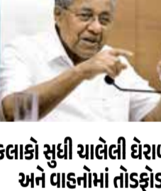
કલાકો સુધી ચાલેલી ઘેરાબંધી અને વાહનોમાં તોડફોડ કેન્દ્રીય એજન્સીના દરોડાના સમાચાર વાયુવેગે સમગ્ર વિસ્તારમાં ફેલાઈ જતાં જ મોટી સંખ્યામાં પક્ષના ઉચ્ચેચેલા સમર્થકો અને ડબેરી સંગઠનોના કાર્યકરો પૂર્વ મુખ્યમંત્રીના ઘરની બહાર એકઠા થઈ ગયા હતા અને વિરોધ પ્રદર્શનો શરૂ કર્યા હતા. બપોરે ૧:૩૦ વાગ્યેની આસપાસ જ્યારે તપાસ અધિકારીઓની ટીમ પોતાની કાર્યવાહી પૂર્ણ કરીને ઘરની બહાર નીકળી, ત્યારે ત્યાં હાજર હિંસક ભીડ તેમને ચારેય તરફથી ઘેરી લીધા હતા.

(એજન્સી) તિરુવનંતપુરમ । તા. 27 દક્ષિણ ભારતના કેરળ રાજ્યમાં કેન્દ્રીય તપાસ એજન્સીની કાર્યવાહીને પગલે કાયદો અને વ્યવસ્થાની સ્થિતિ અત્યંત ગંભીર અને ચિંતાજનક બની ગઈ છે. કેરળના પૂર્વ મુખ્યમંત્રી પિનરાઈ વિજયનના કથિત સમર્થકો અને પક્ષના કાર્યકરો દ્વારા એન્ફોર્સમેન્ટ ડિરેક્ટોરેટ એટલે કે ઇડીની તપાસ ટીમ પર હિંસક હુમલો કરવામાં આવ્યો હોવાની ચોકાવનારી ઘટના સામે આવી છે. નાણાકીય હેરાફેરી અને કાળા નાણાંના વ્યવહારોની તપાસના સંદર્ભમાં ઇડીની ૧૨ સભ્યોની એક વિશેષ ટીમ વહેલી સવારે ૭ વાગ્યે તિરુવનંતપુરમના પ્રખ્યાત બેકરી જંકશન સ્થિત પૂર્વ મુખ્યમંત્રીના સત્તાવાર નિવાસસ્થાન સહિત અન્ય ૧૦ મહત્વપૂર્ણ સ્થળોએ સામૂહિક દરોડા પાડવા માટે પહોંચી હતી. આ આકસ્મિક કાર્યવાહી દરમિયાન પૂર્વ મુખ્યમંત્રી અને તેમનો પરિવાર ઘરમાં જ હાજર હતો.