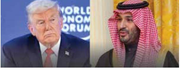
(એજન્સી) વોશિંગ્ટન 1 તા. 28

વૈશ્વિક સ્તરે સત્તાના સમીકરણો ઝડપથી બદલાઈ રહ્યા છે અને પશ્ચિમ એશિયાના રાજકારણમાં એક નવો વળાંક આવ્યો છે. ઈરાન સાથે ચાલી રહેલા લાંબા સમયના સંઘર્ષ વચ્ચે હવે પડદા પાછળ એક અણધાર્યો અને ગંભીર રાજદ્વારી વિવાદ ફાટી નીકળ્યો છે. આ વખતે આમનેસામને કોઈ દુશ્મન દેશો નથી, પરંતુ ઘાયલો જૂના પરમ મિત્ર ગણાતા દેશો વચ્ચે તણાવ પેદા થયો છે. વ્હાઈટ હાઉસના વડા દ્વારા તાજેતરમાં લેવાયેલા એકતરફી નિર્ણયો અને સોશિયલ મીડિયા પર જાહેર કરાયેલા કડક વલણને કારણે આરબ જગતના સૌથી શક્તિશાળી દેશ સાથેના સંબંધોમાં મોટી તિરાડ પડી ગઈ છે. આ આંતરરાષ્ટ્રીય કૂટનીતિની લડાઈ હવે ખુલ્લાઆમ સપાટી પર આવી ગઈ છે જેને કારણે સમગ્ર વિશ્વની નજર આ વિસ્તાર પર ટકેલી છે. વ્હાઈટ હાઉસ દ્વારા પાણી દેશો સમક્ષ એક એવી શરત મૂકવામાં આવી છે જેણે શાંતિના તમામ પ્રયાસો પર પાણી ફેરવી દીધું છે. અમેરિકા સાઉદી અરેબિયા વિવાદની શરૂઆત ત્યારે થઈ જ્યારે ઈરાન સાથેના સંભવિત શાંતિ કરારને પૂર્વ શરત તરીકે જોડવામાં આવ્યો. વોશિંગ્ટનનું કહેવું છે કે જો કોઈ મુસ્લિમ રાષ્ટ્ર ઈરાન સાથે વ્યાપારિક કે રાજદ્વારી સંબંધો સામાન્ય કરવા ઈચ્છતું હોય, તો તેણે ફરજિયાતપણે ઈઝરાયલ સાથેના જૂના કરાર પર હસ્તાક્ષર કરવા પડશે. ટ્રમ્પ નવી રણનીતિ ખેલ અંતર્ગત કતાર, પાકિસ્તાન અને રિયાધ સરકાર પર આડકતરી રીતે ભારે દબાણ લાવવામાં આવી રહ્યું છે, જેથી તેઓ ફિલિસ્ટીન મુદ્દાને બાજુ પર મૂકીને યહૂદી રાષ્ટ્ર સાથે ધ્યાન મિલાવી લે. આરબ નેતાનો સહાયણો અને સ્પષ્ટ જવાબ વોશિંગ્ટન તરફથી આવેલા આ આદેશાત્મક સંદેશોનો રિયાધ સરકારે અત્યંત આકરો અને ત્વરિત જવાબ આપ્યો છે. સાઉદી સત્તાવાળાઓએ સત્તાવાર નિવેદન બહાર પાડીને સ્પષ્ટ કર્યું છે કે જ્યાં સુધી ફિલિસ્ટીન નાગરિકો માટે એક સ્વતંત્ર અને સાર્વભૌમ રાષ્ટ્રના