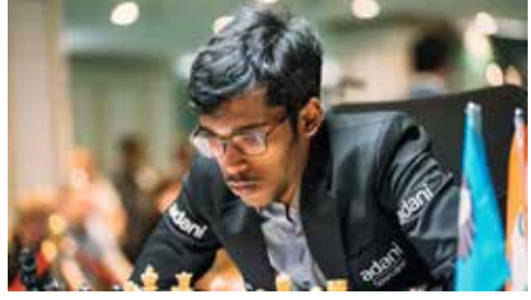
(એજન્સી) ઓસ્લો । તા. 28

● ક્લાસિકલ ફોર્મેટમાં બીજી જીત મેળવી રચ્યો નવો ઇતિહાસ