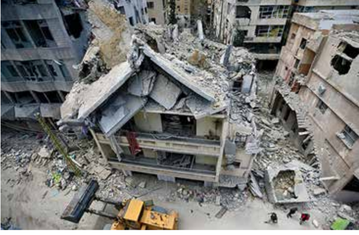
મીડિયા અહેવાલ અનુસાર, લશ્કરે ગંભીર આરોપ લગાવીને અત્યંત ઘાતક સામી છાવણી પર યુદ્ધવિરામ ભંગ કરવાનો બળપ્રયોગ શરૂ કર્યો છે. દક્ષિણના મુખ્ય

(એજન્સી)બેરૂત 1 તા. 28 પશ્ચિમ એશિયાના રણમેદાનમાં થોડા સમયની શાંતિ બાદ ફરી એકવાર લોહિયાળ સંઘર્ષ શરૂ થઈ ચૂક્યો છે. અગાઉ થયેલા યુદ્ધવિરામના તમામ કરારો હવામાં ઉડી ગયા છે અને સ્થિતિ સંપૂર્ણપણે નિયંત્રણ બહાર વહી ગઈ છે. ઇઝરાયલી સૈન્ય દ્વારા સત્તાવાર રીતે સરહદ વિસ્તારોમાં રહેતા નાગરિકોને તાત્કાલિક ધોરણે સુરક્ષિત સ્થળોએ ખસી જવા માટે અલ્ટીમેટમ આપી દેવામાં આવ્યું છે. સેનાએ લોકોને નદી ઓળંગીને ઉત્તર તરફ જવા જણાવ્યું છે, જેના કારણે લાખો પરિવારો પોતાના ઘરખાર છોડીને હિજરત કરવા મજબૂર બન્યા છે. આ આદેશ લેબેનોનના એક મોટા ભૌગોલિક ભાગને પ્રભાવિત કરી રહ્યો છે, જેથી ચોમેર આકંઠ જોવા મળી રહ્યું છે.