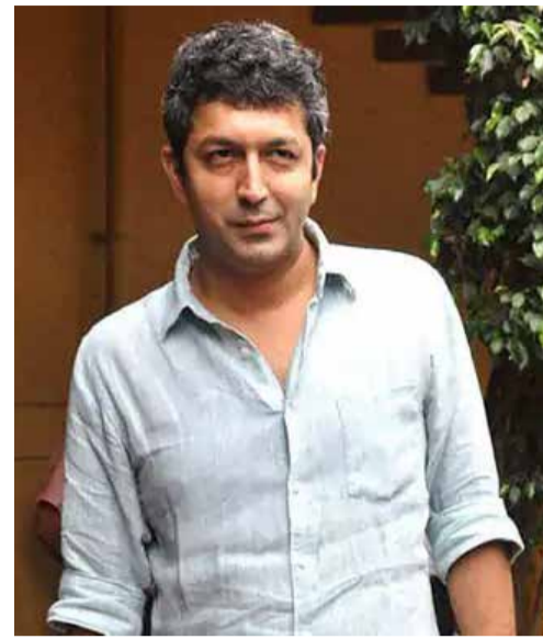
(અજન્સી) મુંબઈ | તા 28

ફ્લોપ ફિલ્મોથી સ્ટારડમ ઓછું નથી થતું, બોક્સ ઓફિસથી એક્ટરને જજ ન કરો: કુણાલના મતે, દુનિયાનો કોઈ પણ મોટો સ્ટાર ફ્લોપ ફિલ્મોથી બચી શકતો નથી