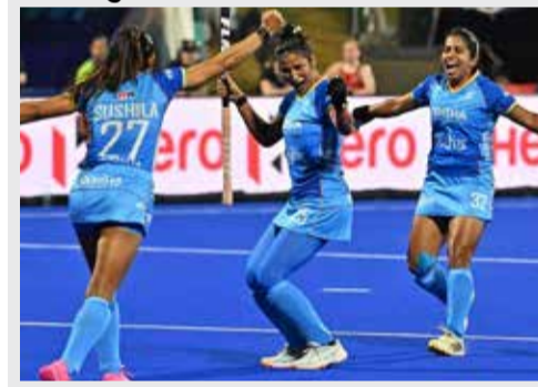
(એજન્સી) પર્થ । તા. 28

આંતરરાષ્ટ્રીય હોકીના મેદાન પર ભારતની દીકરીઓએ ફરી એકવાર પોતાનો દબદબો સાબિત કરવા માટે કમર કસી લીધી છે. ચાર મેચોની વર્તમાન શ્રેણીના રોમાંચક વળાંક વચ્ચે શુક્રવારે રમાનારા ત્રીજા મહત્વપૂર્ણ મુકાબલામાં ભારતીય ટીમ કંગાડુઓ સામે લીડ મેળવવાના ઈરાદા સાથે મેદાન પર ઉતરશે. પ્રથમ મેચમાં નજીવા અંતરથી હારનો સામનો કર્યા બાદ, ભારતીય ખેલાડીઓએ બીજા જ મુકાબલામાં અદભુત રમત બતાવીને જે રીતે વાપસી કરી છે, તેનાથી ટીમનો આત્મવિશ્વાસ અત્યારે બુલંદી પર છે. પર્થની આ ભવ્ય પિચ પર બંને ટીમો વચ્ચે કોટાની ટક્કર થવાની પૂરેપૂરી સંભાવના છે, કારણ કે બંને દેશો વૈશ્વિક રેન્કિંગમાં એકબીજાની ખૂબ જ નજીક છે.