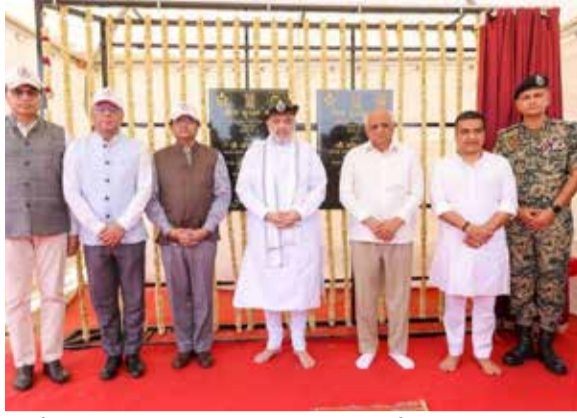
સમર્પણ અને દેશપ્રેમની પ્રશંસા કરતાં જણાવ્યું હતું કે દેશની સુરક્ષા માટે સીમા પર ફરજ બજાવતા જવાનોનું યોગદાન અમૂલ્ય છે.

જગદીશ પી દવે | દેશલપર (ગુંતલી) | ભુજ ખાતે માનનીય કેન્દ્રીય ગૃહ અને સહકાર મંત્રી અમિત શાહ દ્વારા બોર્ડર આઉટ પોસ્ટ G-7 અને G-13નું લોકાર્પણ કરવામાં આવ્યું હતું. આ પ્રસંગે તેમણે દેશની સરહદોની સુરક્ષા માટે દિવસ-રાત તેનાત રહેતા BSFના જવાનો સાથે સંવાદ કરી તેમની કામગીરીને બિરદાવી હતી. કાર્યક્રમમાં ગુજરાતના મુખ્યમંત્રી ભૂપેન્દ્ર પટેલ તેમજ નાયબ મુખ્યમંત્રી કર્મ સંઘવી વિશેષ ઉપસ્થિત રહ્યા હતા. સરહદી વિસ્તારોમાં સુરક્ષા વ્યવસ્થાને વધુ મજબૂત બનાવવા અને જવાનોનું મનોબળ વધારવા માટે આ કાર્યક્રમ મહત્વપૂર્ણ માનવામાં આવી રહ્યો છે. કેન્દ્રીય ગૃહમંત્રીએ જવાનોના