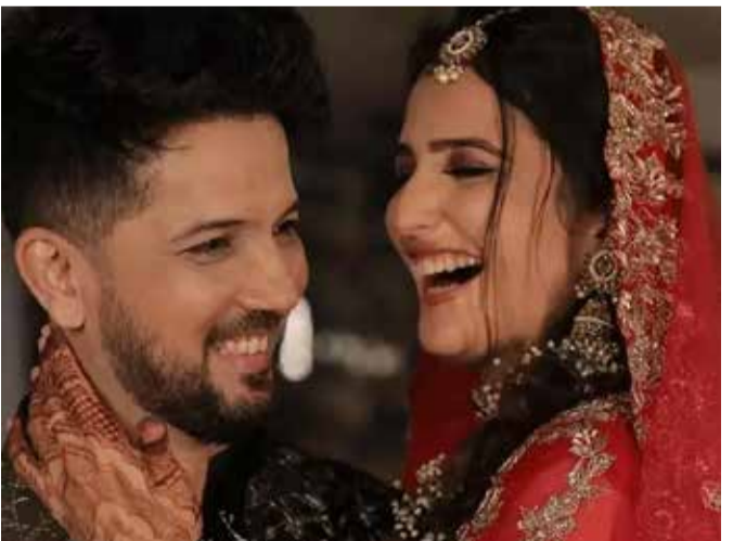
(એજન્સી) મુંબઈ | તા 29

કહ્યું- મને અવારનવાર કોમેન્ટ્સમાં જિહાદી કહેવામાં આવે છે