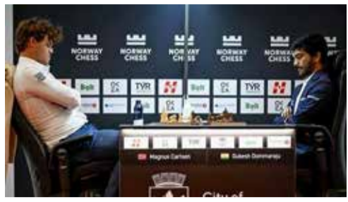
(એજન્સી) ઓસ્લો । તા. 29

નોવેના ઓસ્લોમાં રમાઈ રહેલી નોવે એસ ૨૦૨૬ ટુર્નામેન્ટના ચોથા રાઉન્ડમાં વિશ્વના નંબર વન ખેલાડી મેગ્નસ કાર્લસને વર્લ્ડ ચેમ્પિયન ડી. ગુકેશને પરાજય આપી ટુર્નામેન્ટમાં જોરદાર વાપસી કરી છે. ગુરુવારે રમાયેલા આ હાઈ-પ્રોફાઇલ મુકાબલામાં કાર્લસને ગુકેશની અંતિમ ક્ષણોની ભૂલોનો પૂરેપૂરો ફાયદો ઉઠાવી ત્રણ મહત્વના પોઈન્ટ મેળવ્યા હતા.