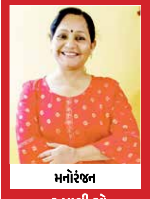
મનોરંજન - રુપાલી દવે

ધૂમ તાન નાન, નૈનો મે સપના, સપનો મે સજના, સજના પે દિલ આ ગયા... મનોરંજન નો અર્થ જ એ થાય છે કે જે હીરો ની અદાકારી પબ્લિક ના મન મગાજ માં ઉતરી ગઈ એની ફિલ્મો થિયેટર માં આવતા ભેગા લોકો ટિકિટ ના રૂપિયા ખર્ચા ને જોઈ નાપે છે. વર્તમાન સમયમાં ફિલ્મો થિયેટર માં આવ્યા પછી અમુક દિવસો કે માસ બાદ એટીટી દ્વારા એમેઝોન, નેટ ફ્લિક્સ વગેરે ટીવી પ્લેટ ફોર્મ માં પ્રસારિત થઈ જતી હોય છે. આ વાત લોકો જાણતા હોવા છતાંય ફેવરિટ હીરો ની ફિલ્મો થિયેટર માં જ જોવા જાય છે. અત્યાર નો સુપર હિટ હીરો રણવીર સિંહ છે એની ફિલ્મો જોતા લાગે છે કે રણવીર સિંહ ની ટક્કર નું કોઈ નથી. બેન્ડ બાજા બારાત થી લઈને પુરંધર વન અને ટુ માં એના અભિનય ની વાહ વાહી ખૂબ થઈ છે. ફિલ્મ પુરંધર એ થિયેટર માં આવતા ભેગા સફળતા ના બધા સીમાડા કોસ કરી નાખ્યા છે. આ ફિલ્મ જોયા બાદ લાગ્યું કે અમિતાભ બચ્ચન ની એકશન ફિલ્મ નો જમાનો રહી ગયો છે. કદાચ દર્શકો એ લાંબા દાયકાઓ બાદ પુરંધર જેવી એકશન પેક ફિલ્મ જોઈ એટલે જ પુરંધર એક ની માફક પુરંધર ટુ પણ દર્શકો ને થિયેટર સુધી આકર્ષવા માં સફળ રહી હતી. રણવીર સિંહ નો ડાયલોગ "ધાયલુ મ ઈસ્ટિયે થાતક હું..." ઈસ દુનિયા મેં હર કિસી કી કિસ્મત હોતી હે, વફાદાર કી થોડી જ્યાદા હોતી હે..." આદિત્ય ધર ની પુરંધર ફિલ્મ નું શાશ્વત સચદેવ એ કંપોઝ કરેલ ટાઈટલ ગીત જે રણવીર સિંહ પર ફિલ્માવેલ છે: લેડિઝ & જેન્ટલ મેન, યુ આર નોટ રેડી ફોર ધીસ, ના દે દિલ પરદેશી નું, તેનું નિત દરોણ પે જાઉંગા... આ સોંગ સાથે રણવીર સિંહ ની ફિલ્મ માં એન્ટ્રી થાય છે ત્યારે લાગે છે કે ફિલ્મ "મેં હું ડોન..." મેં હું ડોન..." જેવી એકશન પેક છે. રણવીર સિંહ સાથે શું કોન્ડોવર્સા થઈ છે એ વિશે ચર્ચા કરવાના બદલે એટલું નક્કી કરી શકાય કે