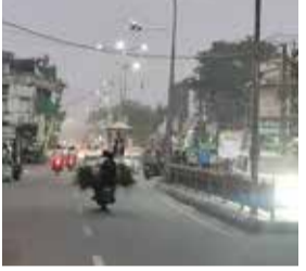
રાહદારીઓ માટે રસ્તા પર ચાલવું પણ મુશ્કેલ બન્યું હતું. શહેર તેમજ તાલુકાના વિવિધ વિસ્તારોમાં આ ઓંધીની અસર જોવા મળી હતી, જ્યાં ધુળના વાદળો છવાઈ ગયા હતા.

(એજન્સી) ખેડબ્રહ્મા | તા. 29 | ખેડબ્રહ્મા શહેર અને તાલુકામાં મોડી સાંજે વાતાવરણમાં અચાનક પલટો આવ્યો હતો. વાવાઝોડા સાથે ભારે પવન ફૂંકાતા ધુળની ગાઢ ડમરીઓ ઉડી હતી, જેના કારણે વાહનચાલકો અને રાહદારીઓને ભારે મુશ્કેલીનો સામનો કરવો પડ્યો હતો. સાંજના સમયે શરૂ થયેલા આ વાવાઝોડાને કારણે રોડ પર વિઝિબિલિટી ઓછી થઈ ગઈ હતી. વાહનચાલકોને વાહન ચલાવવામાં મુશ્કેલી પડી હતી, જ્યારે