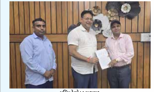
પશ્ચિમ રેલ્વે | અમદાવાદ પશ્ચિમ રેલ્વેના અમદાવાદ ડિવિઝનના ડેરેજ અને વેગન (સી એન્ડ બુલ્ડુ) વિભાગના કર્મચારીઓએ આજે તેમની તકનીકી કુશળતા, ડ્રૂદેશી અને ઉત્તમ સંકલનનું પ્રદર્શન કરીને એક મોટી કટોકટી ટાળી. રેલ્વે સ્ટાફની સત્કર્તાને કારણે, ટ્રેન નંબર 22950, હેઠરાદુન-બાંદ્રા ટર્મિનસ એક્સપ્રેસનો એક કોચ અલગ થવાથી બચી ગયો, જેનાથી ટ્રેનનું સરળ અને સલામત સંચાલન સુનિશ્ચિત થયું.

ટેકનિકલ સમસ્યા શું હતી? : ૨૯ મે, ૨૦૨૬ ના રોજ, ઉત્તર પશ્ચિમ રેલ્વેના અધિકારક્ષેત્રમાં મુસાફરી કરતી વખતે, ટ્રેન નં. ૨૨૯૫૦, દિલ્હી સરાઈ રોડિલ્લા-બાંદ્રા ટર્મિનસ એક્સપ્રેસના કોચ નં. એમ-૨ માં 'FIBA' (કેલ્ચર ઈન્ડિકેશન અને બ્રેક એપ્લીકેશન) ની સ્થિતિ ઉભી થઈ. આખુ રોડ સ્ટેશન પર સંપૂર્ણ નિરીક્ષણ દરમિયાન, ટેકનિકલ ટીમને જાણવા મળ્યું કે ડુલ્કેસ ચેક વાલ્વ કલિંગ થઈ હતો, જેના પરિણામે સતત હવા લીક થઈ રહી હતી. આ લીકેજને કારણે, લીડિંગ ટ્રોલી પરના બંને એર સિસ્ટમ્સ ડિસ્કનેક થઈ ગયા હતા. મુસાફરોની સલામતીને સૌથી ઉપર પ્રાથમિકતા આપતા, સી એન્ડ બુલ્ડુ સ્ટાફની દેખરેખ (એસ્કોર્ટ) હેઠળ, ટ્રેનને ૬૦ કિમી/કલાકની મર્યાદિત ગતિએ આગળ વધવાની મંજૂરી આપવામાં આવી હતી.