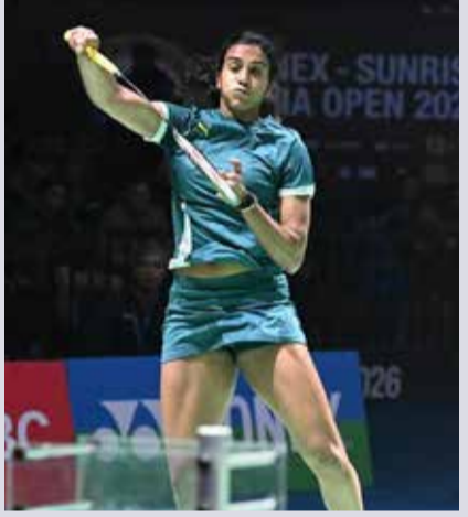
(એજન્સી)સિંગાપોર । તા. 29

ભારતની સ્ટાર બેડમિન્ટન ખેલાડી અને બે વખતની ઓલિમ્પિક મેડલ વિજેતા પીવી સિંધુનું સિંગાપોર ઓપન સુપર ૭૫૦ ટુર્નામેન્ટમાં અભિયાન ક્વાર્ટરફાઈનલ તબક્કે જ સમાપ્ત થયું છે. શુક્રવારે રમાયેલી રોમાંચક મેચમાં વિશ્વની નંબર વન ખેલાડી કોરિયાની એન્સિયોંગે સિંધુને ૨-૧-૦, ૨-૧-૧ થી હરાવીને સેમીફાઈનલમાં પ્રવેશ કર્યો હતો. આ હાર સાથે જ સિંધુનો ઓલિમ્પિક ચેમ્પિયન એન્સિયોંગ સામેનો વિજય વગરનો સિલસિલો નવ મેચ સુધી લંબાયો છે. ૪૮ મિનિટ સુધી ચાલેલા આ મુકાબલામાં સિંધુએ કેટલીક ક્ષણોમાં આક્રમક રમત બતાવી હતી, પરંતુ એન્સિયોંગનું ચોકસાઈપૂર્ણ નિયંત્રણ અને કોર્ટ પરની ચપલતા સામે તે ટકી શકી નહોતી. પ્રથમ ગેમમાં સિંધુએ વાપસી કરવાનો પ્રયાસ કર્યો હતો, પરંતુ અંતિમ ક્ષણોમાં કરેલી ભૂલોને કારણે તેણે ગેમ ગુમાવવી પડી હતી.