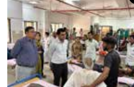
કીમેલ સર્જિકલ વોર્ડ, ટેબલ્ટ અને ઈન્જેક્શન ટ્રોલી, કીમેલ મેડિકલ વોર્ડ, એસ.એન.સી.યુ., ઓપરેશન વિભાગ, એ.આર. ટી. સેન્ટર, પાર્કિંગ એરિયા તેમજ પાણીની વ્યવસ્થા સહિતની સુવિધાઓનું નિરીક્ષણ કર્યું હતું. તેમણે સિવિલ હોસ્પિટલના તમામ સ્ટાફની કામગીરી અંગે