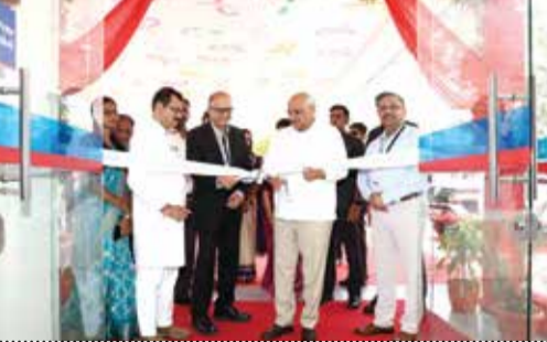
અમદાવાદની નારાયણા હોસ્પિટલમાં મુખ્યમંત્રી શ્રી ભૂપેન્દ્ર પટેલ દ્વારા અત્યાધુનિક 'હેલ્સિયન' ટેકનોલોજીથી સજ્જ રેડિયેશન ઓન્કોલોજી સેન્ટરનો પ્રારંભ કરવામાં આવ્યો છે. આ સુવિધાથી કેન્સરના દર્દીઓને એક જ સ્થળે સંપૂર્ણ સારવાર મળશે

(એજન્સી) અમદાવાદ | તા. 30 મુખ્યમંત્રી શ્રી ભૂપેન્દ્ર પટેલે નારાયણા હોસ્પિટલ, અમદાવાદના નવા રેડિયેશન ઓન્કોલોજી સેન્ટરનો પ્રારંભ કરાવ્યો હતો. કેન્સરની સારવારને વધુ સુલભ અને અસરકારક બનાવવાની દિશામાં નારાયણા હોસ્પિટલે એક મહત્વપૂર્ણ કદમ ભર્યું છે. મુખ્યમંત્રીશ્રીએ આ સેન્ટરની મુલાકાત લઈ ને હોસ્પિટલ દ્વારા અપાતી સેવાઓની માહિતી મેળવી હતી. આ કેન્દ્ર 'હેલ્સિયન' (Halcyon) રેડિયેશન થેરાપી સિસ્ટમથી સજ્જ છે અને આ સારવાર પદ્ધતિ ખાસ કરીને અદ્યતન ઝડપ અને ચોકસાઈ માટે જાણીતી છે. કેન્સરના ટ્યુમરની આસપાસના તંદુરસ્ત કોષો (ટિશ્યુઝ) પર થતી આડઅસરને