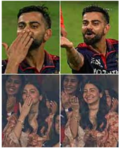
(એજન્સી) અમદાવાદ 1 તા. 01

અમદાવાદના નરેન્દ્ર મોદી સ્ટેડિયમમાં રમાયેલી ઈન્ડિયન પ્રીમિયર લીગ (IPL) ૨૦૨૬ની ફાઈનલ મેચમાં રોયલ ચેલેન્જર્સ બેંગ્લુરુ (RCB) એ ઈતિહાસ રચ્યો છે. રોમાંચક મુકાબલામાં ગુજરાત ટાઈટન્સને ૫ વિકેટ હરાવીને બેંગ્લુરુની ટીમે વર્ષ ૨૦૨૫ બાદ સતત બીજા વર્ષે પણ આઈપીએલ ટાઈટલ પોતાના નામે કર્યું છે. આ ઐતિહાસિક જીતનો શ્રેય ટીમના સુપરસ્ટાર બેટ્સમેન વિરાટ કોહલીને જાય છે, જેમણે અંતિમ શ્લોકોમાં શાનદાર પ્રદર્શન કર્યું હતું.