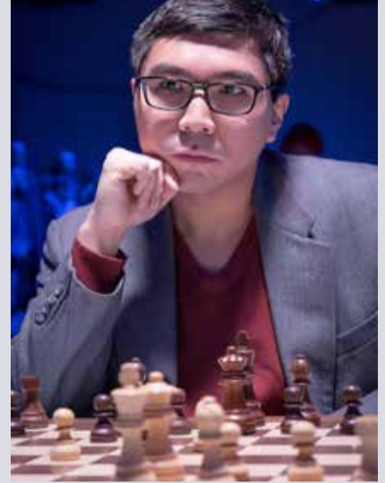
(એજન્સી) ઓસ્લો 1 તા. 01

નોર્વેના ઓસ્લો શહેરમાં ચાલી રહેલી પ્રતિષ્ઠિત ‘નોર્વે ચેસ’ ટૂર્નામેન્ટમાં છઠ્ઠા રાઉન્ડ બાદ મુકાબલો અત્યંત રસપ્રદ વળાંક પર પહોંચ્યો છે. વિશ્વના નંબર ૧ ખેલાડી મેગ્નેસ કાર્લસને ટૂર્નામેન્ટના લીડર અલીરેઝા ફિરોજાને હરાવીને જીતનો સિલસિલો જાળવી રાખ્યો છે. આ કાર્લસનની વ્યૂહાત્મક માસ્ટરીનું પરિણામ હતું, જેણે ફિરોજાને ટૂર્નામેન્ટમાં પ્રથમ વખત ક્લાસિકલ હારનો સ્વાદ ચખાડ્યો છે.