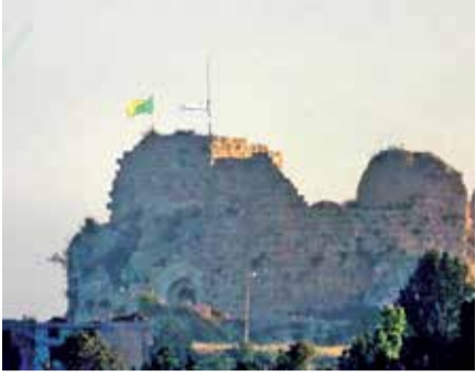
હિઝબુલ્લાહ સામે વધતા જતા ઓપરેશન હિઝબુલ્લાહના ઠેકાણાઓને નિશાન બનાવીને ઈઝરાયેલી સેનાએ પોતાના હુમલાઓની તીવ્રતા વધારી દીધી છે. સૂત્રો દ્વારા પ્રાપ્ત માહિતી મુજબ, ઈઝરાયેલી સૈનિકો એક પછી એક વિસ્તારો પર કબજો કરી રહ્યા છે, જે હિઝબુલ્લાહ માટે મોટો આંચકો છે. આ પહાડી

ઈઝરાયેલ ડિફેન્સ ફોર્સિસે (આઈડીએફ) લેબનોનના સ્થાનિક નાગરિકો માટે એક ગંભીર ચેતવણી જાહેર કરી છે. સૈન્યના પ્રવક્તાએ જણાવ્યું હતું કે, ઝહરાની નદી કે તેની આસપાસના વિસ્તારોમાં રહેતા લોકોએ તાત્કાલિક તે વિસ્તાર ખાલી કરી દેવો જોઈએ. આ ઉપરાંત, હિઝબુલ્લાહના સંભવિત ઠેકાણાઓ કે તેની આસપાસના વિસ્તારોમાંથી પણ સામાન્ય નાગરિકોને દૂર રહેવાની સૂચના આપવામાં આવી છે. ઈઝરાયેલનો હેતુ સ્પષ્ટ છે કે હિઝબુલ્લાહના નેટવર્કને તોડી પાડવા માટે સેના કોઈપણ હદ સુધી જઈ શકે છે.