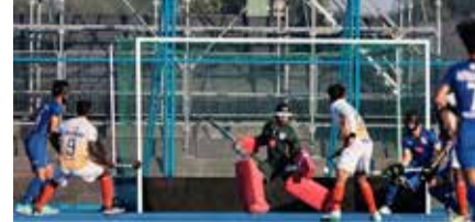
(એજન્સી) કાકામિગાહારા 1 તા. 01

જાપાનના કાકામિગાહારા ખાતે રમાઈ રહેલા ડોકી U-18 એશિયા કપ ૨૦૨૬માં ભારતીય અંડર-૧૮ પુરુષ ડોકી ટીમને યજમાન જાપાન સામે ૨-૪ ના સ્કોરથી પરાજયનો સામનો કરવો પડ્યો છે. પૂલ-એ ની આ રોમાંચક મેચમાં બંને ટીમો વચ્ચે જોરદાર ટક્કર જોવા મળી હતી, પરંતુ અંતે જાપાની ખેલાડીઓએ રમત પર પોતાની પકડ મજબૂત બનાવી રાખતા વિજય મેળવ્યો હતો.