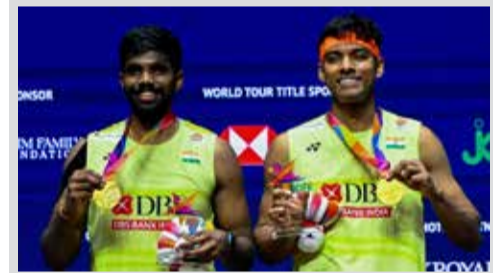
એ વર્ષ બાદ સાત્વિક-ચિરાગ ચેમ્પિયન

આસીબી માટે આ જીત અત્યંત મહત્વની છે. વર્ષ ૨૦૨૫માં પહેલીવાર આઈપીએલ ટ્રોફી જીત્યા બાદ, ૨૦૨૬માં પણ પોતાના પ્રભુત્વને જાળવી રાખીને ટીમે ફરી એકવાર સાબિત કર્યું છે કે તેઓ વર્તમાન ક્રિકેટ જગતની સૌથી મજબૂત ટીમોમાંની એક છે. ગુજરાત ટાઈટન્સ સામેની આ ફાઈનલ મેચમાં બેંગ્લુરુના બોલરો અને બેટ્સમેનોએ અસાધારણ સમન્વય દર્શાવ્યો હતો. વિરાટ કોહલીનું નેતૃત્વ અને તેની બેટિંગ કોર્મ આ સમગ્ર ટૂર્નામેન્ટ દરમિયાન ચર્ચાનો વિષય રહી છે.