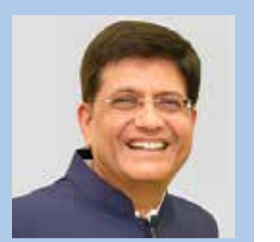
લોકેશ - શ્રી પ્રદ્યુમ્ન ગોયલ (હિન્દીય ગણિત્ય અને ઉદ્યોગ મંત્રી)

પાણીપત, કોઈમટુર, કરુર, ભદોલી, મુરાદાબાદ, જયપુર અને અમદાવાદ જેવા મુખ્ય ક્લસ્ટરોમાં રોજગારની તકો ઊભી થશે. ભારતના કારીગરો અને વણકરોને પણ તેમના ઉત્પાદનોની આંતરરાષ્ટ્રીય માર્ગમાં વધારો થવાનો ફાયદો થશે. સમગ્ર ભારતમાં ખાસ કરીને