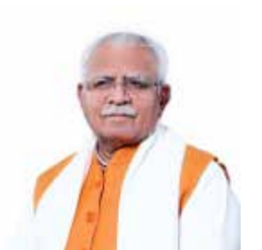
શ્રી મનોહર લાલ આગળ વધે છે. 'સ્વનિધિ સમૃદ્ધિ' પહેલ દ્વારા, લાખો વિકેતાઓ અને તેમના પરિવારો ભારત સરકારની ઓઈ મુખ્ય હવાબહારી યોજનાઓ સાથે જોડાયેલા છે. આજ સુધીમાં, ૫૦ લાખથી વધુ શેરી વિકેતા પરિવારોની પ્રોત્સાહન બનાવવામાં આવી છે અને આજે લાખો મજૂર કરવામાં આવ્યા છે. પેન્શન, વીમો, આરોગ્ય સંભાળ અને સામાજિક સુરક્ષા જેવા લાભોની એક્સેસ પ્રદાન કરીને, આ પહેલે શેરી વિકેતાઓ અને તેમના પરિવારો માટે એક વ્યાપક સામાજિક સુરક્ષા પ્રણાલી બનાવી છે. વધુમાં, FSSAIના સહયોગથી ખાદ્ય ગણવામાં આવેલા અને સ્વચ્છતા તાલીમ પણ આપવામાં આવી છે, જેનાથી ખાસ કરીને સ્ટ્રીટ ફૂડ વિકેતાઓમાં ગુણવત્તા, સ્વચ્છતા અને ગ્રાહક વિશ્વાસ વધ્યો છે. આ યોજનાએ

નથી, પરંતુ આદર, માન્યતા અને નવી તકો માટે એક શક્તિશાળી માધ્યમ પણ બની ગયું છે. આ યોજનાની સફળતાનો મુખ્ય આધાર 'સમગ્ર સરકારી અભિગમ' હતો, જેમાં કેન્દ્ર, રાજ્ય, શહેરી સ્થાનિક સંસ્થાઓ અને બેંકિંગ સંસ્થાઓના સંકલિત પ્રયાસોએ તેને સમગ્ર દેશમાં અમૂતપૂર્વ સ્તરે પહોંચાડી અને નોંધપાત્ર પરિણામો પ્રાપ્ત કર્યાં. આ યોજના હેઠળ, લાખો વિકેતાઓના બેંક ખાતા સક્રિય કરવામાં આવ્યા તેમના નાણાકીય વ્યવહારો રેકોર્ડ કરવામાં આવ્યા, અને પ્રથમ વખત તેમણે ઓપચારિક ક્રેડિટ ઇતિહાસ સ્થાપિત કર્યો. આનાથી ભવિષ્યમાં વધુ લોન અને નાણાકીય સેવાઓ મેળવવામાં તેમની સુવિધા મળી, અને તેઓ આજે મૂલ્યવાન બેંક ગ્રાહકો અને ઉદ્યોગસાહસિક તરીકે ઓળખાયા છે. આ યોજનાનું બીજું મહત્વનું પાસું ડિજિટલ સશક્તિકરણ છે. UPI અને QR-કોડ આધારિત યુક્તવર્ણીઓને પ્રોત્સાહન આપવા માટે કેશલેસ પ્રોત્સાહનો લાગુ કરવામાં આવ્યા છે. આ પહેલે અત્યાર સુધીમાં ૫૬ લાખ વિકેતાઓને ડિજિટલ અર્થતંત્ર સાથે જોડ્યા છે, જેનાથી તેમના વ્યવહારો પારદર્શક બન્યા છે અને તેમની નાણાકીય વિશ્વસનીયતા મજબૂત બની છે. આ યોજનાનું વિઝન ફક્ત વ્ય સાયથી