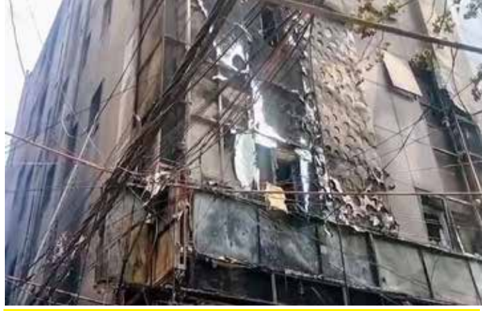
'ફ્લોરિશ સ્ટે' હોટલમાં લાગેલી આગે લીધો ૨૧નો ભોગ