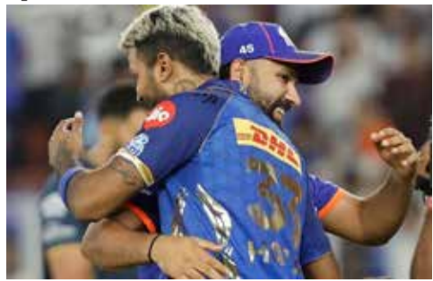
(એજન્સી) નવી દિલ્હી 1 તા. 03

હાર્દિક અને રોહિત પર BCCIનું દબાણ, ફિટનેસ સાબિત કર્યા બાદ જ રમશે