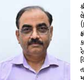
જાળવણી અને પ્રોજેક્ટ મેનેજમેન્ટમાં ત્રણ દાયકાથી વધુનો સમૃદ્ધ અને વૈવિધ્યસભર અનુભવ ધરાવે છે. તેમની પ્રતિષ્ઠિત કારકિર્દી દરમિયાન,