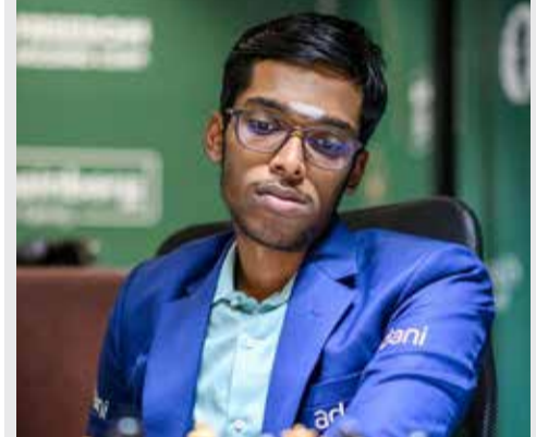
ઓસ્લો । તા. ૦૬

ભારતીય ગ્રાન્ડમાસ્ટર આર. પ્રજ્ઞાનંદે રમત જગતમાં ફરી એકવાર ભારતનું નામ રોશન કર્યું છે. શુક્રવારે રાત્રે ઓસ્લો ખાતે સંપન્ન થયેલી નોર્વે ચેસ ૨૦૨૬માં પ્રજ્ઞાનંદે વિજયી ડકો વગાડતા પ્રથમ ભારતીય તરીકે આ પ્રતિષ્ઠિત ખિતાબ પોતાના નામે કર્યો છે. જર્મનીના વિન્સન્ટ ક્રીમરને અંતિમ રાઉન્ડમાં હરાવીને પ્રજ્ઞાનંદે આ ઐતિહાસિક સિદ્ધિ હાંસલ કરી છે.