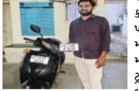
આઈટીએમએસ સિસ્ટમમાં તપાસ કરતા આ નંબર એક્ટીવા નહીં પરંતુ રોયલ એનફિલ્ડ હન્ડર-૩૫૦ મોટરસાયકલનો હોવાનું જાણવા મળ્યું હતું.માહિતીના આધારે ટ્રાફિક પોલીસે વોચ ગોઠવી હતી. દરમિયાન અંબર ચોકડી રોડ પર

જામનગર. જામનગર શહેરની ટ્રાફિક શાખાની સત્તર્ક કામગીરી દરમિયાન એક્ટીવા સ્કૂટર પર ખોટી નંબર પ્લેટ લગાવી ફરતા એક યુવકને ઝડપી પાડવામાં આવ્યો છે. આરોપીએ પોતાના વાહનનો મૂળ રજિસ્ટ્રેશન નંબર છુપાવી અન્ય વાહનનો નંબર ઉપયોગમાં લઈ કાયદાનો ભંગ કર્યો હોવાનું સામે આવ્યું છે. ટ્રાફિક શાખાના પોલીસ હેડ કોન્સ્ટેબલને કમાન્ડ એન્ડ કંટ્રોલ સેન્ટર તરફથી માહિતી મળી હતી કે અંબર ચોકડી વિસ્તારથી જી. જી. હોસ્પિટલ તરફ જતું એક હોન્ડા એક્ટીવા સ્કૂટર નંબર જીજે-૧૦-ઈકે-૧૧૧૧ સાથે જોવા મળ્યું હતું.