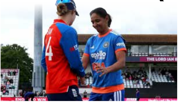
(એજન્સી) ચેન્નાઈ । તા. ૦૬

મહિલા T20 વર્લ્ડ કપ 2026ના ધમધમાટ માટેનું કાઉન્ટડાઉન શરૂ થઈ ગયું છે. ટૂર્નામેન્ટના મુખ્ય મુકાબલાઓ ૧૨ જૂનથી શરૂ થવાના છે, પરંતુ તે પહેલાં તમામ ટીમો માટે પોતાની રજાનીતિને ધાર આપવા માટે વોર્મ-અપ મેચોનું આયોજન કરવામાં આવ્યું છે. ભારતીય મહિલા ક્રિકેટ ટીમ માટે આ વોર્મ-અપ મેચો અત્યંત મહત્વની સાબિત થશે, કારણ કે ટીમ પોતાની પ્લેઈંગ ઈલેવનને અંતિમ સ્વરૂપ આપવા અને ખેલાડીઓના ફોર્મને તપાસવા માટે આ તકનો ઉપયોગ કરશે.