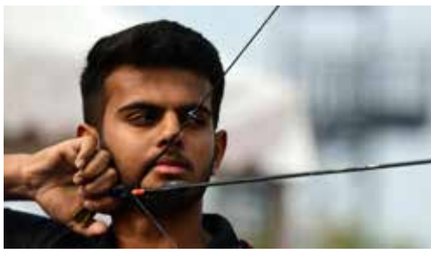
(એજન્સી) ચેન્નાઈ । તા. ૦૬

એશિયન ગોલ્ડ સુવર્ણ વિજેતાનું કરિયર અઘવચ્ચે અટક્યું