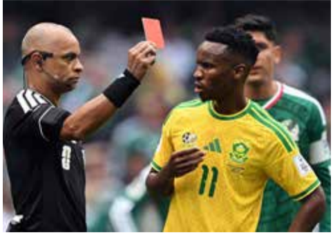
(એજન્સી) મેક્સિકો સિટી । તા. 12

ફિફા વર્લ્ડ કપ 2026નો પ્રારંભ અપેક્ષા કરતા પણ વધુ આક્રમક અને વિવાદાસ્પદ રહ્યો છે. સહ-યજમાન મેક્સિકો અને દક્ષિણ આફ્રિકા વચ્ચે રમાયેલી ઓપનિંગ મેચ ફૂટબોલ ઇતિહાસના યોગ્ય એક અનોખા રેકોર્ડ સાથે નોંધાઈ છે. આ મેચમાં કુલ 2 ગોલ થયા હતા, પરંતુ રેફરીએ શિસ્તભંગ બદલ 2 ખેલાડીઓને મેદાનની બહારનો રસ્તો બતાવતા 3 રેડ કાર્ડ આપ્યા હતા. ફૂટબોલના મહાકુંભમાં ઓપનિંગ મેચમાં ગોલ કરતાં વધુ રેડ કાર્ડ જોવા મળ્યા હોય તેવી આ પ્રથમ ઘટના છે.