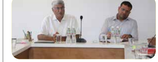
(એજન્સી) એકતા નગર (નર્મદા) । તા. 18

સ્ટેચ્યુ ઓફ યુનિટી અને નર્મદા નિગમની કામગીરીને વધુ સુદૃઢ બનાવવા અને પ્રવાસીઓને શ્રેષ્ઠ સુવિધાઓ પૂરી પાડવાના ઉદ્દેશ્યથી એકતા નગર વહીવટી કાર્યાલય ખાતે એક ઉચ્ચસ્તરીય સમીક્ષા બેઠક યોજાઈ હતી. નર્મદા નિગમ અને સ્ટેચ્યુ ઓફ યુનિટીના ચેરમેન શ્રી મુકેશ પૂરીની અધ્યક્ષતામાં આ બેઠક યોજાઈ હતી, જેમાં વિકાસકાર્યો અને પ્રવાસનને લગતા વિવિધ મુદ્દાઓ પર ગહન ચર્ચા કરવામાં આવી હતી. બેઠક દરમિયાન એકતા નગર વિસ્તારમાં ચાલી રહેલા વિવિધ વિકાસ કાર્યો, પ્રવાસીલક્ષી સુવિધાઓ અને આગામી ચોમાસાને ધ્યાનમાં રાખીને પ્રિ-મોન્સૂન એક્ટિવિટીની કામગીરીની ઝીણવટભરી સમીક્ષા કરવામાં આવી હતી. આ ઉપરાંત, પ્રવાસીઓ તરફથી મળતા અભિપ્રાયો અને સૂચનોને આધારે કઈ રીતે સુધારા કરી શકાય, તથા પ્રવાસન પ્રકલ્પોના મરામત અને નિભાવણી અંગેની કામગીરી અંગે અધિકારીઓ સાથે વિસ્તૃત ચર્ચા કરવામાં આવી હતી. ચેરમેન શ્રી મુકેશ પૂરીએ ઉપસ્થિત તમામ અધિકારીઓ પાસેથી વિવિધ પ્રકલ્પોની માહિતી મેળવી હતી અને જરૂરી માર્ગદર્શન તથા સૂચનો આપ્યા હતા. તેમણે ખાસ ભાર મૂક્યો હતો કે પ્રવાસીઓને કોઈ પણ અગવડતા ન પડે અને તેમને યોગ્ય સુવિધાઓની ઉપલબ્ધિ સુનિશ્ચિત કરવી એ આપણી પ્રાથમિકતા છે.