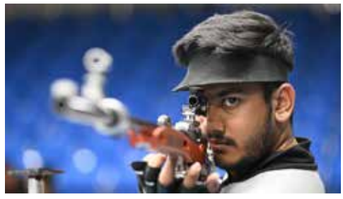
(એજન્સી) નવી દિલ્હી | તા. ૧૮

એશિયન ગેમ્સ ૨૦૨૬ માં મેડલની આશા, રાઈફલ શૂટિંગમાં ભારતનું મજબૂત નામ