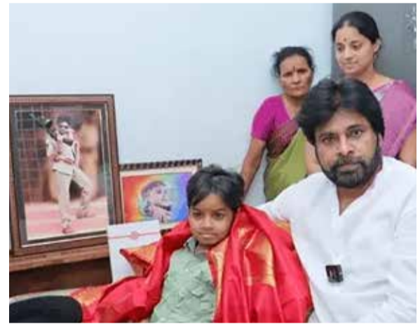
(એજન્સી) મુંબઈ | તા 18

સારવાર માટે 1 લાખ રૂપિયા પણ આપ્યા; માનહાનિના કેસમાં કોર્ટે પક્ષમાં આદેશ આપ્યો