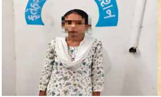
(એજન્સી) વડોદરા । તા. 26

વડોદરાના ફતેગંજ વિસ્તારમાં આવેલી મહાલક્ષ્મી જ્વેલર્સમાંથી સોનાના દાગીનાની ચોરી કરનાર મહિલાને પોલીસે ગણતરીના કલાકોમાં ઝડપી પાડી હતી. ફતેગંજ પોલીસે CCTV ફૂટેજ અને બાતમીના આધારે કાર્યવાહી કરી આરોપી પાસેથી 62 હજાર રૂપિયાની કિંમતના સોનાના દાગીના કબજે કર્યાં છે.