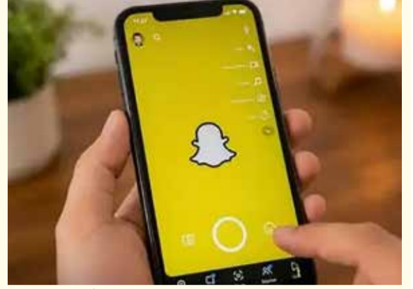
મેટા (ફેસબુક અને ઈન્સ્ટાગ્રામ), યુટ્યુબ (ગૂગલ) અને સ્નેપચેટ (સ્નેપ) સહિતના અનેક મુખ્ય સોશિયલ મીડિયા પ્લેટફોર્મ ગંભીર મુકદ્દમાનો સામનો કરી રહ્યા છે. અમેરિકાના કેલિફોર્નિયા રાજ્યની અદાલતોમાં સોશિયલ મીડિયા કંપનીઓ વિરુદ્ધ વ્યસન સંબંધિત દાવાઓવાળા 3,300થી વધુ મુકદ્દમા પેન્ડિંગ છે.