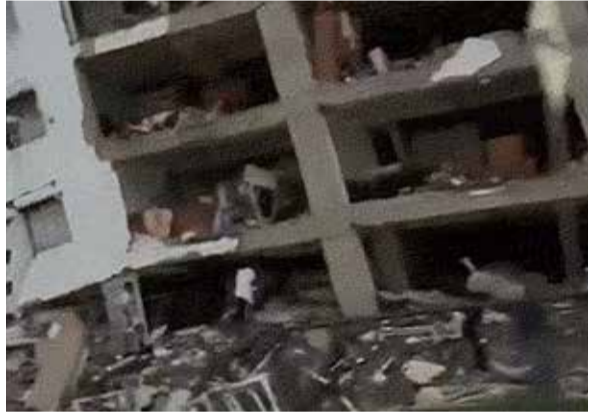
રાષ્ટ્રીય રજા હતી. 1821માં સ્પેન વિરુદ્ધ આઝાદીની લડાઈની ઐતિહાસિક જીતની વર્ષગાંઠ પર શાળાઓ અને ઓફિસો બંધ હતી.

આ ભૂકંપ એવા દિવસે આવ્યા, જ્યારે આખા દેશમાં