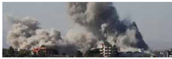
કોણ જવાબદાર હતું. ટ્રમ્પે કહ્યું, 'કોઈએ કહ્યું કે આ અમારી મિસાઈલ હતી, પરંતુ કદાચ તે અમારી

અમેરિકી રાષ્ટ્રપતિ ડોનાલ્ડ ટ્રમ્પે ઈરાનની મિનાબ ગર્લ્સ સ્કૂલ પર થયેલા હુમલામાં અમેરિકી મિસાઈલના ઉપયોગનો ઈનકાર કર્યો છે. તેમણે કહ્યું કે તે સમયે ચારેય બાજુ મિસાઈલો છોડવામાં આવી રહી હતી, તેથી કદાચ ક્યારેય એ જાણી શકાશે નહીં કે હુમલા માટે