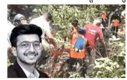
(એજન્સી) પુણે । તા. 27

રેસક્યુ કરનારાએ કહ્યું- લોકો રડતા હતા, સિયા શાંત હતી; માતા-પિતાની પૂછપરછ ચાલુ