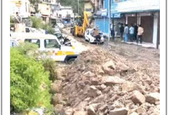
(એજન્સી) નવી દિલ્હી । તા. 27

દેશમાં ચોમાસાના આગમન સાથે જ કુદરતી આફતોનો સિલસિલો શરૂ થયો છે. ઉત્તરાખંડના ચમોલી જિલ્લામાં શુક્રવારે વાદળ ફાટવાની ગંભીર ઘટના બની હતી, જેના કારણે ભારે વિનાશ સર્જાયો છે. આ તરફ મધ્યપ્રદેશ, ઝારખંડ અને છત્તીસગઢમાં વીજળી પડવા અને વાવાઝોડાને કારણે કુલ ૧૬ લોકોના કુટુંબ મોત નિપજ્યા છે.