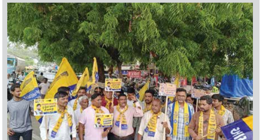
ધારાસભ્ય ચૈતરભાઈ વસાવાના સમર્થનમાં આણંદ ખાતે યોજાયેલી પદયાત્રામાં કાર્યકરો ઉમટી પડ્યાં