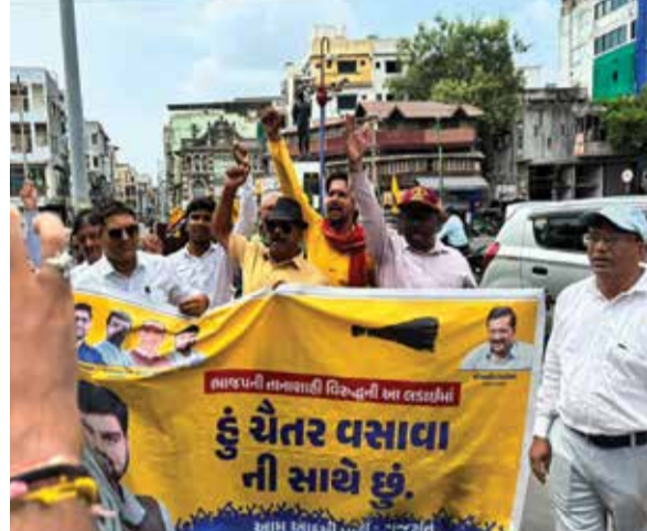
ચૈતર વસાવાના સમર્થનમાં વડોદરા ખાતે પદયાત્રામાં યોજાઈ