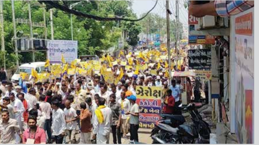
ધારાસભ્ય ચૈતરભાઈ વસાવાના સમર્થનમાં દાહોદ ખાતે યોજાયેલી વિશાળ પદયાત્રામાં 1500 થી વધુ માનવ મહેરામણ જોડાયાં

બાબને ખેડૂતો છેલ્લા ઘણા દિવસોથી વિરોધ કરી રહ્યા છે, છતાં બાજબીના ધારાસભ્યો કે સાંસદો અહીં સુધી પહોંચ્યા નથી. આજે મોટી સંખ્યામાં ખેડૂતો અને મહિલાઓ-માતા, બહેનો, ટીકરીઓ પરેશાન થઈને બેઠી છે. મને લાગે છે કે બાજબી સરકાર પાકવીનો નથી આપતી, પાકના પૂરતા ભાવ નથી આપતી અને બધી બાબતોમાં લાઈનો લગાડે છે. હવે હવે વટાવીને જે જમીન પર ખેડૂત પરસેવો પાડીને બેઠો છે. તે કેન્દ્રીય જમીન પર પણ જેઓની (JCB) ચલાવીને કબજો કરવા મથી રહી છે. આ અન્યાયના વિરોધમાં આજે આમ આદમી પાર્ટીએ ખેડૂતોને સંપૂર્ણ ટેકો આપ્યો છે. ઈસુદાન ગઢવીએ સરકારને ચેતવણી આપતા જણાવ્યું કે, ખેડૂતો પર અન્યાયકર બંધ નહીં થાય અને આ બાબતે કાયદાકીય ન્યાય નહીં મળે, તો આવનારા સમયમાં આમ આદમી પાર્ટી ખેડૂતોના હક માટે ઉગ્ર આંદોલન કરશે, જેની ખુબી આપી આપી છે.