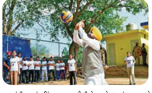
મુખ્યમંત્રી ભગવંત સિંહ માનના દૂરદેશી નેતૃત્વ હેઠળ, પંજાબ સરકારે "ખેલ-દા પંજાબ, બદલવા પંજાબ" ના ભેગ હેઠળ રમતગમતમાં ક્રાંતિની શરૂઆત કરી છે, જેના પડઘા દૂર દૂર સુધી ફેલાઈ રહ્યા છે.

₹100 કરોડના ખર્ચે કેપ્ટન અમોલ કાલિયા સેન્ટર ઓફ એક્સલેન્સની સ્થાપના કરવામાં આવી રહી છે. આ સંસ્થા અદ્યતન કૌશલ્ય વિકાસ અને ઉદ્યોગ-લક્ષી તાલીમ માટે એક કેન્દ્ર તરીકે સેવા આપશે, જે ભવિષ્યની નોકરીઓ માટે યુવાનોને તૈયાર કરવામાં મદદ કરશે.