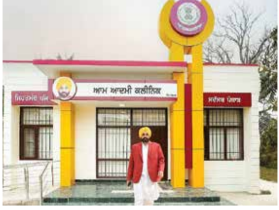
આ ક્લિનિક્સમાં 90૭ પ્રકારની દવાઓ મફતમાં પૂરી પાડવામાં આવે છે

990 આમ આદમી ક્લિનિક્સ 83000 દર્દીઓની દરરોજ સારવાર 5.62 કરોડ દર્દીઓની સારવાર થઈ દમણમાં સુધી