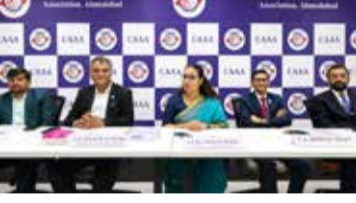
મેળોના મનપસંદ પ્રેક્ટિસ ફર્મો (ઓડિટ, ટેક્સેશન, GST, ઇન્ટરનલ ઓડિટ) અને બોગોલિકલ પસંદગીઓ નોંધી શકે છે, જ્યારે CA ફર્મ્સ તેમના પોતાના સિલેક્શન ક્રિટરિયા સાથે રજીસ્ટ્રેશન કરે છે. એક સ્માર્ટ ડેશબોર્ડ અસરકારક શોર્ટલિસ્ટિંગ માટે બંને પક્ષોને જોડે છે, જે મેળામાં ઓન-ધ-સ્પોટ ઇન્ટરવ્યુ સાથે પૂર્ણ થાય છે. CA

: આર્ટિકલશિપ મેળો એ એક સુવ્યવસ્થિત, ઓફલાઈન પ્લેસમેન્ટ પ્લેટફોર્મ છે જે પ્રથમ વર્ષના CA વિદ્યાર્થીઓ અને આર્ટિકલની શોધમાં રહેલી CA ફર્મને એક જગત સાથે લાવે છે. આ એક સામાન્ય જોબ ફેર કરતાં ઘણું વધારે છે - અહીં એક સ્માર્ટ મેચમેકિંગ (યોગ્ય પસંદગી) પ્રક્રિયા અપનાવવામાં આવી છે, જેમાં વિદ્યાર્થીઓ