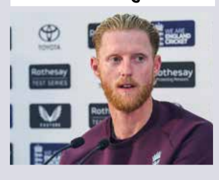
(એજન્સી) લંડન | તા. 30

ઈંગ્લેન્ડના સ્ટાર ઓલરાઉન્ડર બેન સ્ટોક્સે ૨૮ જૂને આંતરરાષ્ટ્રીય ક્રિકેટમાંથી સન્યાસ લેવાની જાહેરાત કરીને સમગ્ર રમતજગતને ચોંકાવી દીધું છે. ઈંગ્લેન્ડ અને ન્યૂઝીલેન્ડ વચ્ચે રમાઈ રહેલી ટ્રેન્ટ બ્રિજ ટેસ્ટ દરમિયાન સ્ટોક્સે આ આશ્ચર્યજનક નિર્ણય જાહેર કર્યો હતો. ૩૫ વર્ષીય સ્ટોક્સે જણાવ્યું છે કે, આ તેમનો સંપૂર્ણપણે વ્યક્તિગત નિર્ણય છે અને કોઈ પણ બાહ્ય દબાણ હેઠળ લેવામાં આવ્યો નથી.