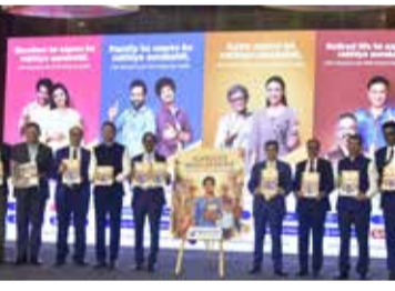
સંકલ્પનાઓને સરળ રીતે સમજાવવામાં આવી છે. આ અંગેની સંકલ્પનાઓને ટેકનિકલ સમજણના બદલે સંબંધિત અને જીવનસંગત વાર્તા રજૂઆત દ્વારા સમજાવવામાં આવી છે. કોમ્પિક્ષને માધ્યમ તરીકે ઉપયોગ કરવાનો વિચાર

ગણાવે છે. આ કારણે આ શ્રેણીમાં MWFP (મિરિડ વુમ્સ પ્રોપ્રી એક્ટ), વેઈવર અને બોગોલિકલ વિસ્તારોમાં વધુ અસરકારક રીતે જોડાણ સ્થાપિત કરે છે. વાર્તા આધારિત શીખણ તરફના પરિવર્તનને દર્શાવે છે, જે વિવિધ વયગ્રુપ અને બોગોલિકલ વિસ્તારોમાં વધુ અસરકારક રીતે જોડાણ સ્થાપિત કરે છે.