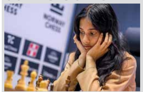
(એજન્સી) અમદાવાદ | તા. 30

આ ગંભીર મામલાને લઈને ફિફાએ પણ પોતાની પ્રતિક્રિયા આપી છે. ફિફાના પ્રવક્તાએ જણાવ્યું છે કે, તેઓ કોઈપણ પ્રકારના ગેરવર્તણૂકના આરોપોને અત્યંત ગંભીરતાથી લે છે અને હાલમાં ન્યૂઝીલેન્ડના સંબંધિત સત્તાધિકારીઓના સંપર્કમાં છે. તપાસ હજુ ચાલુ હોવાથી ફિફાએ વધુ ટિપ્પણી કરવાનો ઈન્કાર કર્યો છે. બીજી તરફ, ન્યૂઝીલેન્ડ પોલીસ હાલમાં આ મામલાની તપાસ કરી રહી છે. નોંધનીય છે કે, હજુ સુધી મેન્ડિસ સામે કોઈ સત્તાવાર ગુનાહિત આરોપ નક્કી કરવામાં આવ્યો નથી.