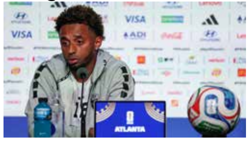
(એજન્સી) નવી દિલ્હી | તા. 30