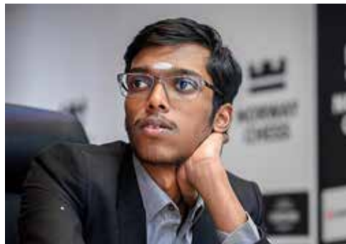
ઝાગ્રેબ । તા. 02