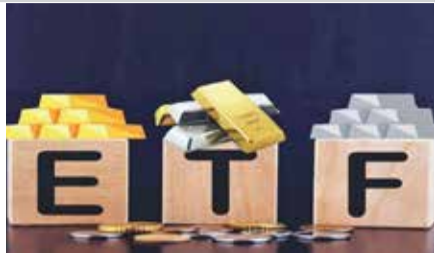
માસિક ઉપાડ જોવા બાદ, ગોલ્ડ ઈટીએફમાં પણ જૂનમાં અંદાજિત રૂ. ૨,૯૦૦ કરોડનું ચોખ્ખું રોકાણ આવ્યું છે અને અહીં ફરીથી ઇકારાત્મક સ્થિતિ બની છે.

જૂન મહિનામાં સિલ્વર ઈટીએફમાં અંદાજિત રૂ. ૪,૯૦૦ કરોડનું ચોખ્ખું રોકાણ ઠલવાયું હતું. આ અગાઉ સતત ચાર મહિનાનો કુલ મળીને અંદાજે રૂ. ૩,૭૭૦ કરોડનો ચોખ્ખો ઉપાડ નોંધાયો હતો. મે મહિનામાં એક વર્ષથી વધુ સમયગાળામાં પ્રથમ વખત