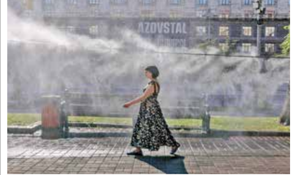
(એજન્સી) પેરિસ । તા. 04

યુરોપ ખંડમાં ચાલુ વર્ષે ઉનાળાની શરૂઆત સાથે જ પ્રકૃતિએ રોદ્ર સ્વરૂપ ધારણ કર્યું છે. આકરી ગરમી અને હીટવેવના કારણે ફ્રાન્સ અને બેલ્જિયમ જેવા દેશોમાં સામાન્ય જનજીવન અસ્તવ્યસ્ત થઈ ગયું છે. ફ્રાન્સમાં ગરમીને કારણે ૨,૦૦૦થી વધુ લોકોના મોત નીપજ્યા છે, જ્યારે બેલ્જિયમમાં ૧,૨૨૨ લોકોએ પોતાનો જીવ ગુમાવ્યો છે. હવામાન વિભાગની ચેતવણી મુજબ, આ ગરમીનો પ્રકોપ હજુ આગામી દિવસોમાં પણ યથાવત રહેવાની શક્યતા છે, જે ચિંતાનો વિષય બન્યો છે.