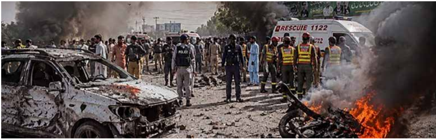
(એજન્સી) ગ્વાદર । તા. 04

પાકિસ્તાનના અશાંત પ્રાંત બલુચિસ્તાનમાંથી અત્યંત ચોંકાવનારા અને ભયાનક સમાચાર સામે આવી રહ્યા છે. ગ્વાદર જિલ્લાના જીવાની વિસ્તારમાં આવેલી પાકિસ્તાની કોસ્ટ ગાર્ડ્સની ચોકી પર પ્રતિબંધિત સંગઠન 'બલૂચ લિબરેશન આર્મી' (બીએલએ) દ્વારા આત્મઘાતી હુમલો કરવામાં આવ્યો છે. આ હુમલામાં ૩૦થી વધુ સુરક્ષાકર્મીઓના મોત થયા હોવાનો દાવો આતંકી સંગઠન દ્વારા કરવામાં આવ્યો છે. આ ઘટના બાદ પાકિસ્તાની સુરક્ષા તંત્રમાં ભારે દોડપામ મચી ગઈ છે અને વિસ્તારમાં ઉચ્ચ સ્તરીય એલર્ટ જાહેર કરી દેવામાં આવ્યું છે.