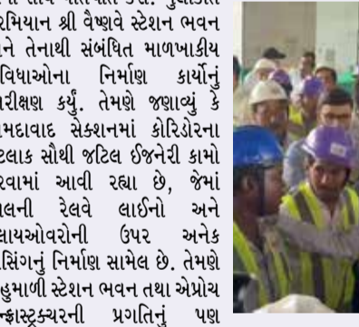
કેન્દ્રીય રેલ મંત્રી શ્રી અશ્વિની વૈષ્ણવે મુંબઈ-અમદાવાદ હાઈ-સ્પીડ રેલ કોરિડોર અંતર્ગત નિર્માણાધીન અમદાવાદ બુલેટ ટ્રેન સ્ટેશનની મુલાકાત લઈને પ્રોજેક્ટના પ્રગતિ કામોની સમીક્ષા કરી તથા આ મહત્વાકાંક્ષી પ્રોજેક્ટમાં કાર્યરત ઈજનેરો અને નિર્માણ ટીમો સાથે વાતચીત કરી.

સમર્પિત ભાવના, પ્રતિબદ્ધતા અને અચૂક પરિશ્રમની પ્રશંસા કરી. તેમણે નિર્માણ કામની સતત પ્રગતિ માટે ટીમોના વખાણ કરતા તેમને સુરક્ષા, ગુણવત્તા અને ઈજનેરી શ્રેષ્ઠતાના સર્વોચ્ચ ધોરણો જાળવી રાખીને કામ ચાલુ રાખવા માટે પ્રોત્સાહિત કર્યા. શ્રી વૈષ્ણવે જણાવ્યું કે અમદાવાદ બુલેટ ટ્રેન સ્ટેશનને એક સંપૂર્ણ સંકલિત (ઈન્ટિગ્રેટેડ) મલ્ટીમોડલ પરિવહન કેન્દ્ર તરીકે વિકસાવવામાં આવી રહ્યું છે, જે બુલેટ ટ્રેન સ્ટેશનને પરંપરાગત રેલવે સ્ટેશન, મેટ્રો તથા શહેરની બસ સેવાઓ સાથે સહજ રીતે જોડશે. તેમણે એ પણ જણાવ્યું કે સ્ટેશનની ડિઝાઇન અમદાવાદની સાંસ્કૃતિક ઓળખના પ્રતીક 'પતંગ'થી પ્રેરિત છે, જેમાં શહેરની સાંસ્કૃતિક વિરાસત અને વિશ્વસ્તરીય માળખાકીય સુવિધાનો ઉત્કૃષ્ટ સમન્વય કરવામાં આવ્યો છે. આ મુલાકાત વડાપ્રધાન શ્રી નરેન્દ્ર મોદીના નેતૃત્વમાં ભારત સરકારની એ પ્રતિબદ્ધતાને દર્શાવે છે, જે અંતર્ગત અદ્યતન ઈજનેરી, સંકલિત પરિવહન માળખું અને વૈશ્વિક ધોરણોને અનુરૂપ યાત્રીઓની સુવિધાઓ સાથે મુંબઈ-અમદાવાદ બુલેટ ટ્રેન પરિયોજનાને સમયબદ્ધ રીતે પૂર્ણ કરવામાં આવી રહી છે.