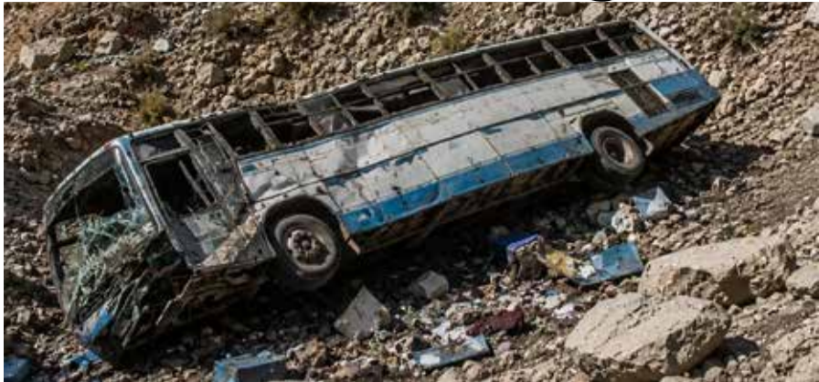
પોતાનો મુસાફરીનો સમય બચાવવા આ બસ પસંદ કરી હતી, તે જ તેમના માટે અંતિમ મુસાફરી સાબિત થઈ. આમ, કુલ ૪૮ મુસાફરો આ બસમાં સવાર હતા, જેમાંથી ૪૦ લોકો કાળનો કોળિયો બની ગયા છે. ઘટનાની જાણ થતા જ બલુચિસ્તાનના મુખ્યમંત્રી સરફરાજ બુગલીએ તાત્કાલિક અસરથી બચાવ

પાકિસ્તાનના બલુચિસ્તાન પ્રાંતમાં શુક્રવારે વહેલી સવારે સર્જાયેલી એક ભયાનક બસ દુર્ઘટનાએ સમગ્ર દેશને હચમચાવી દીધો છે. પ્રાપ્ત માહિતી અનુસાર, શેરાની જિલ્લાના ધનસાર વિસ્તારમાં એક મુસાફર બસ અનિયંત્રિત બનીને ઊંડી ખીણમાં ખાબકતા ઓછામાં ઓછા ૪૦ નિર્દોષ લોકોના ઘટનાસ્થળે જ કમકમાટીભર્યા મોત નીપજ્યા છે. આ ગોઝારી ઘટનામાં અન્ય ૮ મુસાફરો ગંભીર રીતે ઘાયલ થયા છે, જેમને સારવાર અર્થે નજીકની હોસ્પિટલમાં ખસેડવામાં આવ્યા છે.