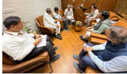
ભારતના સેમીકન્ડક્ટર નિર્માણ ક્ષેત્ર માટે ઐતિહાસિક દિવસ છે. તેમણે જણાવ્યું કે માનનીય વડાપ્રધાન શ્રી નરેન્દ્ર મોદી આજે સાણંદમાં દેશના ત્રીજા સેમીકન્ડક્ટર પ્લાન્ટનું ઉદ્ઘાટન કરશે. આ પહેલાં વડાપ્રધાન દ્વારા 28 ફેબ્રુઆરી અને 31 માર્ચના રોજ સાણંદમાં બે અન્ય સેમીકન્ડક્ટર પરિયોજનાઓનું શુભારંભ કરી દેવામાં આવ્યું છે. બેઠક દરમિયાન અમદાવાદ શહેર અને રેલવેથી જોડાયેલા નીચે જણાવેલા પાંચ મુખ્ય વિકાસ કામો પર નિર્ણય લેવામાં આવ્યા - 1. ઓમનગર અંડરપાસ (ROB) કામમાં ઝડપ કરીને કોઈપણ રીતે પૂર્ણ કરવામાં આવે, જેથી નાગરિકોને ઝડપી અવરજવર સુવિધા ઉપલબ્ધ થઈ શકે. 2. અસારવાદ સ્ટેશન અને ટર્મિનલનો સર્વગ્રાહી પુનઃવિકાસ

અમદાવાદ એરપોર્ટ પર જનપ્રતિનિધિઓ અને જનપ્રતિનિધિ મંડળ સાથે બેઠકમાં શહેર અને રેલવેથી જોડાયેલા પાંચ મુખ્ય વિકાસ કામોને ઝડપથી પૂરા કરવા માટે આપ્યા નિર્દેશ. કેન્દ્રીય રેલવે, સુચના અને પ્રસારણ તથા ઈલેક્ટ્રોનિક્સ અને સુચના પ્રોધોગિકી મંત્રી શ્રી અશ્વિની વૈષ્ણવેના અમદાવાદ આગમન પર આજે અમદાવાદ એરપોર્ટ પર અમદાવાદ મહાનગરના જનપ્રતિનિધિઓ અને પદાધિકારીઓએ તેમનું સ્વાગત કર્યું. આ અવસર પર શહેર અને રેલવે ઈન્ફ્રાસ્ટ્રક્ચરથી જોડાયેલા વિવિધ વિકાસ કામો પર વિગતવાર ચર્ચા થઈ. બેઠકમાં કેન્દ્રીય મંત્રીએ જણાવ્યું કે મુંબઈ-અમદાવાદ બુલેટ ટ્રેન પરિયોજનાનું કામ ઝડપી ગતિથી પ્રગતિ પર છે તથા પરિયોજનાનું લગભગ 80 ટકા કામ પૂર્ણ થઈ ચૂક્યું છે. તેમણે વિશ્વાસ વ્યક્ત કર્યો કે વર્ષ 2027 માં સુરત-ભિલિમોરા સેક્શન પર બુલેટ ટ્રેન સેવાનો પ્રથમ તબક્કો આરંભ કરવામાં આવશે, આ પછી ક્રમિક રૂપે વાપી-સુરત, અમદાવાદ અને અંતમાં મુંબઈ સુધી પરિયોજનાનું વિસ્તરણ કરવામાં આવશે. કેન્દ્રીય મંત્રીએ જણાવ્યું કે કેન્દ્ર સરકાર વડાપ્રધાન શ્રી નરેન્દ્ર મોદીના નેતૃત્વમાં અમદાવાદ સહિત સમગ્ર ગુજરાતમાં વિશ્વસ્તરનું રેલવે ઈન્ફ્રાસ્ટ્રક્ચર, આધુનિક સ્ટેશન, ઉત્તમ સડક સંપર્ક તથા અત્યાધુનિક પરિવહન સુવિધાઓના વિકાસ માટે પ્રતિબદ્ધ છે. આ પરિયોજનાઓના પૂર્ણ થવાથી યાત્રીઓની સુવિધા વધશે, શહેરી ટ્રાફિક સુગમ થશે તથા ક્ષેત્રના સમગ્ર આર્થિક અને સામાજિક વિકાસને નવી ગતિ મળશે. બેઠક ઉપરાંત કેન્દ્રીય મંત્રી શ્રી અશ્વિની વૈષ્ણવે એ કહ્યું કે આજે