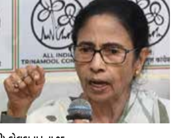
(એજન્સી) કોલકાતા | તા.05

15 જૂને TMCના 20 સાંસદોએ પણ પાર્ટી છોડીને ત્રિપુરાની નેશનાલિસ્ટ સિટિઝન્સ પાર્ટી (NCP)માં વિલિનીકરણ કરી લીધું હતું.