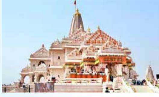
(એજન્સી) નવી દિલ્હી | તા.05

'કોઈએ ખિસ્સામાં તો કોઈએ મોજામાં નોટોની ગડ્ડી સંતાડી..', રામ મંદિર દાન ચોરીના CCTV રિકવર