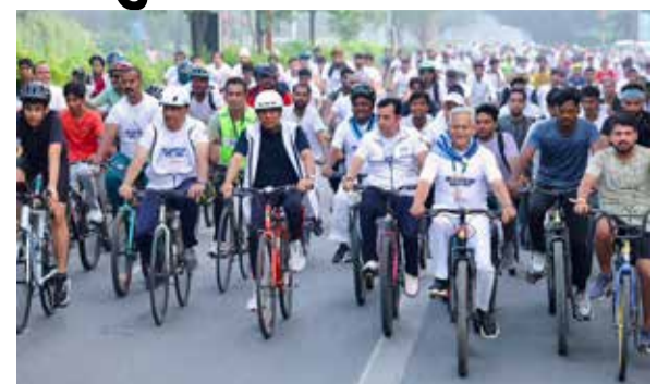
(એજન્સી) નવી દિલ્હી । તા. 05

કેન્દ્રીય યુવા બાબતો અને રમતગમત મંત્રી મનસુખ માંડવિયાએ આજે નવી દિલ્હીના જવાહરલાલ નેહરુ સ્ટેડિયમ ખાતે 'ફિટ ઇન્ડિયા સન્ડે ઓન સાયકલ'ના ૮૦મા સંસ્કરણનું નેતૃત્વ કર્યું હતું. સત્ય સાઈ સેવા સંસ્થાઓના સહયોગથી આયોજિત આ કાર્યક્રમમાં ૮,૦૦૦થી વધુ લોકોએ ભારે ઉત્સાહ સાથે ભાગ લીધો હતો. આ પ્રસંગે સાયકલિંગની સાથે કોમ્યુનિટી રન, ઝુબા અને યોગાના સત્રો પણ યોજાયા હતા.