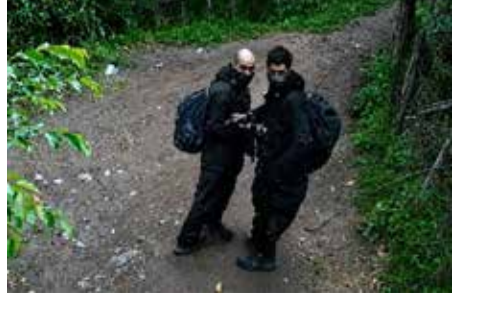
(એજન્સી) નવી દિલ્હી | તા.05

જમ્મુ-કાશ્મીરના શોપિયાના સેદપોરા વિસ્તારમાં શનિવારે સાંજથી ચાલી રહેલી અથડામણમાં લશ્કરના 2 આતંકીઓ માર્યા ગયા હોવાના સમાચાર છે. સુરક્ષા દળોએ આની પુષ્ટિ કરી નથી. જો કે કેટલાક મીડિયા અહેવાલો અનુસાર માર્યા ગયેલા બંને આતંકીઓની ઓળખ લશ્કર-એ-તૈયબા (LeT) ના ટોપ ઓપરેટિવ