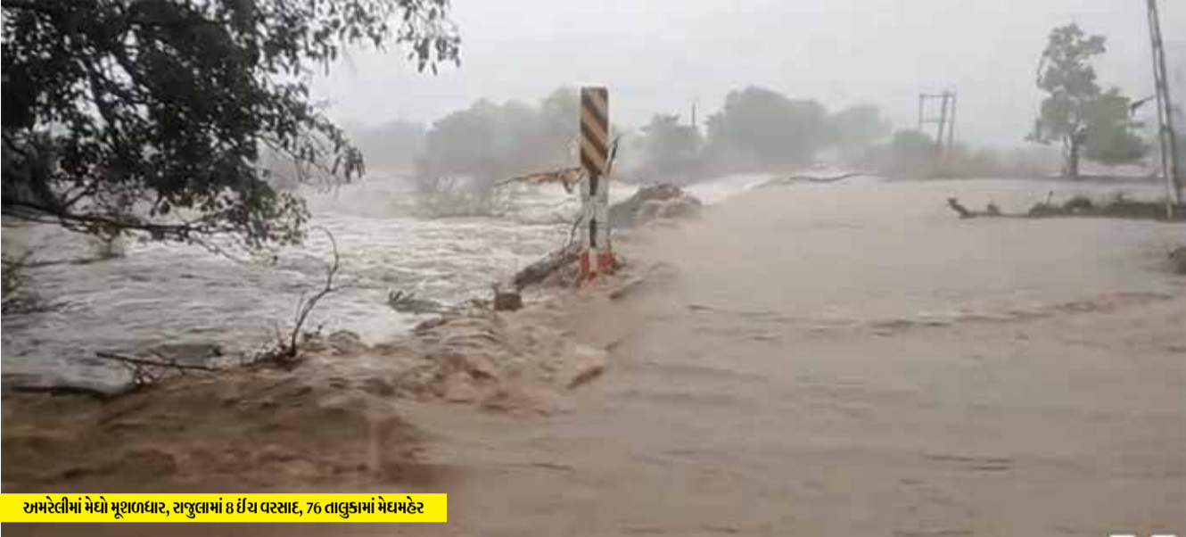
અમરેલીમાં મેઘો મૂળાધાર, રાજુલામાં ૮ ઈંચ વરસાદ, ૭૬ તાલુકામાં મેઘમહેર

અમરેલી જિલ્લામાં વહેલી સવારથી શરૂ થયેલી મેઘસવારીએ રવિવારે બપોર સુધીમાં તો વિકરાળ સ્વરૂપ ધારણ કરી લીધું હતું. ૮ કલાકમાં ૭૬ તાલુકાઓમાં નોંધાયેલા વરસાદ ખેડૂતોમાં આનંદની સાથે સાથે અનેક જગ્યાએ આકત પણ નોતરી છે. તંત્ર દ્વારા સલામતી માટે તાત્કાલિક અસરથી અસરગ્રસ્ત વિસ્તારોમાં ટીમ તેનાત કરવામાં આવી છે અને લોકોને નીચાણવાળા વિસ્તારોમાંથી સુરક્ષિત સ્થળે ખસેડવાની કામગીરી ચાલુ છે. આગામી દિવસોમાં પણ વરસાદી માહોલ જળવાઈ રહેવાની શક્યતા હોવાથી વહીવટી તંત્ર દ્વારા સતર્કતા રાખવામાં આવી રહી છે.