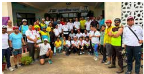
(એજન્સી) ભોપાલ । તા. 05

મધ્યપ્રદેશની રાજધાની ભોપાલમાં આવેલા સ્પોર્ટ્સ ઓથોરિટી ઓફ ઈન્ડિયા (SAI) ના સેન્ટ્રલ રિજનલ સેન્ટર ખાતે આજે 'સન્ડે ઓન સાયકલ' કાર્યક્રમનો વિશેષ આયોજન કરવામાં આવ્યું હતું. 'કોમ્યુનિટી ફિટનેસ રાઈડ' વિષય હેઠળ યોજાયેલી આ પહેલમાં 'આર્ટ ઓફ લિવિંગ ફાઉન્ડેશન'ના સહયોગથી અનેક લોકોએ ભાગ લીધો હતો.