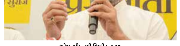
(એજન્સી) નવી દિલ્હી | તા.05

● નીતિન નબીનના ગઢમાં ભાજપને ટક્કર આપશે, જાણો ભાજપમાંથી કોણ હોઈ શકે છે ઉમેદવાર