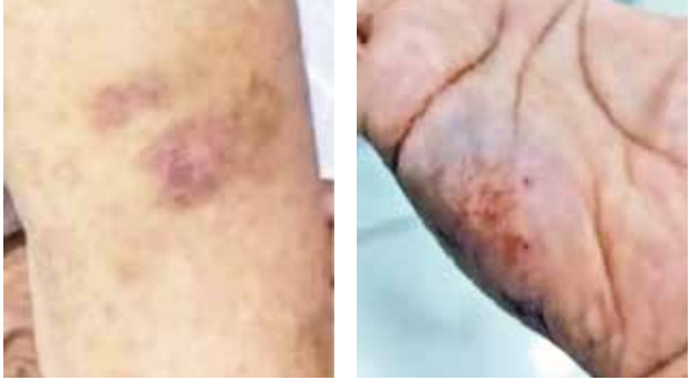
(એજન્સી) વડોદરા | તા.04

15 વર્ષથી મિલકતની વહેંચણીને લઈ યુવક અને તેની માતા તેમજ બહેન વચ્ચે ઝઘડો ચાલતો હતો. મિલકત માટે યુવક માતા અને બહેનને અપશબ્દો બોલી મારામારી કરતો હતો. ત્યારે કંટાળી બહેન અને માતાએ એક સાથે ઊંઘની 25 ગોળીઓ પી લઈને આપઘાત કરવાનો પ્રયાસ કર્યો હતો.