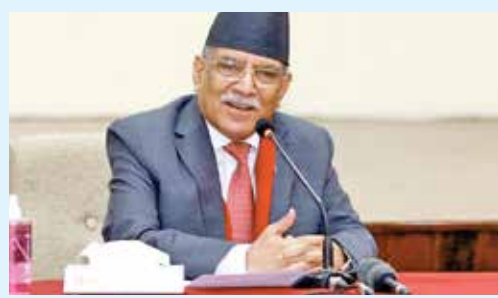
પોતાના નવા નકશામાં લિપુલેખ, લિમ્પિયાપુરા અને કાલાપાનીનો સમાવેશ કરશે.

100 રૂપિયાની નોટ પર જૂના નકશાને બદલે નવો નકશો બનાવવાનો નિર્ણય નેપાળના વડાપ્રધાન પુષ્પકમલ દહલ 'પ્રચંડ'ની અધ્યક્ષતામાં મંત્રી પરિષદની બેઠકમાં લેવામાં આવ્યો હતો. નેપાળે 4 વર્ષ પહેલા પોતાના રાજકીય નકશામાં આ ત્રણ વિસ્તારોનો સમાવેશ કર્યો હતો, જેના પર ભારતે સખત વાંધો વ્યક્ત કર્યો હતો. નેપાળે આવું કરીને ફરી એકવાર ભારત સાથે ગડબડ કરી છે. પાઝોશી દેશ નેપાળ કંઈક એવું કરવા જઈ રહ્યું છે જેનાથી ભારત સાથે ફરી એકવાર તણાવ વધી શકે છે. નેપાળે 100 રૂપિયાની નવી નોટ પર દેશનો નવો નકશો છાપવાની જાહેરાત કરી છે. આ નકશો એ ત્રણ વિવાદિત વિસ્તારો બતાવશે કે જેના પર ભારત તેની સત્તાનો દાવો કરે છે. નેપાળ