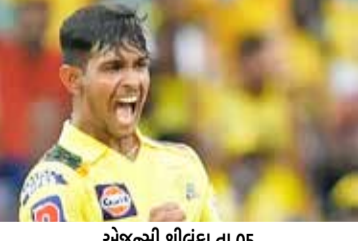
એજન્સી શ્રીલંકા તા 05

પિતાની ભૂમિકા નિભાવી રહ્યા છે. તેઓ હંમેશા મારું ધ્યાન રાખે છે અને મને સલાહ આપે છે કે શું કરવાનું છે. તેમનું મારા પિતાના જેવું જ વર્તન હોય છે. મને લાગે છે કે આ પૂરતું છે.' પથિરાનાએ ધોની દ્વારા માર્ગદર્શન કરવા પર કહ્યું, 'જ્યારે હું મેદાન કે મેદાનની બહાર હોવ છું તો તે મને ઘણી બાબતો જણાવતા નથી. તેઓ બસ નાની-નાની બાબતો જણાવે છે પરંતુ તેનાથી ઘણો ફરક પડે છે અને નાથી મને આત્મવિશ્વાસ મળે છે. આ નાની-નાની બાબતો મહત્વની હોય છે.' પથિરાના અગાઉ પણ ધોનીના વખાણ કરી ચૂક્યો છે. તેણે એક ઈન્ટરવ્યુમાં જણાવ્યું હતું કે હું ધોની પાસેથી ઘણું શીખ્યો છું. સૌથી પહેલી બાબત છે વિનમ્રતા અને આ કારણ છે કે ધોની ખૂબ સફળ છે. જ્યારે હું IPLમાં આવ્યો ત્યારે બાળક સમાન હતો અને કોઈ મને ઓળખતું નહોતું. તેમણે મને તૈયાર કર્યો અને ઘણી બાબતો શીખવાડી. હવે મને ખબર છે કે કોઈ પણ ટી20 મેચમાં કેવું પરફોર્મ કરવાનું અને મેચમાં પોતાની ચાર ઓવરને કેવી રીતે બેલેન્સ કરવાની છે. ધોનીએ મને કહ્યું કે જો હું પોતાના શરીરને ઈજાથી દૂર રાખું તો હું ટીમ અને દેશ માટે ઘણું મેળવી શકું છું. પથિરાનાએ આઈપીએલ 2024માં અચાર સુધી 6 મેચમાં 13 વિકેટ લીધી છે.