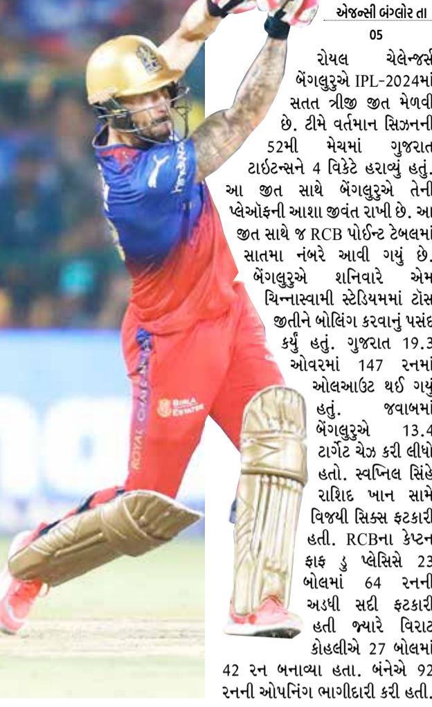
એજન્સી બંગલોર તા 05

ગુજરાત તરફથી જોશુઆ લિટલને 4, જ્યારે નૂર અહેમદે 2 વિકેટ ઝડપી હતી. ગુજરાત તરફથી રાહુલ તેવટિયા 35 રન બનાવીને, ડેવિડ મિલર 30 રન બનાવીને અને શાહરૂખ ખાન 37 રન બનાવીને આઉટ થયા હતા. રાશિદ ખાને 18 રન બનાવ્યા હતા. બેંગલુરુ તરફથી મોહમ્મદ સિરાજ, વિજયકુમાર વેશાખ અને યશ દયાલે 2-2 વિકેટ લીધી હતી. બેંગલોરની છઠ્ઠી વિકેટ પણ પડી, કોહલી આઉટ બેંગલુરુએ 11મી ઓવરમાં છઠ્ઠી વિકેટ પણ ગુમાવી દીધી છે. અહીં વિરાટ કોહલી 42 રન બનાવીને આઉટ થયો હતો. તે વિકેટકીપર રિદ્ધિમાન સાહાના હાથે નૂર અહેમદની બોલિંગમાં કેચ આઉટ થયો હતો. તેણે વિલ જેક્સ (એક રન)ને પણ આઉટ કર્યો હતો. 11 ઓવર પછી બેંગલુરુનો સ્કોર 117/6 હતો. બેંગલુરુએ પણ 10મી ઓવરમાં પાંચમી વિકેટ ગુમાવી દીધી છે. અહીં કેમરૂન શ્રીન એક રન બનાવીને આઉટ થયો હતો. તેને પણ જોશુઆ લિટલે શાહરૂખ પહેલાં, લિટલે ગ્લેન મેક્સવેલ (4 રન), ઈમ્પેક્ટ પ્લેયર રજત પાટીદાર (2) પણ આઉટ કર્યા હતા. બેંગલુરુને 15 રનમાં ચોથો ફટકો, મેક્સવેલ આઉટ બેંગલુરુએ 8મી ઓવરમાં ચોથી વિકેટ ગુમાવી દીધી હતી. ગ્લેન મેક્સવેલ 4 રન બનાવીને આઉટ થયો હતો.