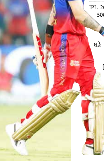
બંગલોર તા 05

IPL 2024માં 10 મેચ રમીને વિરાટ કોહલીના 500 રન છે. વિરાટનો ગુજરાત સામે જે પ્રકારનો રેકોર્ડ છે તેનાથી સ્પષ્ટ થાય છે કે આ મેચ બાદ તે ફરીથી ઓરિન્જ કેપની રેસમાં નંબર વન બની છે. આજે રોયલ ચેલેન્જર્સ બેંગલુરુનો સામનો ગુજરાત ટાઈટન્સ છે. આ ટીમ સામે વિરાટ કોહલી જ્યારે પણ રમે છે ત્યારે સારી બેટિંગ કરે છે અને મોટો સ્કોર કરે છે. એવામાં આજની મેચમાં વિરાટને રોકવું ગુજરાતના બોલરો માટે મોટો પડકાર છે. વિરાટ કોહલીને ગુજરાત ટાઈટન્સ સામે રમવાનું પસંદ છે. તમે તેની બેટિંગ એવરેજ અને IPL પિચ પર બનાવેલા રન પરથી આનો અંદાજ લગાવી શકો છો. IPL 2024માં ગુજરાત ટાઈટન્સ ફરી સામે છે. આ મેચ RCBના હોમ ગ્રાઉન્ડ પર પણ છે, જ્યાં વિરાટ કોહલીના નામે હજારો રન છે. તે સારી રીતે જાણે છે કે ચિન્નાસ્વામીના દરેક પ્લોથી કેવી રીતે રન બનાવવા. ગુજરાત સામેની મેચમાં વિરાટને તેના બેટમાંથી રન બનાવવાની અપેક્ષા પણ વધારે છે. એવામાં વિરાટને રોકવું ગુજરાતના બોલરો માટે મોટો પડકાર રહેશે. ગુજરાત સામે 151ની બેટિંગ એવરેજ વિરાટ કોહલી જ્યારે પણ ગુજરાત ટાઈટન્સ સામે રમ્યો છે ત્યારે તેણે શાનદાર પ્રદર્શન કર્યું છે. IPL 2024ની વાત કરીએ તો વિરાટની ટીમ RCB પોઈન્ટ ટેબલમાં સૌથી નીચે છે. તેના 10 મેચમાં માત્ર 6 પોઈન્ટ છે, એટલે કે પ્લેએફની રેસમાં સ્થિતિ ઘણી ખરાબ છે. બીજી તરફ ગુજરાત ટાઈટન્સની હાલત પણ બહુ સારી નથી. તેઓ 10 મેચમાં 8 પોઈન્ટ સાથે 8મા સ્થાને છે. મતલબ કે પ્લેએફની રેસમાં આ ટીમ માટે દરેક મેચ જીતતા રહેવું મહત્વપૂર્ણ છે. પરંતુ, વિરાટ તેમના ઈરાદામાં મોટો અવરોધ બની શકે છે. આખરે વિરાટના બેટ પર ગુજરાત કેવી રીતે બ્રેક લગાવશે? IPL 2024માં ગુજરાત ટાઈટન્સ ફરી સામે છે. આ મેચ RCBના હોમ ગ્રાઉન્ડ પર પણ છે, જ્યાં વિરાટ કોહલીના નામે હજારો રન છે.