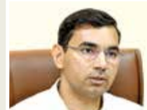
જણાવ્યું હતું કે, લોક પ્રતિનિધિત્વ અધિનિયમ 1951 ની કલમ-126 અંતર્ગત તા.05 મે, 2024 ના 18 કલાકથી એટલે કે મતદાન પૂર્ણ થવાના કલાક પૂર્વેના છેલ્લા 48 કલાક દરમિયાન ચૂંટણી પ્રચાર પર પ્રતિબંધ રહેશે.

મુક્ત, ન્યાયી અને પારદર્શી ચૂંટણીઓ યોજવા ભારતનું ચૂંટણી પંચ અને રાજ્યનું ચૂંટણી તંત્ર પ્રતિબદ્ધ છે ત્યારે તા. 7 મે ના રોજ યોજાનાર લોકસભાની સામાન્ય ચૂંટણી-2024 તથા વિધાનસભાની પેટાચૂંટણી સંદર્ભે ભારતના ચૂંટણી પંચની સુચનાઓ અને માર્ગદર્શિકાઓનું રાજ્યભરમાં સુચારૂ પાલન થાય તે માટેની તમામ વ્યવસ્થાઓ સુનિશ્ચિત કરવામાં આવી છે. મતદાનની પ્રક્રિયા મતદારો માટે સુખદ અનુભવ બની રહે તે માટે ગુજરાતનું ચૂંટણી તંત્ર સંપૂર્ણપણે સજ્જ છે. અધિક મુખ્ય નિર્વાચન અધિકારી ડૉ. કુલદીપ આર્યએ જણાવ્યું હતું કે, લોક પ્રતિનિધિત્વ અધિનિયમ 1951 ની કલમ-126 અંતર્ગત તા.05 મે, 2024 ના 18 કલાકથી એટલે કે મતદાન પૂર્ણ થવાના કલાક પૂર્વેના છેલ્લા 48 કલાક દરમિયાન ચૂંટણી પ્રચાર પર પ્રતિબંધ રહેશે.