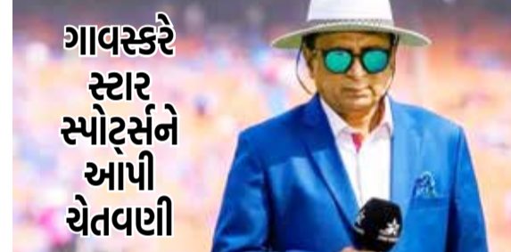
હેદરાબાદ તા 05

સનરાઈઝર્સ હેદરાબાદ સામે વિરાટ કોહલીની ધીમી ઈન્ડિયનની ટીકા થઈ હતી, ત્યારબાદ વિરાટે ગુજરાત સામે શાનદાર બેટિંગ કરી હતી અને પછી એક ઈન્ટરવ્યુમાં તેણે ટીકાકારોને જવાબ આપ્યો હતો કે તે લાંબા સમયથી રમી રહ્યો છે અને તેની રમતને સમજે છે. કોહલીની સ્ટ્રાઈક રેટને લઈ ભારતના મહાન બેટ્સમેન સુનીલ ગાવસ્કરે પણ ટીકા કરી હતી, જો કે તેને વારંવાર ટેલિકાસ્ટ કરવામાં આવતા તેઓ ખૂબ જ ગુસ્સે થયા છે.