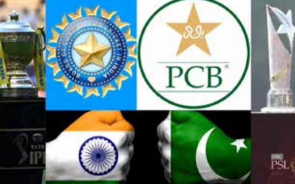
એજન્સી પાકિસ્તાન તા 05

PCBએ હવે BCCI સાથે સીધી સ્પર્ધા કરવાની જાહેરાત કરી છે. પાકિસ્તાની બોર્ડે એક પ્રેસ રિલીઝ જારી કરીને કહ્યું છે કે PSL-7 એપ્રિલથી 20 મે વચ્ચે યોજાશે, જ્યારે અગાઉ તે જાન્યુઆરી-ફેબ્રુઆરી મહિનામાં યોજાવામાં આવતું હતું. BCCI ઈન્ડિયન પ્રીમિયર લીગ (IPL) નું આયોજન માત્ર એપ્રિલ-મે મહિનામાં કરે છે. BCCI અને PCB વચ્ચે અવારનવાર તકરાર પણ થતી રહી છે. છેલ્લા દોઢ વર્ષમાં બંને વચ્ચે તણાવ ઘણો વધી ગયો છે. પહેલા એશિયા કપને લઈને બંને બોર્ડ વચ્ચે ઘણી દલીલો થઈ હતી અને હવે ચેમ્પિયન્સ ટ્રોફીને લઈને સંઘર્ષ ચાલુ છે. આ દરમિયાન પાકિસ્તાન ક્રિકેટ બોર્ડે હવે સીધું BCCI સાથે ગઠબંધ કરવાનો નિર્ણય લીધો છે. PSL અને IPL બંને બોર્ડની સૌથી વધુ કમાણી કરતી લીગને લઈને આ ગઠબંધ જોવા મળી રહી છે. નિર્ણય લીધો છે કે હવે તે IPL દરમિયાન જ PSLનું આયોજન કરશે.