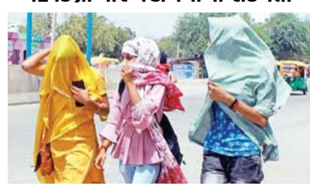
(એજન્સી), અમદાવાદ, તા.06

હવામાન વિભાગ દ્વારા આગામી 5 દિવસ રાજ્યના કેટલાક જિલ્લાઓમાં હીટવેચની શક્યતા વ્યક્ત કરવામાં આવી છે. છેલ્લા 24 કલાક દરમિયાન પોરબંદર, ભાવનગર, દીવ અને સુરતમાં હીટવેચની આગાહી કરવામાં આવી હતી. મધ્ય ગુજરાતના મહત્તમ તાપમાનમાં બેથી ત્રણ ડિગ્રીના વધારાની શક્યતાઓ દર્શાવી છે. અમદાવાદ અને આસપાસના વિસ્તારોમાં વાદળાળુ વાતાવરણ રહેતા તાપમાન એક ડિગ્રી કરતા વધુ વધારો નોંધાયો હતો. ત્યારબાદ આજે ઊંચકાતો મહત્તમ તાપમાન 41 ડિગ્રીથી વધુ નોંધાઈ શકે છે જ્યારે ગાંધીનગરમાં મહત્તમ તાપમાન 40 ડિગ્રી સુધી પહોંચી શકે છે. સૌરાષ્ટ્ર-કચ્છમાં પણ મોટાભાગના જિલ્લાઓમાં મહત્તમ તાપમાન 40 ડિગ્રી સુધી પહોંચી શકે છે. છેલ્લા 24 કલાક દરમિયાન સૌરાષ્ટ્રમાં ભાવનગર અને અમરેલીમાં રાજ્યનો મહત્તમ તાપમાન 41 ડિગ્રી સેલ્સિયસ નોંધાયું હતું. હાલમાં ગુજરાતના ઉત્તર-પશ્ચિમ દિશા તરફથી પવન ફૂંકાઈ રહ્યા છે, જેને કારણે તાપમાનમાં વધારો થઈ શકે છે. આજે પણ લોકોને ગરમીનો પ્રકોપ સહન કરવો પડશે.