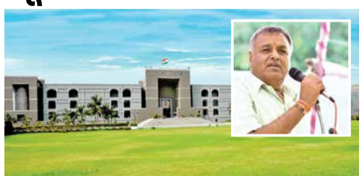
(એજન્સી), અમદાવાદ, તા.06