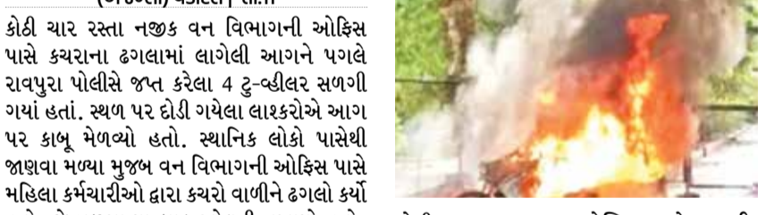
(એજન્સી) વડોદરા | તા.11

કોઠી ચાર રસ્તા નજીક વન વિભાગની ઓફિસ પાસે કચરાના ઢગલામાં લાગેલી આગને પગલે રાવપુરા પોલીસે જત્ન કરેલા 4 ટુલ્લીલર સળગી ગયાં હતાં. સ્થળ પર દોડી ગયેલા લોકોએ આગ પર કાબુ મેળવ્યો હતો. સ્થાનિક લોકો પાસેથી જાણવા મળ્યા મુજબ વન વિભાગની ઓફિસ પાસે મહિલા કર્મચારીઓ દ્વારા કચરો વાળીને ઢગલો કર્યો હતો. જે સળગાવ્યા બાદ ઓલવી નખાયો હતો. જોકે ધુમાડો નીકળતો હતો. જેને પગલે લોકોએ ટકોર પણ કરી હતી કે, આ જોખમી સાબિત થઈ શકે છે. પરંતુ આગ જણાતી ન હોવાથી મહિલા કર્મચારીઓ રવાના થઈ હતી. બીજી તરફ ગણતરીની મિનિટોમાં સૂકાં પાંદડાં અને અન્ય કચરામાં આગ પકડાતાં ત્યાં મૂકેલા રાવપુરા