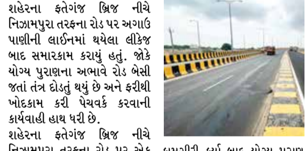
(એજન્સી) વડોદરા | તા.11

શહેરના ફતેગંજ બ્રિજ નીચે નિઝામપુરા તરફના રોડ પર અગાઉ પાણીની લાઈનમાં થયેલા લીકેજ બાદ સમારકામ કરાયું હતું. જોકે યોગ્ય પુરાણના અભાવે રોડ બેસી જતાં તંત્ર દોડતું થયું છે અને ફરીથી ખોદકામ કરી પેચવર્ક કરવાની કાર્યવાહી હાથ ધરી છે. શહેરના ફતેગંજ બ્રિજ નીચે નિઝામપુરા તરફના રોડ પર એક મહિના અગાઉ ફાજલપુરથી પાણી આવતી પાણીની 900 મિમીની લાઈનમાં ભંગાણ પડ્યું હતું. જેમાં રોજ 1 લાખ લિટર પાણીનો વેડફટ થયો હતો. અંદાજિત 31 કલાકની કામગીરી બાદ ભંગાણનું સમારકામ પેચવર્ક કર્યું હોવાની માહિતી મળી છે.