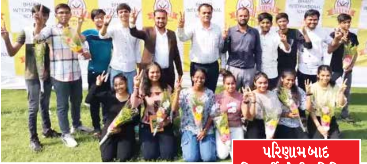
(એજન્સી) સુરત | તા.11