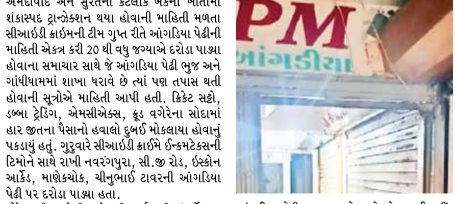
(એજન્સી) ભુજ | તા.11

અમદાવાદ અને સુરતની કેટલાક બેંકના ખાતામાં શંકાસ્પદ ટ્રાન્ઝેક્શન થયા હોવાની માહિતી મળતા સીઆઈટી કાર્ટમની ટીમ ગુપ્ત રીતે આગળિયા પેટીની માહિતી એકત્ર કરી 20 થી વધુ જગ્યાએ દરોડા પાડ્યા હોવાના સમાચાર સાથે જે આગળિયા પેટી ભુજ અને ગાંધીધામમાં શાખા ધરાવે છે ત્યાં પણ તપાસ થતી હોવાની સૂત્રોએ માહિતી આપી હતી. ક્રિકેટ સ્ટેડી, ડબ્બા ટ્રેડિંગ, એમસીએક્સ, ફૂડ વગેરેના સોદામાં હાર જીતના પેસાનો હવાલો દુબઈ મોકલાયા હોવાનું પકડાયું હતું. ગુરુવારે સીઆઈટી કાર્ટમ ઈન્કમટેક્સની ટિમોને સાથે રાખી નવરંગપુરા, સી. જી રોડ, ઈસ્કોન આર્કેડ, માણેકચોક, ચીનુભાઈ ટાવરની આંગળિયા પેટી પર દરોડા પાડ્યા હતા.