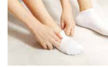
કારણે પગની ત્વચાને નુકસાન થવાનો ભય રહે છે. જો તેમને ઉનાળાની ઋતુમાં સતત મોજાં પહેરે છે તો તમારા પગમાં પરસેવો આવવા લાગે છે. ભેજમાં વધારો ફંગલ થવાનું કારણ બની શકે છે. જેના કારણે પગની ત્વચા સંપૂર્ણપણે ક્ષતિગ્રસ્ત થઈ શકે છે. રક્ત પરિભ્રમણ અસર: વધુ પડતા ફિટ મોજાં પહેરવાથી પગમાં સોજાં આવી શકે છે. જેના કારણે વ્યક્તિ બેચેની અને અતિશય ગરમી થવા લાગે છે. જો તેમને સવારથી રાત સુધી મોજાં પહેરવાનું રાખ્યું છે, તો તમને તમારા પગમાં જકડાઈ જવાની સમસ્યાનો પણ સામનો કરવો પડી શકે છે. હીલ અને અંગૂઠાનો વિસ્તાર પણ સુન્ય થઈ શકે છે. પગમાં જે પરસેવો નીકળે છે તેને મોજાં શોષી લે છે. આવી સ્થિતિમાં, જો લાંબા સમય સુધી મોજાં પહેરવાથી પરસેવો સંપૂર્ણપણે સુકાઈ ન જાય, તો મોજાંમાં બેક્ટેરિયા અને વાયરસ વધે છે, જે ફંગલ ઈન્ફેક્શન

ઉનાળાની ઋતુમાં સ્વાસ્થ્ય સારું જાળવવા માટે ઘણી સાવચેતી રાખવી પડે છે. આપણી કેટલીક આદતો સ્વાસ્થ્ય માટે હાનિકારક હોય છે. આવી જ એક આદત લાંબા સમય સુધી મોજાં પહેરવાની છે. હકીકતમાં, ઘણા લોકો શાળાએ જવાથી લઈને ઓફિસમાં કામ કરવા માટે ઘણા કલાકો સુધી મોજાં પહેરે છે. આવું કરવું શરીર માટે હાનિકારક છે. જો તેમને ઉનાળાની ઋતુમાં લાંબા સમય સુધી મોજાં પહેરે છે તો તમારી આ આદતને બદલો, નહીં તો તમારે ઘણાં જોખમોનો સામનો કરવો પડી શકે છે. ઘણા લોકો સસ્તા અને નબળી ગુણવત્તાવાળા મોજાં પહેરે છે. જેના