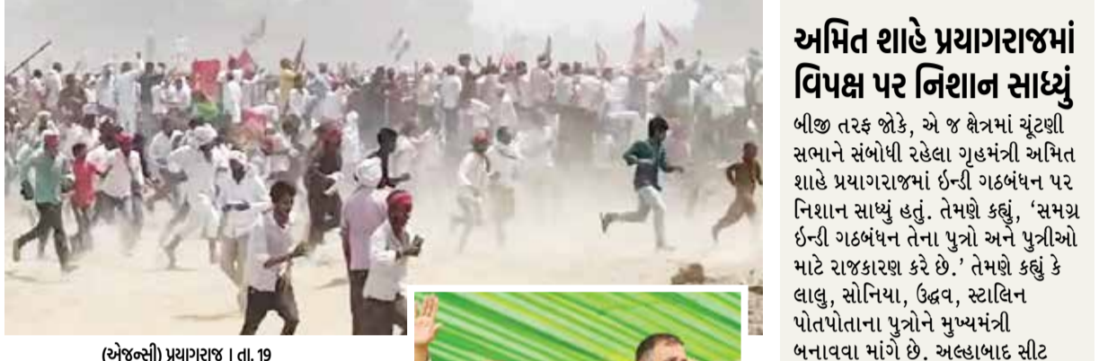
(એજન્સી) પ્રયાગરાજ 1 તા. 19

યુપીના પ્રયાગરાજમાં ઈન્ડિ ગઠબંધનની જાહેર સભામાં રવિવારે બપોરે નાસભાગ મચી ગઈ હતી. આ નાસભાગમાં અનેક લોકો ધાયલ થયા હોવાના અહેવાલ છે. કહેવાય છે કે સભાના સ્થળે અખિલેશ યાદવ આવી પહોંચ્યા ત્યારે તેમને મળવા માટે કાર્યકર્તાઓ બેકાબૂ બની ગયા અને બેરિકેડ તોડીને સ્ટેજ પર ચઢવાનો પ્રયાસ કરવા લાગ્યા હતા. નાસભાગને કારણે મીડિયાકર્મીઓના કેમેરા અને સ્ટેન્ડ પણ તૂટી ગયા હતા. અરાજકતાનો માહોલ સર્જાયો હતો. કુલપુરના પંડિલામાં આ જાહેરસભાનું આયોજન