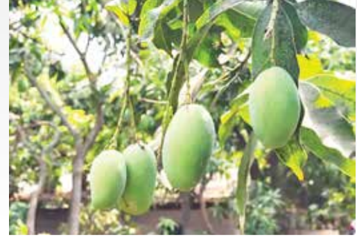
(એજન્સી) નવસારી | તા.19

આ વખતે પહેલી ગરમીથી સમગ્ર માનવજાત ઉકળાટ અનુભવે છે, પરંતુ એ વિચારે થોડી રાહત હોય છે કે ઉનાળામાં જીભને જલસા કરાવતી કેરીના સબકડા લેવાનો આનંદ મળશે. પણ બદલાયેલા વાતાવરણે મનુષ્ય પાસેથી આ વખતે મજા પણ ઈનવી લીધી છે. કારણ કે શરૂઆતમાં પહેલી ગરમીને કારણે આમ્રમંજરી ઉપર સીધી અસર થઈ હતી. જે બાદ પહેલા ફાલનો પાક તો માર્કેટમાં ઠલવાયો અને વેચાયો પણ હતો, પરંતુ બીજા ફાલનો પાક અપરિપક્વ રહ્યો છે જે ગ્રાહકો ઘરે લઈ ગયા બાદ પાકતો નથી જેથી કેરીનો સાચો સ્વાદ માણવો હોય તો 25 મી મે