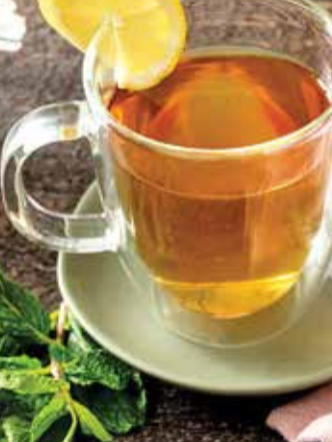
ગાળીને પી લો. નોંધ: અહીં આપવામાં આવેલી માહિતી ફક્ત આપની જાણકારી માટે છે. કોઈપણ દવા અથવા સારવારનો વિકલ્પ હોઈ શકે નહીં. વધુ માહિતી માટે હંમેશા તમારા ડોક્ટરની સલાહ લો.

તે શરીરને ડિટોક્સિફાય પણ કરે છે. તેને બનાવવા માટે ગરમ પાણીમાં લીબુનો રસ મિક્સ કરો અને તેમાં થોડું મધ ઉમેરો. તમારી ચા તૈયાર કરો. આદુની ચાના સ્વાસ્થ્ય માટે પણ ઘણા ફાયદા છે. તેમાં બળતરા વિરોધી ગુણ હોય છે, જે પેટની સમસ્યાઓમાં રાહત આપે છે. તેને બનાવવા માટે ગરમ પાણીમાં આદુના ટુકડા નાખીને ઉકાળો. પછી તેને ગાળીને તેમાં લીબુનો રસ નાખીને પીવો. શરીરમાં એન્ટીઓક્સિડન્ટ વધારવા માટે ગ્રીન ટીના ઘણા ફાયદા છે. આ ચા મેટાબોલિઝમને પણ બુસ્ટ કરે છે. તેને બનાવવા માટે એક કપ ગરમ પાણીમાં ગ્રીન ટી બેગ અને લીબુનો રસ ઉમેરો. ફુદીનાની ચા પેટ માટે ખૂબ જ સારી છે. તેમાં રહેલું મેન્થોલ તમને ઠંડકનો અહેસાસ કરાવે છે અને માનસિક યાદને પણ દૂર કરે છે. પછી તેને ગાળીને તેમાં મધ મિક્સ કરીને પીવો. કેમોલી ચા મનને શાંત કરવામાં અને તણાવ ઘટાડવામાં મદદ કરે છે. તેને બનાવવા માટે કેમોલાઈલ ટી બેગને ગરમ પાણીમાં 5-10 મિનિટ માટે ડુબાડી રાખો અને પછી તેને