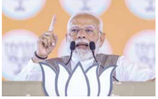
(એજન્સી) નવી દિલ્હી 1 તા. 19

વડાપ્રધાન નરેન્દ્ર મોદીએ લોકસભા ચૂંટણીના પ્રચાર દરમિયાન ઉત્તર-પૂર્વીય દિલ્હીમાં ચૂંટણી રેલીને સંબોધન કરતા કહ્યું કે, આ લોકસભા ચૂંટણી ભારતને દુનિયાનું ત્રીજું સૌથી મોટું અર્થતંત્ર બનાવવા મજબૂત અને સ્થિર સરકારની પસંદગી કરવા માટે છે. દેશના અર્થતંત્રને એવા લોકોથી બચાવવાનો છે, જેમની આર્થિક નીતિઓથી ભારત દેવાળીયાની સ્થિતિમાં પહોંચી ગયું હતું. જમ્મુ-કાશ્મીરમાં કલમ 370નો મુદ્દો ઉઠાવતા મોદીએ ફરી કહ્યું કે, તેમની ધાકડ સરકારે કલમ 370ની દિવાલ પાડી દીધી. લોકસભા ચૂંટણીમાં દિલ્હીમાં સૌપ્રથમ રેલી કરતા નરેન્દ્ર મોદીએ કહ્યું કે, આ ચૂંટણી અંતરિક્ષ અને વિચારસરણીને હરાવવા માટે છે, જેણે વર્ષો સુધી પરિવારવાદને પ્રોત્સાહન આપતા ભારતના યુવાનોનું ભવિષ્ય બરબાદ કરી દીધું છે. આ ચૂંટણી ગરીબ અને મધ્યમ વર્ગના લોકોનું જીવન સરળ બનાવવા અને તેમના જીવનમાં ખુશીઓ લાવવા માટેની સરકાર પસંદ માટે છે.