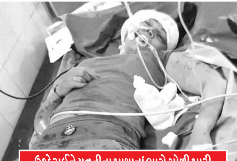
ઉશ્કેરાઈને યુવતીના માથાના ભાગે ગોળી મારી