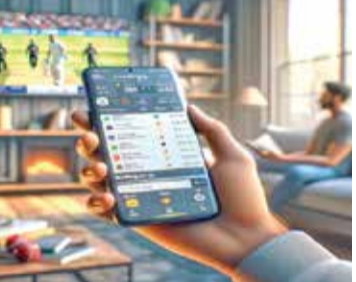
લગાવાયેલા રૂ. 7.71 લાખ કરોડ કરતાં વધુ છે. સ્પોર્ટ્સ સટ્ટાબાજીની કુલ ગ્રોસ ગેમિંગ આવક 2023માં 90 હજાર કરોડ રૂપિયા સુધી પહોંચવાની ધારણા છે, જે ગયા વર્ષના રેકોર્ડને તોડી નાખ્યું હતો. સટ્ટાબાજી પર 4.15 લાખ કરોડનો ખર્ચ કરશે, ન્યૂયોર્કથી સર્વાધિક ટેક્સ, વધુ મેચ પણ ત્યાં.. અમેરિકન ગેમિંગ રેવન્યુ ટ્રેકર અનુસાર, ફેબ્રુઆરીમાં સુપર બાઉલ પર રૂ. 87,067 કરોડ રૂપિયાનો દાવ લગાવ્યો હતો. આ 24.8% નો વાર્ષિક વધારો હતો. ક્રિકેટ સહિત, અમેરિકનો એક વર્ષમાં 4.15 લાખ કરોડ રૂપિયા સટ્ટાબાજી પર ખર્ચ કરશે. ગત વર્ષે કાયદાકીય સટ્ટાબાજી પર કુલ 10 લાખ કરોડનો ખર્ચ કરવામાં આવ્યો હતો.

ભારતમાં પૈસા, પ્રતિષ્ઠા અને પાવરનો પયાંય ક્રિકેટ હવે અમેરિકામાં પ્રથમ વખત ટી-20 વર્લ્ડ કપ ફોર્મેટમાં રમાઈ રહ્યું છે. આ સાથે જે બાબત સૌથી વધુ ચર્ચામાં છે તે સટ્ટાબાજી છે. ભારતમાં તે ગેરકાયદેસર છે, પરંતુ અમેરિકામાં કાયદેસર છે. તેથી જ ક્રિકેટની રમત 'ધનવર્ષા'ના નવા વિકલ્પ તરીકે ઉભરી આવી છે. આ માટે સટ્ટાબાજીની વેબસાઈટ ડ્રાફ્ટિંગ્સે એનએફએલ સાથે પાર્ટનરશિપ કરી છે. ઈએસપીએનએ સત્તાવાર સ્પોર્ટ્સ બુક તૈયાર કરી છે. તેથી મેચના પહેલા દિવસથી જ સટ્ટાબાજી શરૂ થઈ ગઈ છે. સ્પોર્ટ્સ બેટિંગનું આકલન કરનાર નૂહ નેપરાસ્ટ મુજબ, ટી-20 પર પહેલા જ દિવસે 200 કરોડથી વધુનો દાવ લગાવવાની આશંકા છે. બેટિંગની 500 વેબસાઈટ્સ અને એપ સક્રિય થઈ છે. અમેરિકામાં રમત અને સટ્ટાબાજી એકસાથે ચાલે છે. તમે સટ્ટાબાજીવાળી એપ પર મેચ જોઈ રહ્યા છો, ખેલાડી બોલ ફેંકવાનો છે. અમેરિકન ગેમિંગ એસોસિયેશનના જણાવ્યા અનુસાર અમેરિકનોએ ગયા વર્ષે કાનૂની રમતનાં પુસ્તકો પર રૂ. 10 લાખ કરોડના દાવ લગાવ્યા હતા, જે 2022માં