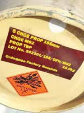
(એજન્સી) જેસલમેં | તા 02

હમાસ અને ઈઝરાયેલ વચ્ચે ભીષણ યુદ્ધને સાત મહિના કરતાં વધુ સમય થયો ઈઝરાયેલ-હમાસ યુદ્ધ વચ્ચે દક્ષિણ ગાજા પટ્ટીમાં આવેલા રફાહ શહેરમાં હજારોની સંખ્યામાં લોકો જિંદગી અને મોતથી જમ્મી રહ્યા છે. 26મેએ ઈઝરાયેલે રફાહ શહેર પર મિસાઈલ હુમલો કર્યો હતો. આ હુમલામાં 45 નિર્દોષ લોકોનો મોત થયા હતા. ઈઝરાયેલના આ હુમલાને લઈ વિશ્વભરમાં લોકોએ ચિંતા વ્યક્ત કરી હતી. ઈજિપ્તની સરહદ પર આવેલા આ દેશમાં ઈઝરાયેલી સૈન્ય કાર્યવાહી કરી રહ્યું છે. 26 મેના રોજ ઈઝરાયેલે રફાહ શહેર પર મિસાઈલ હુમલો કર્યો હતો. આ હુમલામાં 45