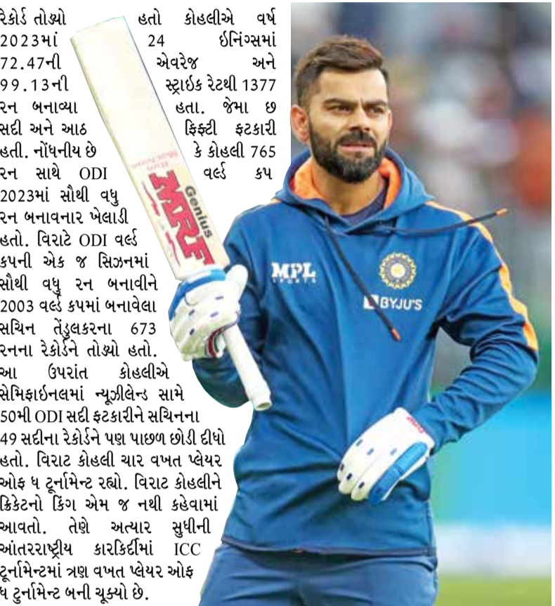
રેકોર્ડ તોથો 2023માં 72.47ની 99.13ની રન બનાવ્યા સદી અને આઠ હતી. નોંધનીય છે રન સાથે ODI 2023માં સૌથી વધુ રન બનાવનાર ખેલાડી હતો. વિરાટે ODI વર્લ્ડ કપની એક જ સિઝનમાં સૌથી વધુ રન બનાવીને 2003 વર્લ્ડ કપમાં બનાવેલા સચિન તેંડુલકરના 673 રનના રેકોર્ડને તોથો હતો. આ ઉપરાંત કોહલીએ સેમિફાઇનલમાં ન્યૂઝીલેન્ડ સામે 50મી ODI સદી ફટકારીને સચિનના 49 સદીના રેકોર્ડને પણ પાછળ છોડી દીધો હતો. વિરાટ કોહલી ચાર વખત વ્લેયર ઓફ ધ ટુર્નામેન્ટ રહ્યો. વિરાટ કોહલીને ક્રિકેટનો કિંગ એમ જ નથી કહેવામાં આવતો. તેણે અત્યાર સુધીની આંતરરાષ્ટ્રીય કારકિર્દીમાં ICC ટુર્નામેન્ટમાં ત્રણ વખત વ્લેયર ઓફ ધ ટુર્નામેન્ટ બની ચૂક્યો છે.

અમેરિકામાં T-20 વર્લ્ડ કપ 2024 પ્રારંભ થઈ ગયો છે. ભારતીય ટીમે બાંગ્લાદેશ સામે પોતાની પ્રથમ વોર્મ અપ મેચ સાથે આગાહી કરી દીધી છે. ત્યારે વિરાટ કોહલીના કેન્સ માટે આનંદ અને ગર્વ આપે તેવા સમાચાર સામે આવ્યા છે. ભારતીય બેટર વિરાટ કોહલીને ICC ODI પ્લેયર ઓફ ધ યર 2023નો એવોર્ડ આપવામાં આવ્યો છે. વિરાટને ન્યૂયોર્કમાં મેચ પહેલા આ માટે ખાસ કેપ આપવામાં આવી હતી. વિરાટનું 2023માં પ્રદર્શન ખૂબ જ શાનદાર રહ્યું ભારતીય ટીમ T-20 વર્લ્ડ કપમાં ભાગ લેવા માટે અમેરિકામાં છે. જેમાં કોહલી આ ફટાફટ ક્રિકેટના મહાકુર્મમાં ટીમનો મહત્વનો ખેલાડી છે અને ટીમને તેની પાસેથી શાનદાર ઈનિંગ્સની અપેક્ષા છે. ત્યારે કિંગ કોહલીના કરિયરમાં વધુ એક સિદ્ધિ હાસલ કરી છે. ICCએ 'ICC એવોર્ડ્સ 2023'ની જાહેરાત કરી છે. જેમાં કોહલીને વનડે પ્લેયર ઓફ ધ યર એવોર્ડ એનાયત કરવામાં આવ્યો છે. વિરાટનું 2023માં પ્રદર્શન ખૂબ જ શાનદાર રહ્યું હતું. તેલુલકરનો