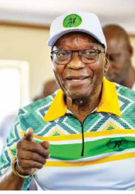
(એજન્સી) કેપટાઉન | તા 02

દક્ષિણ આફ્રિકામાં 29 મેના રોજ સામાન્ય ચૂંટણીઓ યોજાઈ હતી. ન્યૂઝ એજન્સી રોઈટર્સ અનુસાર, અત્યાર સુધીમાં 97.25% મતની ગણતરી થઈ ચૂકી છે. આમાં નેલ્સન મડેલાની પાર્ટી આફ્રિકન નેશનલ કોંગ્રેસને સૌથી વધુ 40.13% મત મળ્યા છે. તે સરકાર બનાવવા માટે જરૂરી 50% વોટ મેળવી શકી ન હતી. 30 વર્ષમાં આ પ્રથમ વખત છે જ્યારે આફ્રિકન નેશનલ કોંગ્રેસ (ANC) ને બહુમતી મળી નથી. તે જ સમયે, સેક્સ સ્કેન્ડલ અને ભ્રષ્ટાચારના આરોપોને