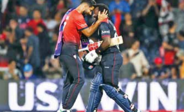
બનાવી દીધું. કોરી એન્ડરસન 3 રન બનાવીને અફનમ રહ્યો હતો. કેનેડાના કેપ્ટન સાદ બિન ઝફરે અમેરિકા સામે છ બોલરોનો ઉપયોગ કર્યો હતો, પરંતુ તેનો કોઈ બોલર જોન્સ અને ગોસને રોકવામાં સફળ રહ્યો ન હતો. કેનેડિયન બોલર ખર્ચાળ સાબિત થયા માત્ર ડાયલન હેલિગરને પ્રભાવશાળી બોલિંગ કરી અને એને 3 ઓવરમાં 19 રન આપીને 1 વિકેટ લીધી. નિખિલ દત્તા અને કલીમ સનાને 1-1 સફળતા મળી. પરંતુ બંને ખર્ચાળ સાબિત

T-20 World Cup 2024 USA vs CAN : ICC T-20 વર્લ્ડ કપ 2024ની આજથી શરૂઆત થઈ ગઈ છે. વર્લ્ડ કપની પ્રથમ મેચ કેનેડા અને યજમાન અમેરિકા વચ્ચે ડબ્લાસના ક્રિકેટ સ્ટેડિયમમાં રમાઈ હતી. આ બંને ટીમોની T-20 વર્લ્ડ કપની ડેબ્યૂ મેચ હતી. અમેરિકાએ કેનેડાના 195 રનના ટાર્ગેટને 14 બોલ બાકી રહેતા માત્ર 3 વિકેટ ગુમાવીને હાંસલ કરી લીધો અને T-20 વર્લ્ડ કપમાં શાનદાર શરૂઆત કરી. એક સમયે અમેરિકા તેના બંને ઓપનિંગ બેટરોની વિકેટ ગુમાવીને સંઘર્ષ કરી રહ્યું હતું. પરંતુ એરોન જોન્સ સાથે મળીને એન્ડ્રીસ ગોસે મેચનું પાસું જ બદલી નાખ્યું હતું. ત્રીજી વિકેટ માટે 121 રનની ભાગીદારી એરોન જોન્સ અને એન્ડ્રીસ ગોસે ત્રીજી વિકેટ માટે 9.1 ઓવરમાં 121 રનની ભાગીદારી કરી હતી. એન્ડ્રીસ ગોસે 65 રન બનાવ્યા હતા. એરોન જોન્સે 40 બોલમાં 7 ચોગ્ગા અને 3 છગ્ગાની મદદથી 65 રન બનાવ્યા હતા. એરોન જોન્સે 40 બોલમાં 4 ચોગ્ગા અને 10 છગ્ગાની મદદથી 94 રનની અફનમ ઈનિંગ રમી અને કેનેડાના વિશાળ લક્ષ્યને ખૂબ જ સરળ