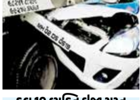
કુલ 10 વ્યક્તિ ઈજા ગ્રસ્ત

ઉપપ્રમુખ સહિત મોટી સંખ્યામાં કાર્યકર્તા-આગેવાનો આમ આદમી પાર્ટીથી મોહભંગ થતા કોંગ્રેસ પક્ષની વિચારધારા સાથે વિધીત રીતે જોડાયા હતા. આમ આદમી પાર્ટીમાંથી જોડાયેલ સર્વે આગેવાનોએ એક જ સુરમાં કહ્યું હતું કે, આમ આદમી પાર્ટીએ માત્ર સત્તા વિરોધી કોંગ્રેસને મળતા મતને તોડવા માટે અને ભાજપને જીતાડવા માટે જ કાર્યરત છે, દિલ્હીથી આવેલા આપના નેતાઓ માત્રને માત્ર જાણે ભાજપના સમર્થનમાં આદેશો આપતા હોય તેવા વારંવાર અનુભવો થતાં હતા. અંતે સત્યનું જ્ઞાન થતાં કોંગ્રેસ એક માત્ર સૌને સાથે લઈને ચાલનારી પાર્ટી છે અને ભાજપના તાનાશાહી શાસનને પડકારી શકવા સક્ષમ છે તથા ભાજપના ભય, ભુખ અને ભ્રષ્ટાચારની નીતિ સામે ટક્કર લઈ પ્રજાલક્ષી અભિગમ સાથે કાર્ય કરી રહી છે અને અમે દુધમાં સાકરની જેમ ભળીને કોંગ્રેસી વિચારધારાને જનજન સુધી પહોંચાડવા કટીબધ્ધ રહીશું.