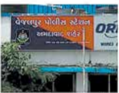
યુવતીએ વેજલપુર પોલીસ સ્ટેશનમાં ફરિયાદ નોંધાવી