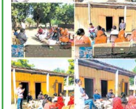
આશા અને ભાઈ માટે મિશન ટાઈમ

લક્ષ્યોની લક્ષ્મણ રેખા: 'નમોશ્રી' થી 'PMJAY'