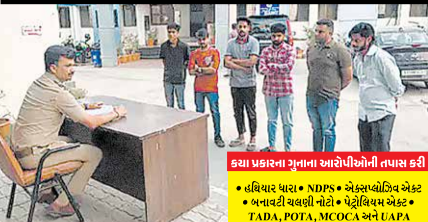
કયા પ્રકારના ગુનાના આરોપીઓની તપાસ કરી • હથિયાર ધારા • NDPS • એક્સપ્લોઝિવ એક્ટ • બનાવટી ચલણી નોટો • પેટ્રોલિયમ એક્ટ • TADA, POTA, MCOCA અને UAPA

અમદાવાદ | રાજ્યના DGPએ 100 કલાકમાં છેલ્લા 30 વર્ષમાં ગંભીર ગુનાને અંજામ આપી ચુકેલા આરોપીઓનું ચેકિંગ કરી રિપોર્ટ આપવા સૂચના આપી હતી. જે અંતર્ગત અમદાવાદ ગ્રામ્ય પોલીસ દ્વારા ગ્રામ્યના 960 આરોપીઓનું ચેકિંગ કર્યું હતું. પોલીસ દ્વારા ગંભીર પ્રકારના 6 અલગ અલગ ગુનાના આરોપીનું ડોઝિયર પણ તૈયાર કરવામાં આવ્યું છે જેથી આરોપીઓનું મોનીટરીંગ થઈ શકે. DGP ના આદેશ બાદ અમદાવાદ ગ્રામ્ય પોલીસ દ્વારા વિવિધ ટીમ બનાવવામાં આવી હતી. જેમાં 4 DYSP, 25 પીઆઈ, 52 PSI અને 330 પોલીસકર્મીઓએ મળીને આરોપીઓનું ચેકિંગ કર્યું હતું. ગ્રામ્યમાં 1200થી વધુ ગંભીર ગુનાના આરોપીઓ હતા, જેમાંથી 960 આરોપીઓનું ચેકિંગ કરવામાં આવ્યું હતું. આરોપીઓના ઘરે જઈને વિગતવાર પૂછપરછ કરવામાં આવી હતી. આરોપીના ફોટોગ્રાફ, વર્તમાન પ્રવૃત્તિ, દસ્તાવેજોની તપાસ સાત પ્રોફાઇલ અપડેટ કરવામાં આવી છે.