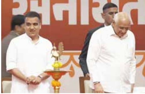
વિભાગોમાં વર્ગ-3ની વિવિધ સંવર્ગની જગ્યાઓ ભરવામાં આવી છે. નિમણૂક મેળવનાર ઉમેદવારો મહેસૂલ, ગૃહ, શિક્ષણ અને નાણાં વિભાગ સહિતના મહત્વના વિભાગોમાં

રાજ્યના 4473 યુવાનો માટે આજનો દિવસ મહત્વનો સાબિત થયો છે. સરકારી ભરતી પ્રક્રિયાની લાંબી રાહ જોયા બાદ ગાંધીનગરના મહાત્મા મંદિર ખાતે આજે શનિવારે યોજાયેલા ભવ્ય સમારોહમાં રાજ્યના 4,473 જેટલા ઉમેદવારોને નિમણૂક પત્રો એનાયત કરવામાં આવ્યા હતા. આ મેગા ભરતી અભિયાન ગુજરાત ગોણ સેવા પસંદગી મંડળ (GSSSB) દ્વારા હાથ ધરવામાં આવ્યું હતું. સૂત્રોમાંથી પ્રાપ્ત માહિતી મુજબ આ ભરતી પ્રક્રિયાને પૂર્ણ થતાં એકથી બે વર્ષનો સમયગાળો લાગ્યો છે.