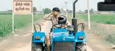
ટ્રેક્ટર લખ્યું હતું અને નિયમના ભંગમાં હેલ્મેટ ન પહેર્યાનો ઉલ્લેખ હતો. દાણાલીમડા જંકશન પાસે કે ટ્રાફિક પોલીસ સ્ટેશનની હદમાં આ મેમો આપવામાં આવ્યો હતો. ટ્રેક્ટર ચાલકને હેલ્મેટના પહેરવા બદલ 500 રૂપિયાના દંડ ફટકારવામાં આવ્યો હતો.

અમદાવાદ | અમદાવાદ ટ્રાફિક પોલીસ દ્વારા ટ્રાફિક નિયમોનો ભંગ કરનાર વાહનચાલકો સામે કાર્યવાહી કરી સ્થળ પર દંડ અથવા ઈ-મેમો આપવામાં આવે છે. ત્યારે થોડા દિવસ અગાઉ પોલીસે એક ટ્રેક્ટરચાલકને હેલ્મેટ ન પહેરવા બદલ ઈ-મેમો આપવામાં આવ્યો છે. પોલીસે આપેલો આ ઈ-મેમો હાલ સોશિયલ મીડિયામાં વાઈરલ થયો છે. હવે ટ્રાફિક પોલીસે મેમો કોણે મોકલ્યો તેની શોધખોળ શરૂ કરી છે. અમદાવાદ ટ્રાફિક પોલીસ દ્વારા 31 ઓક્ટોબર, 2025ના રોજ 9 વાગ્યાની આસપાસ એક ટ્રેક્ટરચાલક વિરુદ્ધમાં ઈ-મેમો ઈશ્યુ કરવામાં આવ્યો હતો. આ મેમોમાં વાહનનો પ્રકાર ફોર્મર