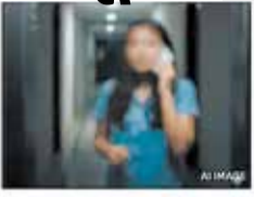
ગભરાયેલી યુવતીએ અભયમ હેલ્પલાઇનને ફોન કર્યો હતો