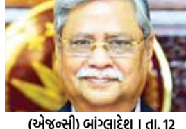
(એજન્સી) બાંગ્લાદેશ । તા. 12

બાદ રાષ્ટ્રપતિ જ દેશના એકમાત્ર બંધારણીય રૂપથી સત્તાવાર પદાધિકારી રહી ગયા હતા. શહાબુદ્દીનેને 2023માં આવામી લીગના ઉમેદવાર તરીકે પાંચ વર્ષના કાર્યકાળ માટે બિનહરીફ ચૂંટવામાં આવ્યા હતા. પરંતુ, આવામી લીગને 12 ફેબ્રુઆરીએ યોજાનારી ચૂંટણીમાં ભાગ લેવાથી પ્રતિબંધિત કરી દેવાયા છે. બાકાના રાષ્ટ્રપતિ ભવનથીથી વોટ્સએપ દ્વારા આપેલા ઈન્ટરવ્યુમાં તેમણે કહ્યું કે, ‘હું હવે આ પદ પર રહેવા નથી ઈચ્છતો. હું પદ છોડવા ઈચ્છું છું, બહાર જવા ઈચ્છું છું. હું ફક્ત ચૂંટણી સુધી જ આ પદ પર રહીશ. જ્યાં સુધી ચૂંટણી ન થઈ જાય માટે રહેવું જોઈએ. હું ફક્ત એટલા માટે જ પદ પર છું કારણકે, આ બંધારણીય જવાબદારી. યુનુસની નેતૃત્વવાળી વચગાળાની સરકારે મને સંપૂર્ણ રીતે હાંસિયામાં ધકેલી દીધો છે. યુનુસે લગભગ સતત મહિનાથી મને મળ્યા નથી, તેમના પ્રેસ વિભાગને દૂર કરવામાં આવ્યો હતો અને વિશ્વભરના દૂતાવાસ અને મિત્રાનમાંથી મારો ફોટો પણ ઉતારી લેવાયો છે.’