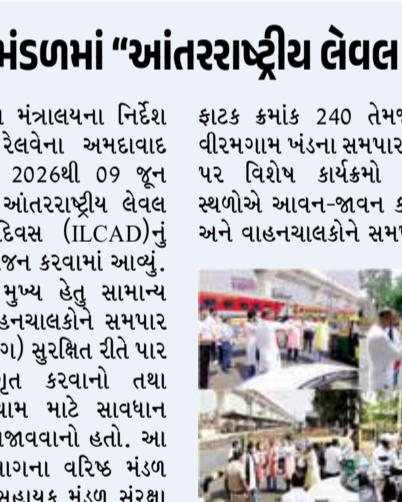
અમદાવાદ મંડળમાં “આંતરરાષ્ટ્રીય લેવલ કોસિંગ જાગૃતિ દિવસ”નું આયોજન.

અમદાવાદ : રેલ મંત્રાલયના નિર્દેશ અનુસાર પશ્ચિમ રેલવેના અમદાવાદ મંડળમાં 07 જૂન 2026થી 09 જૂન 2026 દરમિયાન આંતરરાષ્ટ્રીય લેવલ કોસિંગ જાગૃતિ દિવસ (ILCAD)નું સફળતાપૂર્વક આયોજન કરવામાં આવ્યું. આ અભિયાનનો મુખ્ય હેતુ સામાન્ય નાગરિકો અને વાહનચાલકોને સમપાર ફાટકો (લેવલ કોસિંગ) સુરક્ષિત રીતે પાર કરવા અંગે જાગૃત કરવાનો તથા અકસ્માતોની રોકથામ માટે સાવધાન રહેવાનું મહત્વ સમજાવવાનો હતો. આ પ્રસંગે સંરક્ષા વિભાગના વરિષ્ઠ મંડળ સંરક્ષા અધિકારી, સહાયક મંડળ સંરક્ષા અધિકારી તથા સંરક્ષા સલાહકારોના નેતૃત્વ હેઠળ વિવિધ વિભાગોની સંયુક્ત ટીમો દ્વારા વ્યાપક જનજાગૃતિ અભિયાન ચલાવવામાં આવ્યું. અભિયાન અંતર્ગત 07 જૂને અસારવા-હિંમતનગર ખંડના સમપાર ફાટક ક્રમાંક 6 અને 10, 08 જૂને અમદાવાદ-ગેરતપુર ખંડના સમપાર ફાટક ક્રમાંક 305 અને 308 તથા 09 જૂને અમદાવાદ-પાલનપુર ખંડના સમપાર