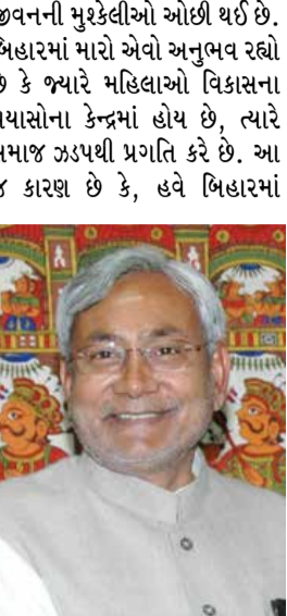
શ્રી નીતિશ કુમાર રાજ્યસભાના સભ્ય અને બિહારના ભૂતપૂર્વ મુખ્યમંત્રી

શૌચાલય, બેંક ખાતા, મકાનો, ગેસ કનેક્શન, નળનું પાણી, આરોગ્ય વીમો અને અન્ય ઘણી પ્રાથમિક જરૂરિયાતો કરોડો લોકો સુધી પહોંચી છે. અનુસૂચિત જાતિ, અનુસૂચિત જનજાતિ, પછાત વર્ગો, અંતિ પછાત વર્ગો, મહિલાઓ, ગરીબ પરિવારો અને વિકાસ કાર્યક્રમોના પ્રથમ પેઢીના લાભાર્થીઓનો મોટો વર્ગ હવે પોતાને ભારતના ગ્રીષ્મ સ્ટોરીમાં સક્રિય સહભાગી તરીકે જોવા લાગ્યો છે. વિશેષ યોજનાઓ દ્વારા યુવાનોને નવી ઉદ્યોગસાહસિકતાની તક મળી છે. મને એમાં કોઈ ટાંકા નથી કે આ જુઓને રાષ્ટ્રીય વિકાસના મુખ્ય પ્રવાહમાં લાવવા એ સામાજિક ન્યાય સુનિશ્ચિત કરવામાં સૌથી મહત્વપૂર્ણ ઉત્કેરક રહ્યું છે. મેં મહિલાઓના કલ્યાણ અને ગૌરવ પર પીએમ મોદીએ આપેલો ભાર પણ જોયો છે. તેમની ઘણી યોજનાઓથી મહિલાઓને સીધો ફાયદો થયો છે અને તેમના રોજિંદા