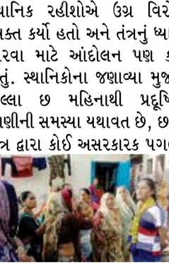
અમદાવાદના અસારવા વિધાનસભાના શાહીબાગ વોર્ડ વિસ્તારમાં આવેલી ભોગીલાલની ચાલીના રહીશો.

અમદાવાદ : અમદાવાદના અસારવા વિધાનસભાના શાહીબાગ વોર્ડ વિસ્તારમાં આવેલી ભોગીલાલની ચાલીના રહીશો છેલ્લા ઘણા સમયથી પીવાના પાણીમાં ગંદકી, દુર્ગંધયુક્ત પાણી અને ઓછા દબાણની ગંભીર સમસ્યાનો સામનો કરી રહ્યા છે. આ મુદ્દે સ્થાનિક રહીશો દ્વારા વારંવાર સંબંધિત અધિકારીઓ અને ચૂંટાયેલા પ્રતિનિધિઓ સમક્ષ રજૂઆતો કરવામાં આવી હોવા છતાં આજદિન સુધી કોઈ કાયમી ઉકેલ આવ્યો નથી. પરિણામે રહીશોમાં ભારે રોષ જોવા મળી રહ્યો છે. પાણી જેવી મૂળભૂત સુવિધાથી લોકો વંચિત રહેતા હોવાના કારણે તેમના દૈનિક જીવન પર ગંભીર અસર પડી રહી છે. સમસ્યાના નિરાકરણ માટે અનેક રજૂઆતો છતાં તંત્ર દ્વારા યોગ્ય કાર્યવાહી ન થતાં આજે