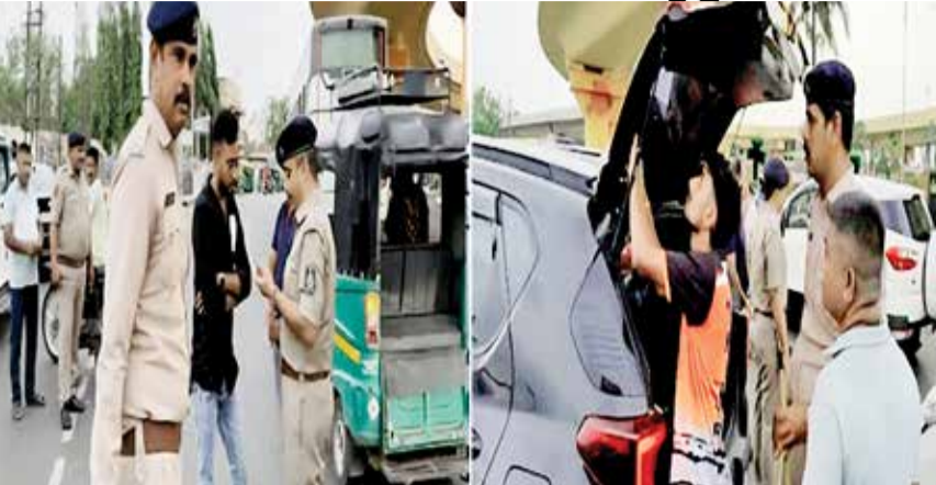
વાહનચાલકો સામે કેસો કરવામાં આવ્યા હતા. પોલીસ તંત્ર દ્વારા જણાવવાયું હતું કે માર્ગ સુરક્ષા અને ટ્રાફિક શિસ્ત જળવાઈ રહે તે માટે આવી વિશેષ ડ્રાઇવો આગામી સમયમાં પણ ચાલુ રાખવામાં આવશે. ટ્રાફિક નિયમોનું પાલન કરી સુરક્ષિત વાહન વ્યવહાર માટે પોલીસ દ્વારા વાહનચાલકોને અપીલ પણ કરવામાં આવી હતી.

જામનગર શહેરમાં ટ્રાફિક નિયમોના અસરકારક અમલ અને માર્ગ સુરક્ષા અંગે જાગૃતિ લાવવાના હેતુથી સાતરસ્તા વિસ્તારમાં વિશેષ ટ્રાફિક ડ્રાઇવનું આયોજન કરવામાં આવ્યું હતું. શહેર વિભાગના ડીવાયઝેસપીના માર્ગદર્શન અને ઉપસ્થિતિમાં યોજાયેલી આ ડ્રાઇવ દરમિયાન ટ્રાફિક પોલીસની ટીમે સઘન ચેકિંગ હાથ ધર્યું હતું. ડ્રાઇવ દરમિયાન સાતરસ્તા વિસ્તારમાંથી પસાર થતા અનેક વાહનોની તપાસ કરવામાં આવી હતી. ખાસ કરીને ફોરવ્હીલ વાહનોમાં ગેરકાયદેસર રીતે લગાવવામાં આવેલી ડાર્ક ફિલ્મ સામે ગુંબેશ ચલાવવામાં આવી હતી. પોલીસે અનેક કારોને અટકાવી તેમની તપાસ કરી હતી, અને નિયમોનો ભંગ કરતી ગાર્ડીઓમાંથી ડાર્ક ફિલ્મ દૂર કરાવી સંબંધિત વાહનચાલકો સામે દંડાત્મક કાર્યવાહી હાથ ધરી હતી.આ ઉપરાંત સીટ બેલ્ટનો ઉપયોગ ન કરવો, જરૂરી દસ્તાવેજો સાથે ન રાખવા, ટ્રાફિક નિયમોનું ઉલ્લંઘન કરવું સહિતના વિવિધ ભંગ બદલ પણ અનેક