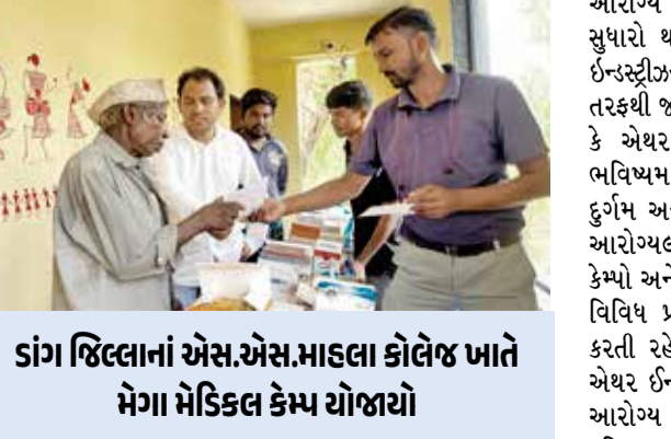
ડાંગ જિલ્લાનાં એસ.એસ.માહલા કોલેજ ખાતે મેગા મેડિકલ કેમ્પ યોજાયો