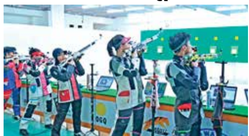
નવી દિલ્હી | તા. 09

ભારત હવે વિશ્વભરના ખેલાડીઓ માટે શ્રેષ્ઠ રમતગમત તાલીમનું મુખ્ય ગંતવ્ય બની રહ્યું છે. તાજેતરમાં, ઇન્ડોનેશિયાની ૧૬ સભ્યોની શૂટિંગ ટીમ અને તેમના બે કોચની ટીમે ભારતના ગગન નારંગ સ્પોર્ટ્સ પ્રમોશન ફાઉન્ડેશન (GNSPF) ના પુણે અને હૈદરાબાદ સ્થિત કેન્દ્રો ખાતે ત્રણ મહિનાનો સઘન તાલીમ કેમ્પ પૂર્ણ કર્યો છે.